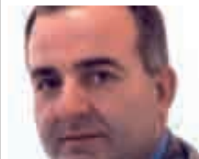
... Cristiano Cipriano Sindaco di Casal di Principe.

Camorra, immondizia, abusivismo edilizio e politica corrotta. Basterà un calendario sexy per migliorare l'immagine di Casal di Principe?