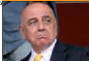
L'ad del Milan: attriti con Ancelotti.