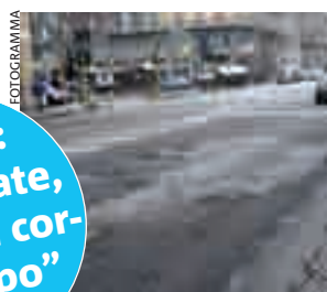
Buche a Porta Venezia.