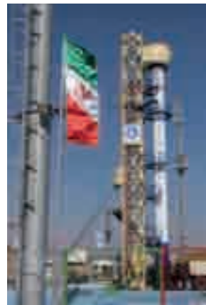
Il lancio del satellite.