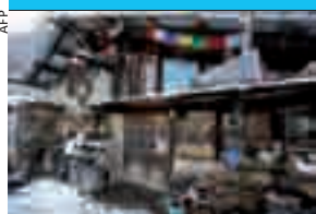
L'abitazione di Massat.