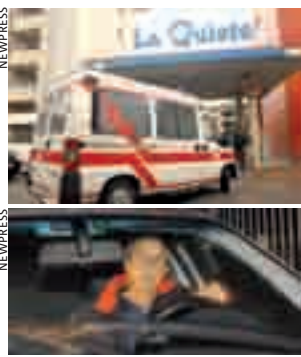
L'arrivo dell'ambulanza con Eluana e le proteste dei movimenti per la vita. Sopra, il padre.

STEFANIA DIVERTITO stefania.divertito@metroitaly.it