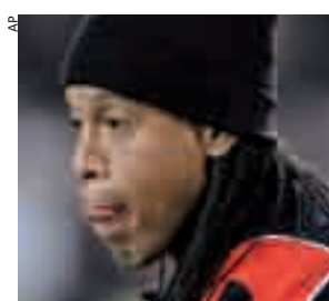
Il brasiliano Ronaldinho.

A forzare la situazione l'arrivo in città del fratello-manager Roberto Assis che vuol capire perché Dinho non gioca più e poi l'interesse del solito Manchester City emerso dai tabloid inglesi. Per ragioni contrattuali il brasiliano sarà titolare stasera nell'amichevole raccattasoldi di Glasgow (800 mila euro il gettone) e