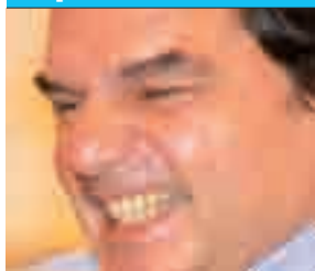
Renato Brunetta, ministro della Funzione Pubblica.