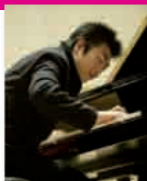
Il pianista Lang Lang.