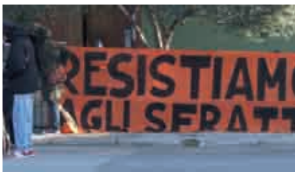
Il rischio di ipoteche forzose aumenta per i cittadini italiani.

FISCO. Basta un debito di 5 mila euro e lo spettro del pignoramento della propria abitazione si concretizza. Non siamo di fronte a una probabilità, ma per il Codacons ora è un rischio reale. L'associazione dei consumatori punta il dito sull'articolo 32 del Dl anti-crisi, diventato legge pochi giorni fa: qui infatti è prevista l'espropriazione (senza preventiva iscrizione di ipoteca) anche quando il credito da riscuotere non supererà il 5% del valore dell'immobile da vendere all'asta. Non solo, ma la denuncia del Codacons prende di mira la riduzione da 8 mila a 5 mila euro del limite di importo al di sotto del quale l'agente di riscossione non può procedere all'espropriazione immobiliare, consentendo di avviare direttamente l'espropriazione. Ciò accentuerebbe il