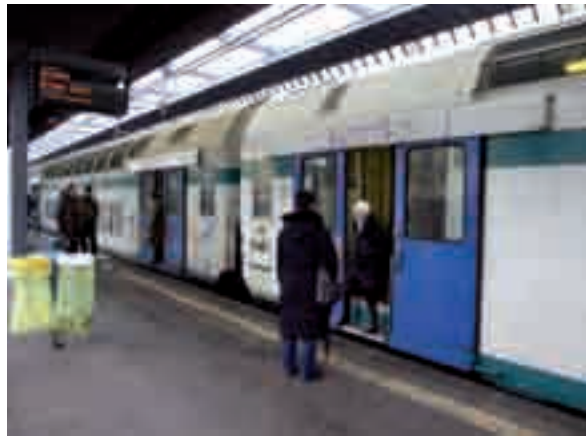
La stazione in cui è avvenuto uno dei due stupri a Milano.

Una donna di 37 anni ha raccontato ai carabinieri di essere stata sequestrata, picchiata e di aver subito un tentativo di stupro a Piove di Sacco (Padova). Fermato un nord africano di 27 anni. METRO