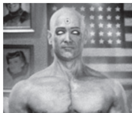
Riuscirà il Dr. Manhattan a fermare il tempo?