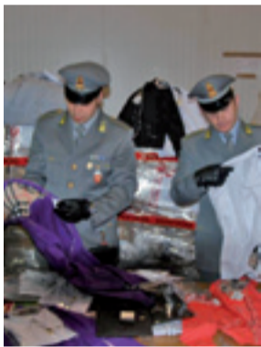
METRO La merce sequestrata.

FIUMICINO. Avrebbero fruttato dieci milioni di euro, se immessi sul mercato, i 150 mila capi di abbigliamento e accessori col falso marchio "Burberry" sequestrati ieri alla dogana dell'aeroporto Leonardo da Vinci. Denunciati dalla Guardia di Finanza tre cittadini cinesi e due italiani.