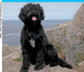
Coral, la madre del "first dog".