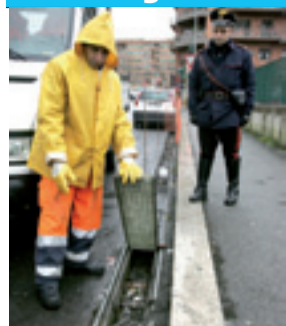
Le grate che stavano per essere rubate.