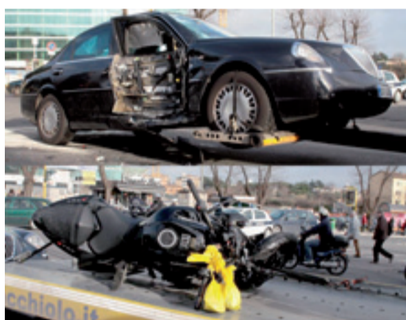
L'incidente su via Cristoforo Colombo, davanti alla Regione.

era poco distante dal punto dell'impatto, sembra che la Lancia Thesis abbia effettuato una manovra vietata, una svolta non consentita in direzione Tor Marancia, prima dei vecchi locali della Fiera di Roma. «C'è stata una distrazione da parte dell'autista», si apprende da fonti della polizia municipale. E.O.