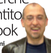
di Francesco Facchini