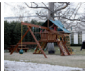
Il complesso in legno.