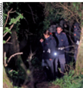
Roma, il luogo della violenza

ROMA. Risputa la pista del terzo uomo nel giallo dello stupro della Caffarella. Ieri, proprio mentre arrivava la conferma che il dna trovato sui reperti non appartiene ai due romeni indagati e detenuti per lo stupro né al fidanzato della vittima 14enne, in gran segreto un funzionario della Squadra Mobile romana è verso un paesino della Romania: Boutrosani. Obiettivo della missione, alla quale partecipa anche uno dei funzionari della polizia romana distaccati in Italia, confrontare il dna "orfano" trovato alla Caffarella con quel-