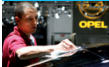
Il mondo dell'auto al tracollo.