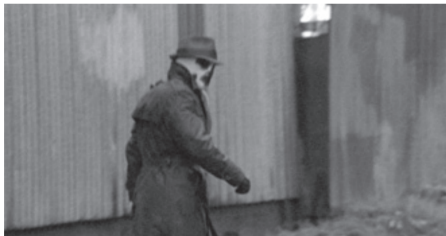
Ultimo avvistamento di Rorschach, New York 1977

Dall'introduzione della legge Keene nel 1977, il vigilante Rorschach è diventato un vero e proprio incubo per la polizia di New York. La sua incessante e spietata ricerca di criminali ha spesso causato conseguenze letali per chiunque abbia attraversato la sua strada. Lo scorso mese, Chris Duthrie, il portavoce ufficiale della Polizia di New York, ha rilasciato la seguente dichiarazione: "Rorschach è un assassino violento e mascherato che si ritiene al di sopra della legge. La Polizia di New York non tollererà il suo comportamento e sta attualmente seguendo nuovi indizi che consegneranno presto questo famigerato vigilante nelle