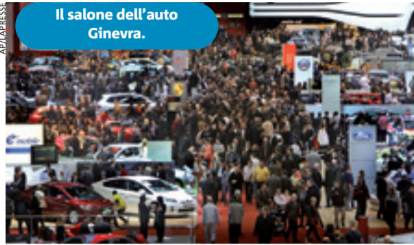
Il salone dell'auto Ginevra.