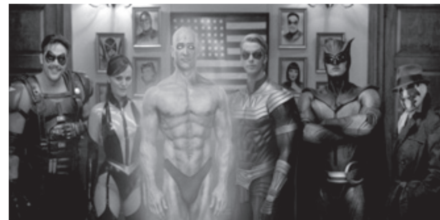
I Watchmen (s.-d.): Il Comico, Spettro di Seta, Dr. Manhattan, Ozymandias, Gufo Notturmo e Rorschach

Ora, mentre il numero di reati continua a crescere, la Guerra Fredda sembra pronta ad assumere dimensioni nucleari e l'intero mondo barcolla a un passo dall'Armageddon, è arrivato certamente il momento di chiedere agli Watchmen di tornare.