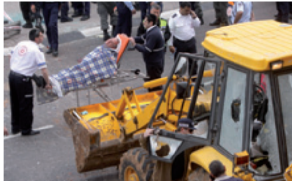
La gru che si è scagliata contro le vetture israeliane.

A Gerusalemme intanto un attentatore suicida ha provocato il ferimento di due agenti di polizia israel-