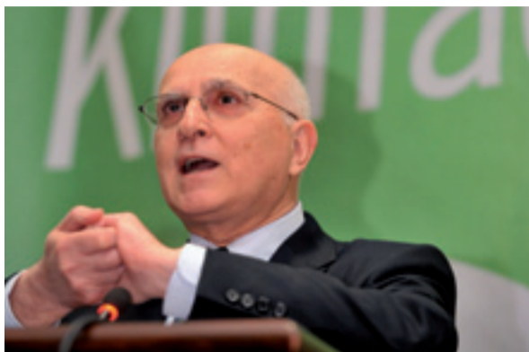
Il conservatore greco Stavros Dimas, commissario all'Ambiente.

Durante una crisi ci focalizziamo sui posti di lavoro e la crescita, ma questo non significa che il nostro ambiente, la sua protezione e la battaglia contro i cambiamenti climatici debbano essere accantonati. Affrontare i cambiamenti climatici e combattere la crisi sono cose che possono andare insieme. La strategia su energia e clima che abbiamo avviato a dicembre 2008 può aiutare a combattere la crisi. È un New Deal verde: aiuta a