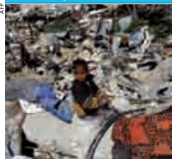
Il racconto di un giornalista di Metro.