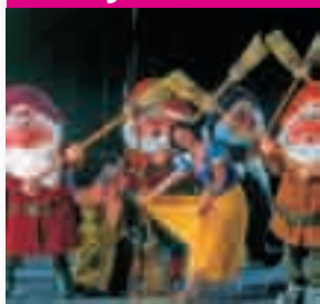
Biancaneve con i nani.