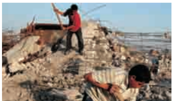
Le rovine di Gaza alla fine dell'offensiva israeliana di inizio anno.

BOGOTÀ. Il parlamentare colombiano Luis Eladio Perez e Ingrid Betancourt avrebbero avuto una love story quando erano entrambi ostaggi delle Farc. A rivelarlo la stessa moglie di Perez, la quale ha aggiunto di aver perdonato il marito «che, come Ingrid, ha passato un lungo periodo nell'inferno». METRO