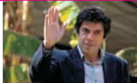
L'attore che domenica e lunedì porterà su Rai Uno la fiction "Pane e libertà".