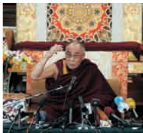
Il Dalai Lama ieri a Dharamsala.

Sarà permessa la pubblicità di vino e birra sul web