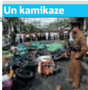
Decine di morti.