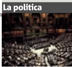
La politica Ieri il voto in commissione Sanità.