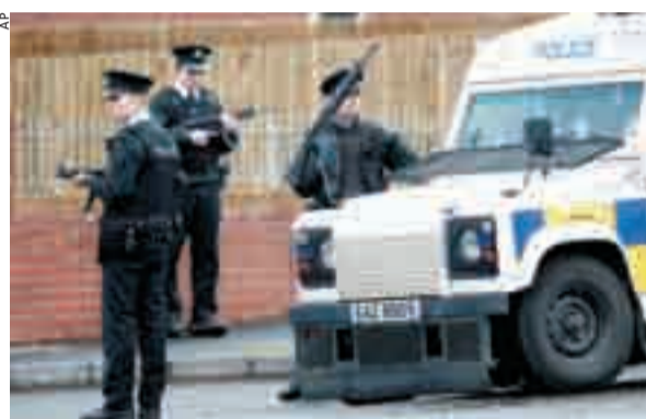
La vittima stava facendo un pattugliamento notturno in auto.

causato la morte di due soldati e il ferimento di altre quattro persone nell'attacco ad una caserma. Per la morte dell'agente, la polizia britannica ha arrestato due persone, un diciottenne e un uomo di 37 anni.