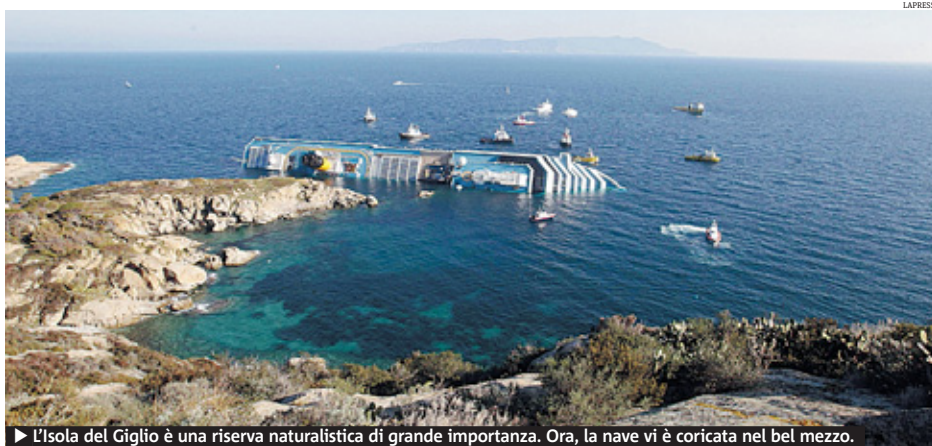
► L'Isola del Giglio è una riserva naturalistica di grande importanza. Ora, la nave vi è coricata nel bel mezzo.

Ed è intervenuto anche il ministro dell'Ambiente Corrado Clini: «La zona del naufragio è all'interno di un parco nazionale, in un'area di enorme valore naturalistico. Questi condomini galleggianti stanno diventando un problema». Oggi pomeriggio il ministro affronterà il problema in un vertice alla prefettura di Livorno. Una riunione già programmata per esaminare la situazione venutasi a creare dopo la perdita in mare di 198 fusti con sostanze pericolose, ancora dispersi, e predisporre le misure per prevenire ogni rischio per l'ambiente e la salute pubblica. ● METRO