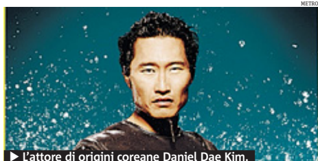
L'attore di origini coreane Daniel Dae Kim.

TV Coreano di nascita, statunitense d'adozione, Daniel Dae Kim (il Jin di "Lost") affronta un nuovo ruolo, quello di Chin Ho Kelly nel remake della serie di successo "Hawaii Five-0" (ogni martedì alle 21 su AXN). Per questo cop drama rimarrà a vivere lì dove è stato girato il classico cult di J.J. Abrams.