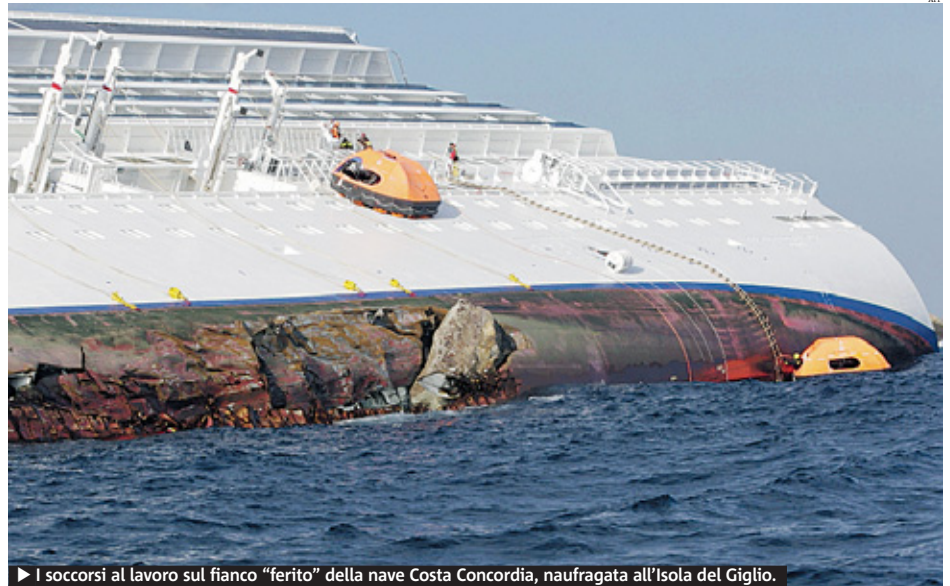
► I soccorsi al lavoro sul fianco "ferito" della nave Costa Concordia, naufragata all'Isola del Giglio.

Schettino ha anche smentito l'accusa di avere abbandonato prima di