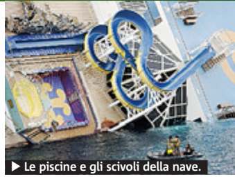
► Le piscine e gli scivoli della nave.