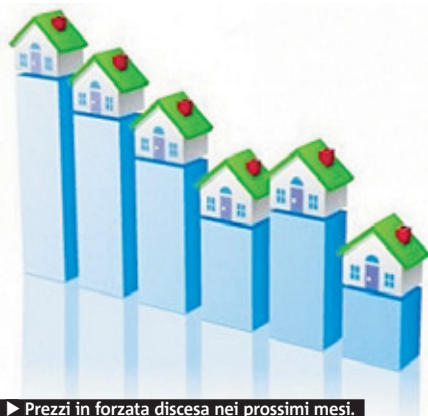
► Prezzi in forzata discesa nei prossimi mesi.

Anche l'ufficio studi Tecnocasa - considerato il contesto macroeconomico più che mai incerto - prevede nel 2012 per la Capitale prezzi sostanzialmente stabili, con una tenuta degli immobili di altissima gamma. ● METRO