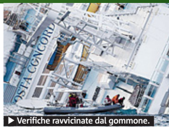
► Verifiche ravvicinate dal gommone.