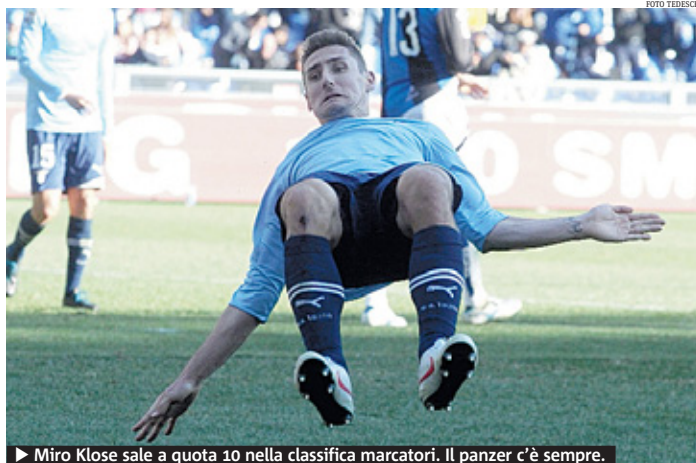
► Miro Klose sale a quota 10 nella classifica marcatori. Il panzer c'è sempre.

sta ha risposto stizzito: «L'anno scorso sono arrivato quarto e sono stato fischiato fino alla fine, è un'abitudine. Non vedo chi dovevo mettere in campo, chi dovevo schierare secondo lei che ha fatto la domanda?»