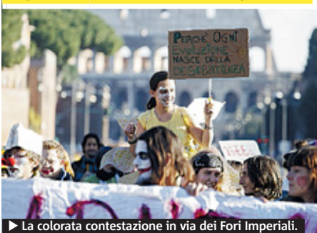
► La colorata contestazione in via dei Fori Imperiali.