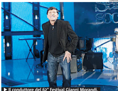
Il conduttore del 62° Festival Gianni Morandi.

TV «Non ce la siamo sentita di far finta di nulla davanti alla tragedia». Così la Dandini ha spiegato su Twitter perché ha fatto saltare la prima del suo show su La7. «Era giusto lasciare spazio alle news», ha detto. METRO