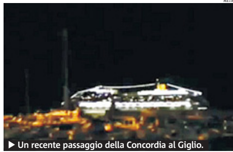
► Un recente passaggio della Concordia al Giglio.