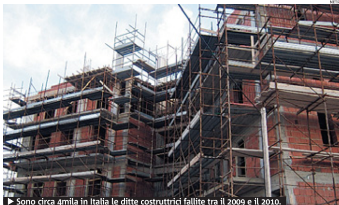
► Sono circa 4mila in Italia le ditte costruttrici fallite tra il 2009 e il 2010.