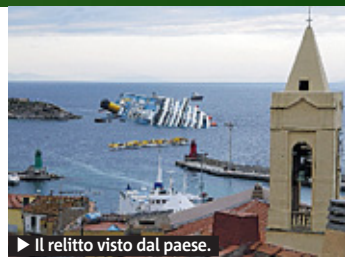
► Il relitto visto dal paese.