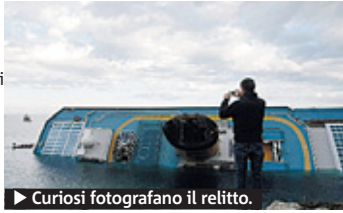
► Curiosi fotografano il relitto.

► Lavoro senza fine per il recupero dei superstiti e la messa in sicurezza del relitto inclinato al Giglio.