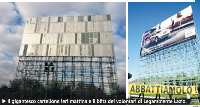
▶ Il gigantesco cartellone ieri mattina e il blitz dei volontari di Legambiente Lazio.