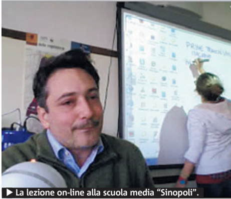
► La lezione on-line alla scuola media "Sinopoli".