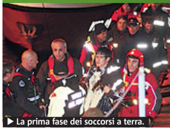
► La prima fase dei soccorsi a terra.