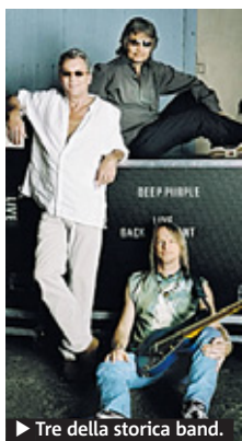
▶ Tre della storica band.

ROCK Ritorno nella Capitale per i leggendari Deep Purple. La band inglese sarà in scena il 25 luglio all'Ippodromo delle Capannelle, osite del festival "Rock in Roma". I biglietti sono già disponibili nei circuiti di vendita ufficiali del festival (e sul sito internet ticketone.it). ● S. M.