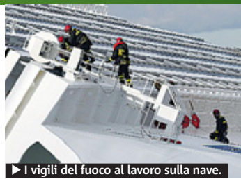
► I vigili del fuoco al lavoro sulla nave.