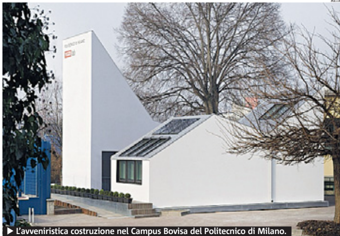
► L'avveniristica costruzione nel Campus Bovisa del Politecnico di Milano.

dinamico dell'involucro progettato, al fine di validare i modelli analitici adottati. È stato, infatti, predisposto un sistema di sensori di temperatura superficiale e di intercapedine che, insieme a ulteriori contatori, formerà il calcolo del consumo energeti-