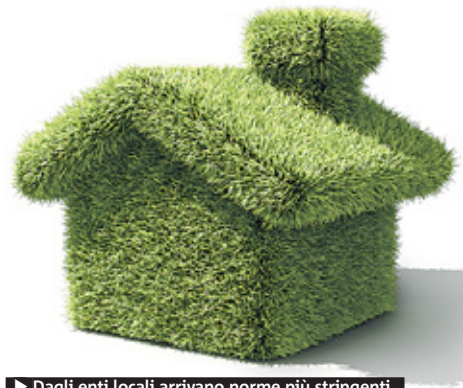
► Dagli enti locali arrivano norme più stringenti.

Complessivamente sono 20 milioni i cittadini che vivono nei Comuni dove sono in vigore questi strumenti innovativi. Il dato arriva dal Rapporto Onre (Osservatorio nazionale Regolamenti edilizi per il risparmio energetico) di Legambiente e Cresme, che da cinque anni fotografa il cambiamento in atto nella filiera delle costruzioni e ne racconta la costante crescita (erano 705 i Regolamenti sostenibili nel 2010, rispetto al 2008 il dato è aumentato di quattro volte), a partire proprio dalle novità intro-