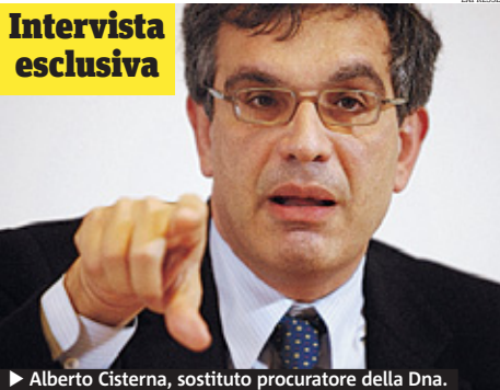
▶ Alberto Cisterna, sostituto procuratore della Dna.