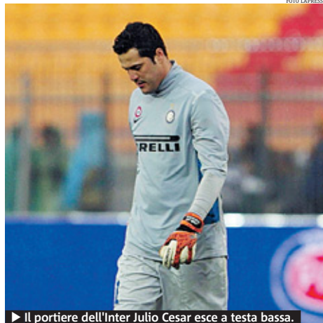
► Il portiere dell'Inter Julio Cesar esce a testa bassa.

zio, Ranieri aveva salvato almeno il risultato, in quella di ieri c'è poco da salvare. Forse il palo di Samuel al 52', forse i due gol in fuorigioco. Di sicuro non la mancanza di freddezza di Milito che all'11'