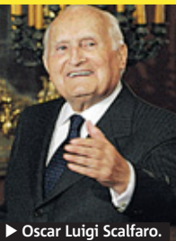
▶ Oscar Luigi Scalfaro.