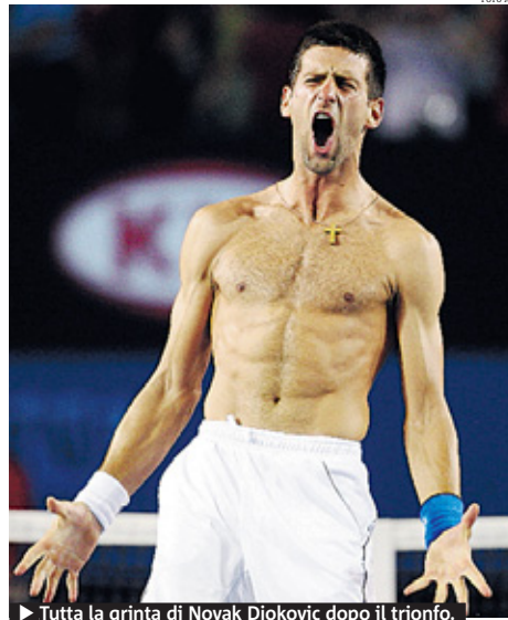
► Tutta la grinta di Novak Djokovic dopo il trionfo.

«Ringrazio Rafael perché è uno dei più grandi giocatori di tennis di tutti