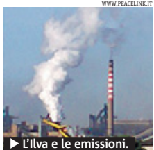
► L'ilva e le emissioni.

TARANTO Le emissioni di gas, vapori, polveri e diossina dell'Ilva creano pericoli per la salute dei suoi lavoratori e della gente. Quanto da anni denunciano le associazioni (Peacelink in testa) è scritto nella relazione che i periti chimici hanno depositato al gip, prima parte di una maxi-perizia nell'in-