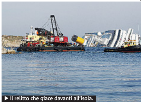
► Il relitto che giace davanti all'isola.

Poi c'è il problema dei traghetti che, con l'accesso al porto limitato, potrebbero aver difficoltà e diminuire le corse giornaliere. C'è già chi pensa a un comitato. «Bisognerebbe trovare un accesso alternativo», ha replicato Gabrielli. ● METRO