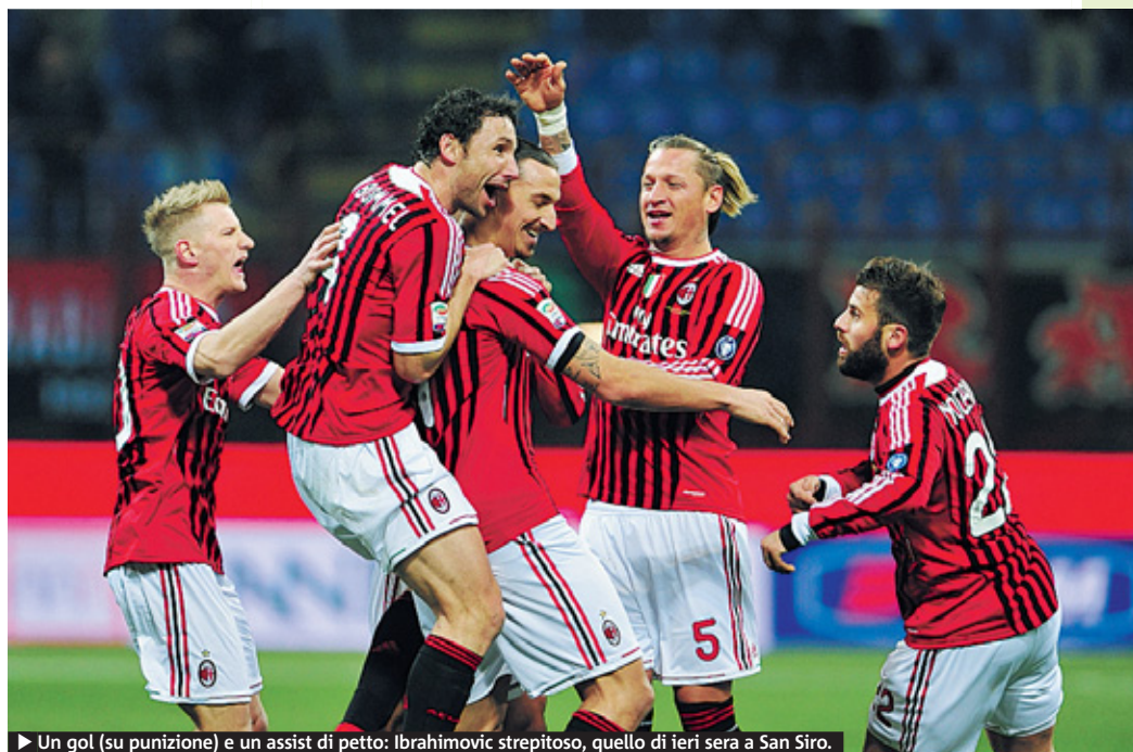
► Un gol (su punizione) e un assist di petto: Ibrahimovic strepitoso, quello di ieri sera a San Siro.

Campionato. L'Inter ko a Lecce viene riscavalcata dalla Lazio