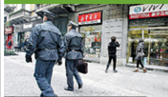
► Finanziari ieri in via Paolo Sarpi.