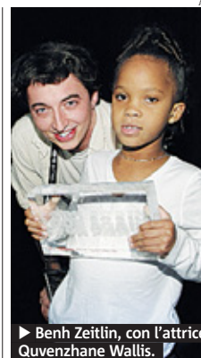
Benh Zeitlin, con l'attrice Quvenzhané Wallis.