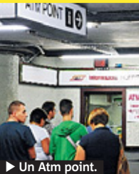
► Un Atm point.