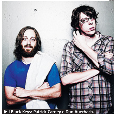
► I Black Keys: Patrick Carney e Dan Auerbach.

MUSICA Sarà un lunedì a tutto rock. Con una delle realtà più entusiasmanti della scena americana, capace di mettere d'accordo pubblico e critica. Tutti pazzi per i Black Keys, il duo di Akron, Ohio, autori di uno dei migliori dischi della stagione, "El camino", uscito il 6 dicembre scorso. Un bel risultato per questo duo capace di suonare come una band a pieno regime, con un sound che mescola rock, blues, hip hop, folk e altro ancora. «Non ci mettiamo d'accordo prima di suonare, non proviamo prima di registrare, semplicemente ci buttiamo - spiega Dan Auerbach, voce e chitarra - È un album davvero rock and roll: diretto, trascinate e semplice. Renderà bene anche dal vivo». E grande attesa c'è, infatti, per il loro concerto di stasera all'Alcatraz, "tutto esaurito" da settimane. «Abbiamo percorso una lunga strada per arrivare fino a qui - aggiunge il batterista Patrick Carney - È