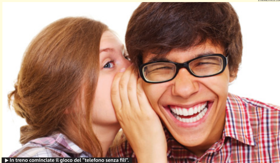
► In treno cominciate il gioco del "telefono senza fili".