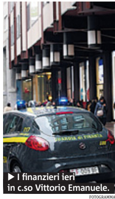
► I finanziari ieri in c.so Vittorio Emanuele.

FISCO Un weekend all'insegna dei controlli della finanza quello appena trascorso a Milano. Ieri, dalle 10 del mattino alle 18 di sera, 120 militari delle Fiamme Gialle hanno "battuto" esercizi commerciali di ogni tipo nei pressi di Cadorna, Buenos Aires, Vittorio Emanuele e Sarpi. Risultato? Degli oltre 230 verbali elevati, ben 75 sono stati per mancata emissione dello scontrino. In pratica, un terzo delle centinaia tra bar, ristoranti e negozi controllati, non emette ricevuta fiscale. La multa in questi casi per il commerciante è di 150 euro e alla terza segnalazione scatta la chiusura temporanea del locale. Ma l'operazione di ieri era finalizzata anche al controllo e alla confisca di merce contraffatta. Qui i risultati parlano di un centinaio di pezzi sequestrati e di due extracomunitari denunciati.