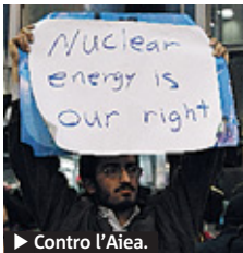
► Contro l'Aiea.

IRAN. Basta esportazioni di petrolio verso «certi» paesi. È la minaccia arrivata per bocca del ministro del petrolio, Rostam Qassemi, mentre il Parlamento lavora a un provvedimento per interrompere l'export verso l'Unione europea. Una contro-reazione alle sanzioni Ue in vigore dal prossimo luglio.