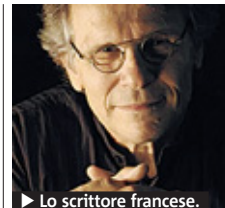
► Lo scrittore francese.

e ambizioso album "Il mondo nuovo", mentre in serata alla Salumeria della Musica per "Rock Files Live" ci sarà un omaggio a Tenco con Carlotta, Giancarlo Onorato, Alessandro Grazian e Mauro Ermanno "Gio" Giannardi (ore 21, ingresso gratuito con obbligo di prenotazione su www.lifegate.it ). ● DIEGO PERUGINI