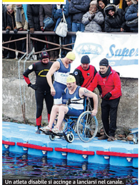
Un atleta disabile si accinge a lanciarsi nel canale.