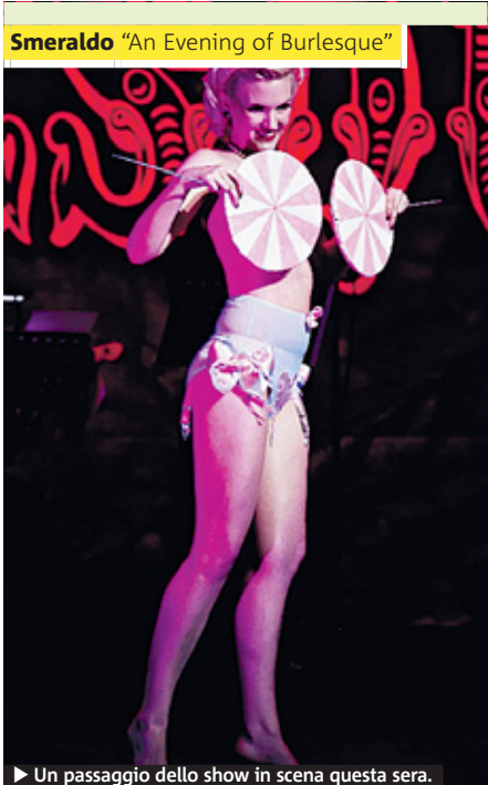
Smeraldo "An Evening of Burlesque"