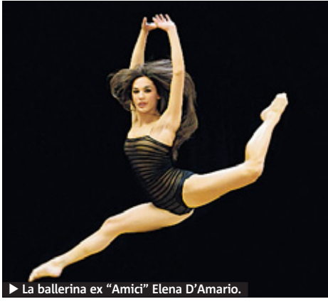
La ballerina ex "Amici" Elena D'Amario.