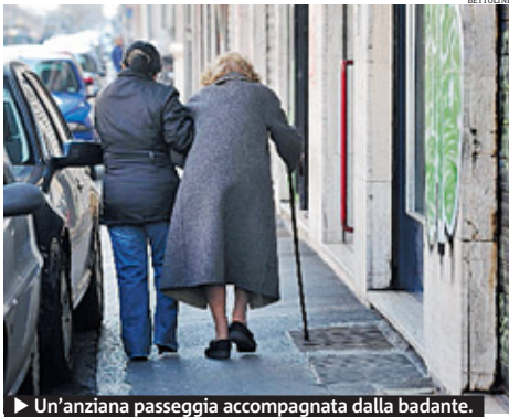
► Un'anziana passeggia accompagnata dalla badante.

Un fenomeno al quale le istituzioni stanno rispondendo. A Milano, da fine