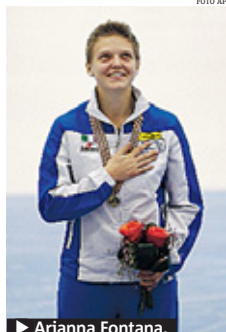
► Arianna Fontana.

verare nulla ai ragazzi che hanno dato tutto, ma non siamo riusciti a venire a capo della gara. La Champions è il nostro obiettivo e adesso viene il bello ed il difficile perché devo inventare nulla ai ragazzi che hanno dato tutto, ma non siamo riusciti a venire a capo della gara. La Champions è il nostro obiettivo e adesso viene il bello ed il difficile perché devo inventare nulla ai ragazzi che hanno dato tutto, ma non siamo riusciti a venire a capo della gara. La Champions è il nostro obiettivo e adesso viene il bello ed il difficile perché devo inventare nulla ai ragazzi che hanno dato tutto, ma non siamo riusciti a venire a capo della gara. M.C