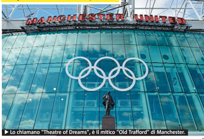
► Lo chiamano “Theatre of Dreams”, è il mitico “Old Trafford” di Manchester.

Olimpiadi L'Old Trafford a Cinque Cerchi