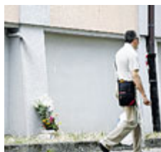
► Dove è morto il piccolo

ranno. Quindi è già tutto deciso? No, stiamo cercando di migliorare le strutture per salvaguardare le aree verdi. Comunque il nostro interlocutore è la Zona, non i comitati. Per non perdere il finanziamento del Miur, il cantiere dovrà partire entro il 18 agosto, siamo nei tempi? Il Politecnico, che incontrerò domani (oggi, ndr) ha chiesto una proroga. Ma, ripeto, la costruzione si farà. ● AN.SPA.