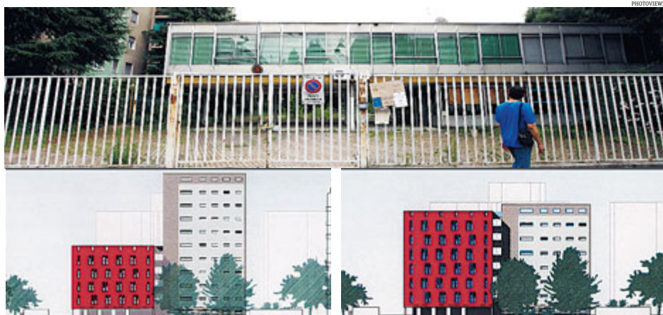
► I rendering del progetto originale delle torri, a destra la possibile variazione presentata ai residenti. In alto la ex scuola.