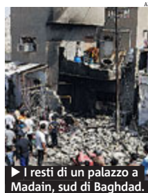
▶ I resti di un palazzo a Madain, sud di Baghdad.

IRAQ È di 107 morti e 268 feriti il bilancio di questa nuova giornata di sangue in Iraq, la più violenta degli ultimi due anni. Nel secondo giorno di Ramadan per gli iracheni, una lunga serie di esplosioni, circa 26, hanno colpito diverse province del Paese prendendo di mira sia poliziotti che civili. Il numero maggiore di attentati si registra a Kirkuk, ma autobomba o ordigni piazzati sul terreno sono esplosi anche a Taji, a Baghdad, nella provincia di