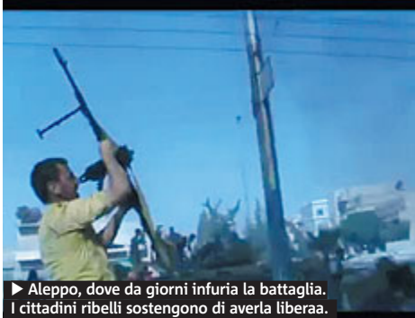
▶ Aleppo, dove da giorni infuria la battaglia. I cittadini ribelli sostengono di averla liberata.

SIRIA Il regime siriano, sempre più isolato a livello internazionale, ha evocato lo spettro delle armi chimiche: «La Siria non userà armi chimiche o altre armi non convenzionali contro i suoi civili e le impiegherà soltanto nel caso di un'aggressione esterna», ha affermato il portavoce del ministero degli Esteri siriano, Jihad Makdissi, nel corso di una conferenza stampa a Damasco. È la prima ammissione del governo siriano di essere in possesso di un arsenale chimico: finora non ne aveva mai fatto menzione, pur essendo tra gli otto Paesi che non aderiscono alla Conven-