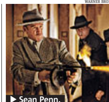
► Sean Penn.