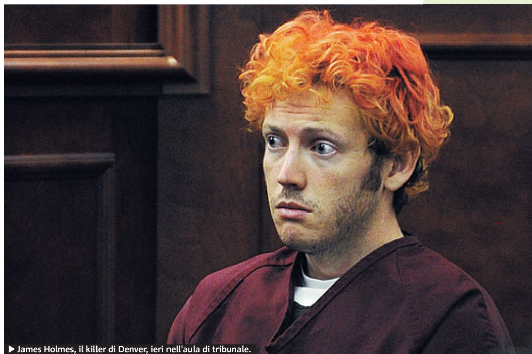
► James Holmes, il killer di Denver, ieri nell'aula di tribunale.

Denver. Il killer di Aurora rischia la pena di morte