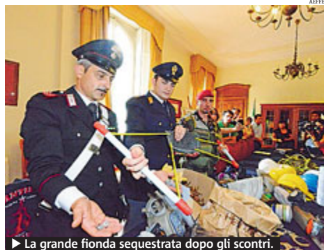
► La grande fionda sequestrata dopo gli scontri.

TORINO Dal presidio contro l'alta velocità a quello contro il passaggio di un convoglio che trasporta scorie nucleari italiane verso la Francia. Così nella notte i No Tav si sono radunati alla stazione ferroviaria di Bussoleno per fermare il "treno atomico", mentre dopo gli scontri di sabato c'è chi - come Pdl, Ugl e Sap - chiede l'invio dell'esercito in Val di Susa, con la proclamazione dello stato di emergenza e la via libera all'utilizzo di proiettili di gomma.