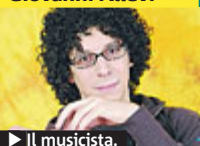
► Il musicista.