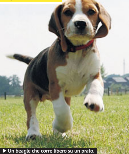
► Un beagle che corre libero su un prato.