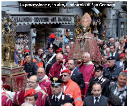
La processione e, in alto, il miracolo di San Gennaro

Per non perdere nulla del fascino partenopeo di questa città si può approfittare dell'offerta dedicata a Napoli dal Portale del Viaggiatore: un biglietto per l'ingresso al museo di San Gennaro e la consumazione di una pizza verace in una