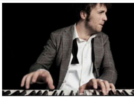
A sinistra Daddy Yankee e, sopra, Raphael Gualazzi