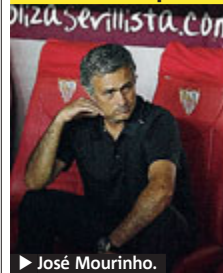
► José Mourinho.