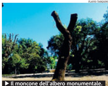
► Il moncone dell'albero monumentale.