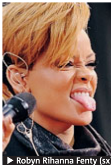
▶ Robyn Rihanna Fenty (sx) e Taylor Alison Swift (dx).

Rihanna e Taylor Swift, dicevamo, concorrono per sei nomination, tre delle quali in comune (Best Pop, Best Female e per la nuova categoria Best Look). Rihanna è anche in lizza per Best Song, Best Video (con "We Found Love") e Biggest Fans. Taylor Swift invece per Best Live e Best World Stage. Justin Bieber avrà l'opportunità