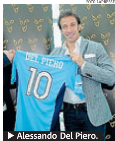
► Alessandro Del Piero.