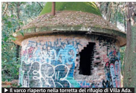
▶ Il varco riaperto nella torretta del rifugio di Villa Ada.

CITTÀ Due vigilesse aggredite sabato notte a piazza Bologna durante controlli anti-alcol. Ad innescare il parapiglia un 27enne che ha rifiutato l'identificazione. Nella colluttazione una vigilesse è caduta a terra e l'altra è rimasta ferita ad un braccio. A loro è giunta la solidarietà del sindaco. METRO