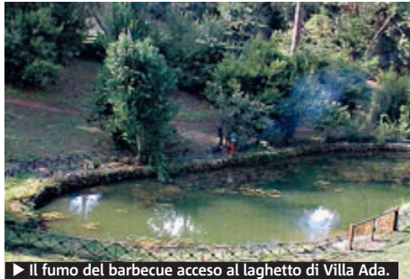
► Il fumo del barbecue acceso al laghetto di Villa Ada.

CITTÀ Salsicce e carne alla brace consumate nel cuore dei parchi urbani, alla faccia di ogni divieto, con l'accensione di fuochi che costituiscono una micidiale fonte di innesco per gli incendi. Eppure quella del barbecue nelle ville storiche romane sembra purtroppo diventata una insana moda estiva. In agosto e i primi di settembre era stata l'associazione Amici di Villa Pamphilj a segnalare l'accensione domenicale dei barbecue, nonostante la presenza dei vigili urbani che non erano intervenuti. In queste settimane è stato