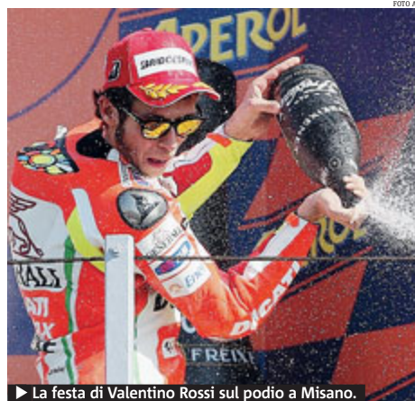
► La festa di Valentino Rossi sul podio a Misano.

Naturalmente la notizia del giorno è arrivata dal Dottore, tornato ai livelli che gli competono sull'asfalto del circuito amico. «È stato molto bello, sono contento - ha detto nel corso del dopo gara ai microfoni di Sportmediast - Ringrazio tutte le persone che anche nei momenti difficili hanno creduto che potessimo farcela». Poi si è lasciato andare ai ricordi per l'amico che non c'è più, quel Marco Simoncelli cui è dedicato il Misano Circuit. «Questo secondo posto è un grande risultato - ha commentato Vale - che voglio assolutamente dedi-