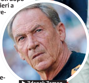
► Zdenek Zeman.

Petkovic felice della sua Lazio, e l'entusiasmo contagia anche Lotito e Hernanes: i biancoazzurri sono primi in classifica con Juventus e Napoli dopo la vittoria di ieri a Verona. Giovedì, sotto col Tottenham. Sciupona e sciagurata la Roma (2-3 col Bologna dopo il 2-0), ma Zeman ostenta la massima serenità {Sport}