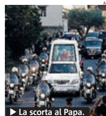
► La scorta al Papa.

LIBANO Missione compiuta per Benedetto XVI che, a 85 anni e in una situazione di tensione estrema in Medio Oriente, è riuscito a portare a termine un pellegrinaggio che si presentava davvero arduo. «Il mondo arabo e il mondo intero avranno visto, in questi tempi agitati, dei cristiani e dei musulmani riuniti insieme per celebrare la pace», ha rivendicato Papa Ratzin-