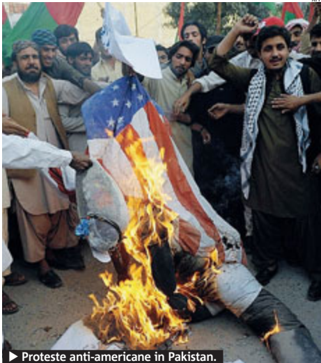
► Proteste anti-americane in Pakistan.

ROMA Resta alta la tensione nel mondo arabo e musulmano per la vicenda del film su Maometto. Gli Stati Uniti hanno ordinato allo staff non essenziale delle ambasciate in Sudan e Tunisia, e a tutti i familiari del personale, di abbandonare questi due Paesi. Il dipartimento di Stato ha anche esortato alla partenza i cittadini americani che si trovano in Tunisia. Le misure sono state prese dopo che le ambasciate in Sudan e Tunisia sono state violentemente assaltate nell'ambito dell'ondata di proteste contro il video anti Islam. Il governo di Khartoum ha però respinto la richiesta americana di inviare marines a protezione dell'ambasciata. Proteste ieri anche in Afghanistan dove diverse centinaia di persone hanno manifestato senza incidenti a Kabul per chiedere che l'autore del film venga processato. In Libia, intanto, le autorità hanno