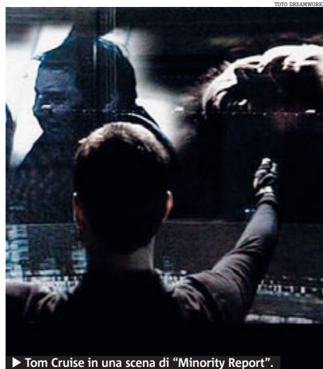
► Tom Cruise in una scena di "Minority Report".

militarizzate, sembra funzionare: nel 2008 (ultimi dati disponibili) nei