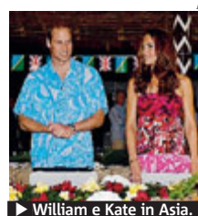
► William e Kate in Asia.

FRANCIA Oggi, nel tribunale di Nanterre vicino Parigi, prima udienza con la richiesta degli avvocati della coppia reale inglese William e Kate di inibire ulteriori pubblicazione delle foto che ritraggono la duchessa a seno nudo. Poi si passerà alla richiesta di danni nei confronti del gruppo Mondadori, editore della rivista francese Closer