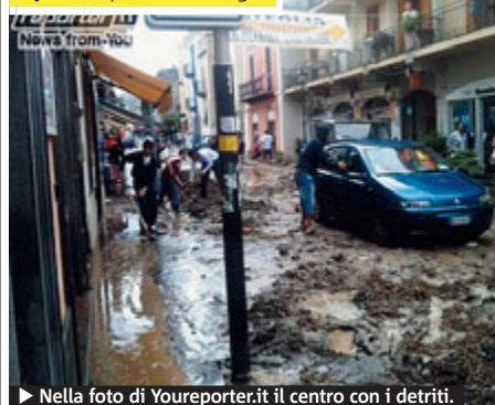
► Nella foto di Youreporter.it il centro con i detriti.