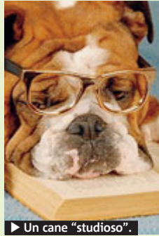
Un cane "studioso".