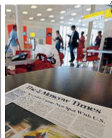
► L'area transiti di Mosca.

La crescita delle droghe sintetiche nel nostro paese è contenuta e attentamente monitorata. Lo sottolinea il Dipartimento Politiche Antidroga che ha attivato in Italia il Sistema Nazionale di Allerta Precoce e Risposta Rapida per le Droghe. «Grazie anche alla collaborazione con il Ministero della Salute e le Forze dell'Ordine - spiega il Dipartimento - si è riusciti a contenere questo fenomeno e questo nuovo mercato che investe soprattutto i più giovani». ● METRO