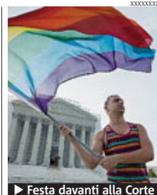
► Festa davanti alla Corte suprema (Washington).

RUSSIA Edward Snowden resta bloccato per il quarto giorno nell'aeroporto di Mosca mentre le cancellerie lavorano al suo caso. Senza più passaporto, non può varcare la frontiera. Altre fonti suggeriscono che l'ex informatico potrebbe comunque avere un visto russo di transito. Intanto l'Ecuador fa sapere che ci potrebbero volere 2 mesi per la concessione dell'asilo politico. Il Venezuela valuterà una eventuale richiesta di accoglienza. Greenwald ha spiegato che Snowden «ha preso delle precauzioni estreme per essere sicuro che diverse persone nel mondo abbiano accesso ai suoi archivi». ● METRO