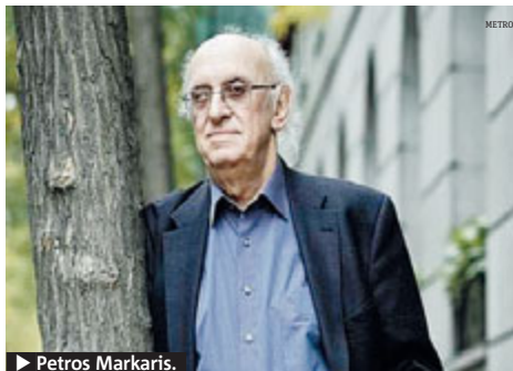
► Petros Markaris.

INTERVISTA Può una crime story raccontare il presente e il futuro dell'Europa? Nel caso di Petros Markaris e del suo eroe, il commissario Kostas Charitos, certamente sì. Ambientati nella Grecia di oggi sull'orlo del default i suoi gialli sono popolati di evasori fiscali, impiegati pubblici con gli stipendi falciati, compreso quello di Charitos e di serial killer vendicatori del popolo sfiancato dalla Troika. L'ultimo della serie, "Resa dei conti", si apre con la festa di Capodanno del 2014 quando Grecia, Spagna e Italia escono dall'euro e la famiglia Charitos festeggia il ritorno alla dracma, prima di finire nel caos. Fiction o previsione? Dice l'uscita dall'euro o la festa? Tutti e due. Sembra che gli scrittori siano più coraggiosi di politici ed economisti nel delineare il futuro, per i quali l'uscita dall'euro è tabù. Quando siamo entrati nell'euro per noi europei, so-