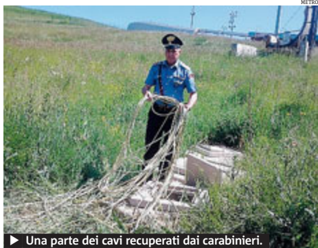
► Una parte dei cavi recuperati dai carabinieri.

CITTÀ Hanno tentato di rubare cavi in rame dalla pista olimpica di bob di Cesana Torinese. I carabinieri, avvertiti da un collaboratore del Parco Olimpico, sono riusciti a bloccare uno dei due ladri, un 42 enne di Torino. I due avevano aperto alcuni tombini in cui passavano i cavi dell'impianto. METRO