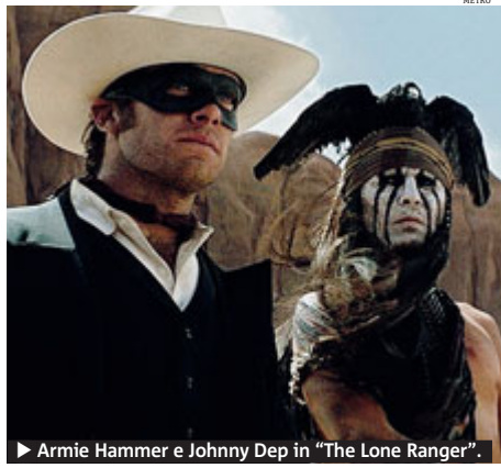
▶ Armie Hammer e Johnny Dep in “The Lone Ranger”.

CINEMA «Non andrei mai con qualcuno che gira con un uccello morto sulla testa e con il viso carico di pittura», dice Johnny Depp parlando di se stesso. O meglio di Tonto, l'indiano che affianca il Cavaliere Solitario, personaggio incastonato nell'immaginario collettivo Usa dopo valanghe di fumetti, serie tv, cartoni, radio, videogame, e che dal 3 luglio torna in “The Lone Ranger” by Gore Verbinski appoggiato dal produttore Jerry Bruckheimer. Cioè lo stesso team della saga dei “Pirati dei Caraibi”. Stavolta, però, protagonista non è il Cavaliere, che ha il fisico di Armie Hammer, ma l'indiano. Cosa significa Mr Depp? Guardavo la serie tv sin da ragazzino e mi sono sempre chiesto perché l'indiano dovesse fare da spalla e non essere l'eroe. Ora ho