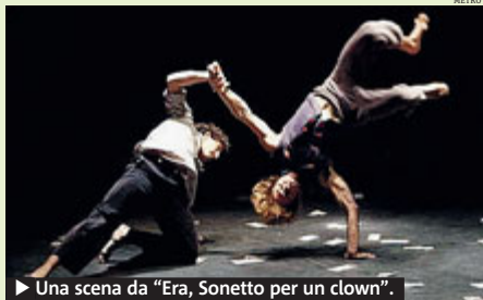
► Una scena da "Era, Sonetto per un clown".

TEATRO L'esplosiva energia del MagdaClan, giovane compagnia italiana di circo contemporaneo, invaderà, da oggi al 30 giugno, il Parco della Certosa Reale di Collegno. Qui infatti presenterà, stasera e domani, alle 21, "Era, Sonetto per un clown", il visionario spettacolo del loro esordio, e, dopodomani e domenica, il freschissimo e recente "Cabaret: circo extra_vagante" che ospiterà, oltre alla formazione originale, anche artisti che hanno solcato tutta Europa con i loro numeri d'acrobazia. Clown, equilibristi e acrobati prenderanno per ma-