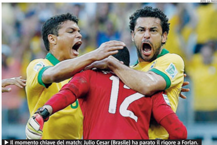
► Il momento chiave del match: Julio Cesar (Brasile) ha parato il rigore a Forlan.

CALCIO Il Brasile è la prima squadra qualificata alla finale della Confederations Cup 2013 (30 giugno, Maracanã di Rio). Ieri sera a Belo Horizonte i padroni di casa hanno superato per 2-1 l'Uruguay. Vantaggio brasiliano al 41' del 1° tempo con Fred che in sforbiata ha trovato l'angolino sinistro della porta difesa da Muslera. Sullo 0-0 la Celeste aveva fallito un rigore con Julio Cesar bravo a neutralizzare il tiro dagli 11 metri di Forlan. Subito dopo il riposo, al 3',