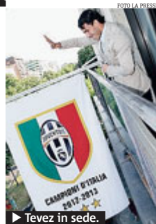
► Tevez in sede.

CALCIO Il delirio per l'Apache. Al secolo, Carlitos Tevez: sbarcato ieri pomeriggio a Malpensa da San Paolo, accolto da alcune centinaia di tifosi bianconeri che hanno visto finalmente coronata una trattativa che vede sbarcare a Torino il famoso top player d'attacco. Nove milioni più tre (bonus, pressoché scontati) al Manchester City, triennale da 5,5 milioni al giocatore. Che ha già vinto una Champions League con lo United e che proverà a fare altrettanto con la Juve «Ci voleva tutto questo entusiasmo», ha detto Marotta. Il quale, dopo avere acciappato Llorente a para-