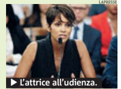
▶ L'attrice all'udienza. L'ESPRESSO

GOSSIP Diritto di cronaca contro tutela della privacy. La guerra è vecchia. Ma ora negli Usa si è aperta una battaglia legale per tutelare i figli dei vip. Ieri, seguita da un codazzo di fotografi, Halle Berry si è presentata in Campidoglio a Sacramento, in California, per testimoniare a favore del disegno di legge. «Mia figlia non vuole andare a scuola perché sa che ci sono degli uomini che la stanno guardando», ha detto l'attrice spesso coinvolta in scontri con i paparazzi, «saltano fuori dai cespugli, da dietro le auto e