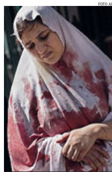
► Donna ferita ad Aleppo.

tinuano a slittare i tempi della Conferenza di pace a Ginevra. Dei centomila morti, ben 36.661 erano civili, 25.407 militari lealisti e 18.072 «ribelli». Nella cifra sono compresi 17.311 «shabbiha», i miliziani irregolari filo-governativi, 169 combattenti di Hezbollah e 2.571 vittime non identificate. ● METRO