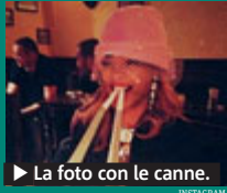
▶ La foto con le canne.

MUSICA «Non ho mai preteso di essere un modello». Ha risposto così Rihanna, via Instagram, alle polemiche per le sue foto in cui fuma marijuana ad Amsterdam. METRO