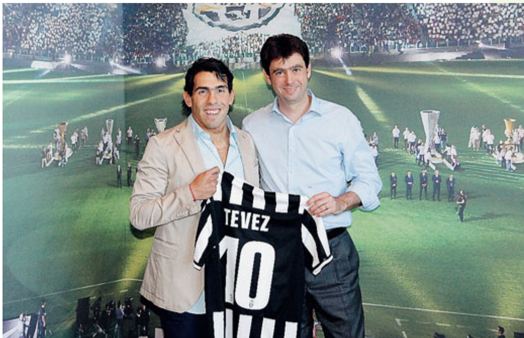
► L'argentino, ex del Manchester City, posa con Andrea Agnelli. Oggi alle 11.30 la presentazione allo Juventus Stadium.

Calcio. L'Apache: "La Juve è il club che mi ha voluto di più"