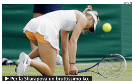
► Per la Sharapova un bruttissimo ko.

BASKET La nazionale di basket femminile è stata eliminata dal campionato europeo in Francia battuta dalla Serbia per 85-79 ad Orchies. • METRO