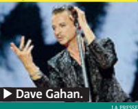
▶ Dave Gahan.