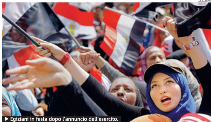
► Egiziani in festa dopo l'annuncio dell'esercito.

Il primo presidente dopo la rivoluzione è raramente stabile. Morsi poi ha fatto promesse che non ha mantenuto, tra cui un elenco di problemi da ri-