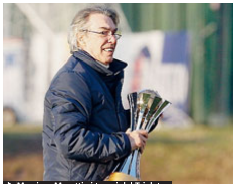
► Massimo Moratti ai tempi del Triplete.

mercato, giornali svizzeri danno certi il passaggio di Dragovic dal Basilea all'Inter. Si parla di visite mediche, di contratto quadriennale. Il difensore, intanto, dice di non vedere l'ora di indossare la maglia nerazzurra. Maglia che forse Ranocchia si toglierà, per indossare quella dello United o del Napoli (scambio con Zuniga). Quasi fatta infine per Belfodil. Cassano al Parma è questione di un paio di giorni. Via Schelotto che non piace a Mazzarri. F.N.