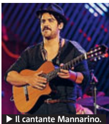
► Il cantante Mannarino.

Il 22 luglio live gratuito di Alessandro Mannarino, mentre il 26 saliranno sul palco le band emergenti. Il Portico dell'Elefante e la Sala Viscontea accoglieranno invece la terza edizione del Video Sound Art, festival multimediale all'insegna dell'innova-