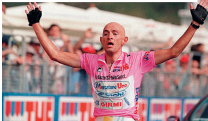
► Marco Pantani vinse Giro d'Italia e Tour de France (il primo dopo Gimondi).

Il n°1 Uci Pat McQuaid "Potremmo cancellare Pantani dal tour '98"