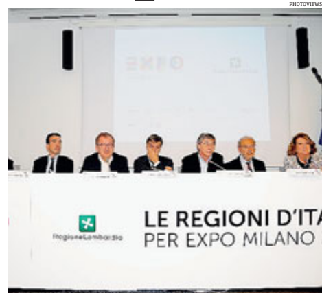
► Maroni e i ministri ieri a Milano per discutere di Expo.

Il commissario Sala ha invece messo l'accento sui nuovi accordi sul lavoro flessibile per l'impiego di operai e personale per Expo (accordi esclusi la settimana scorsa dal decreto sul lavoro). Accordi, ha sostenuto Sala, che devono arrivare entro settembre: «Quello della flessibilità è un punto importante», visto che sia nei sei mesi dell'esposizione del