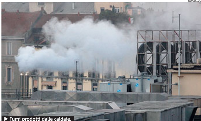
► Fumi prodotti dalle caldaie.

ABITARE Efficientamento energetico? Gli interventi più frequenti, in condominio, sono, nell'ordine, l'adozione delle caldaie a condensazione (che totalizzano ben il 56,3% degli interventi), le varie soluzioni possibili di termoregolazione e contabilizzazione del calore (43,9%) e, ultimi, i serramenti coibentati. Il dato emerge da un sondaggio nazionale compiuto tra gli amministratori di condominio dell'Anaci (associazione di amministratori condominiali e immobiliari) per la fiera Proenergy+ barese. Ma questa rilevazione fanno riscontro di dati di segno molto diverso, principalmente due: sono gli amministratori, nella maggioranza dei casi, a proporre le miglie, la cui realizzazione (ed è il secondo dato) fa impennare il numero delle controversie tra i condomini, principalmente per discordie derivanti da fattori economici, come i costi