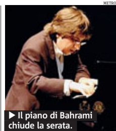
► Il piano di Bahrami chiude la serata.

spettacolo "Scena madre", coreografato anche da Michele Abbondanza, sarà la storia vera della relazione tra una madre e una figlia (Info: 02 66200646). ● A.G.