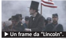
► Un frame da "Lincoln".

CINEMA Le arene estive del cinema aprono ai grandi titoli. E così per "AriaAnteo" stasera si potrà scegliere tra il Conservatorio dove sarà in programma, alle 22, "Lincoln" di Steven Spielberg, preceduto, alle 21, dal concerto "From America", "Viaggio da sola" di Maria Sole Tognazzi, alle 21.30, a Pa-