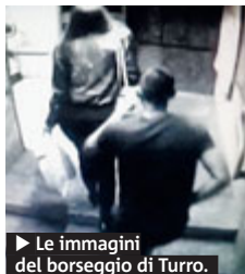
► Le immagini del borseggio di Turro.

SICUREZZA Gli ultimi due li hanno arrestati venerdì alla fermata di Turro. Sono due discepoli della "scuola rumena", i cui dettami recitano: uno davanti a infilare la mano nella borsa, l'altro dietro a coprire l'operazione col corpo. Il maggiorenne è finito a San Vittore, per quel borseggio, ma anche per uno eseguito il 22 febbraio e un altro il 10 marzo entrambi alla fermata Rovareto. Il minore è stato denunciato a piede libero. A far scattare le manette due membri del nucleo Prevenzione Reati Predatori della Polizia Locale, un esperimento attivato circa tre mesi fa, che conta un ufficiale e 4 agenti. A volerlo, il comandante