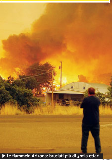
► Le fiamme in Arizona: bruciati più di 3mila ettari.