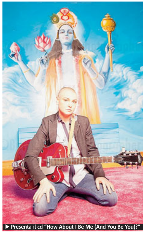
► Presenta il cd "How About I Be Me (And You Be You)?"

► L'artista irlandese live stasera ► Al Carroponate arriva il combo soul firmato da Fat Freddy's Drop