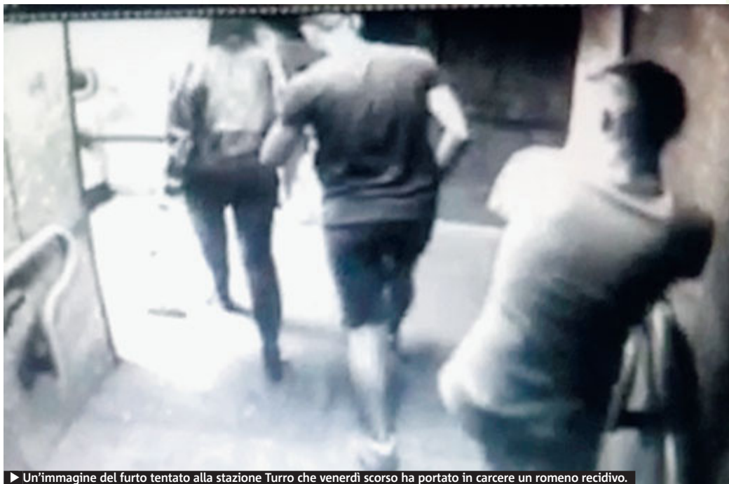
► Un'immagine del furto tentato alla stazione Turro che venerdì scorso ha portato in carcere un romeno recidivo.

Metrò a Milano. Primi arresti con la nuova task force dei vigili