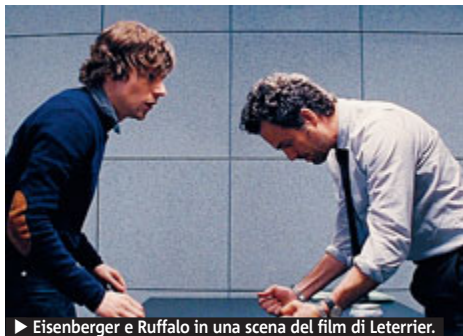
▶ Eisenberger e Ruffalo in una scena del film di Leterrier.