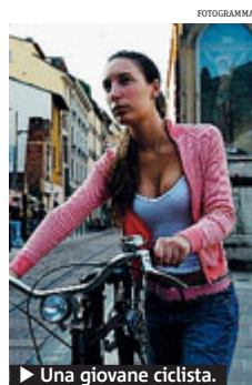
► Una giovane ciclista.