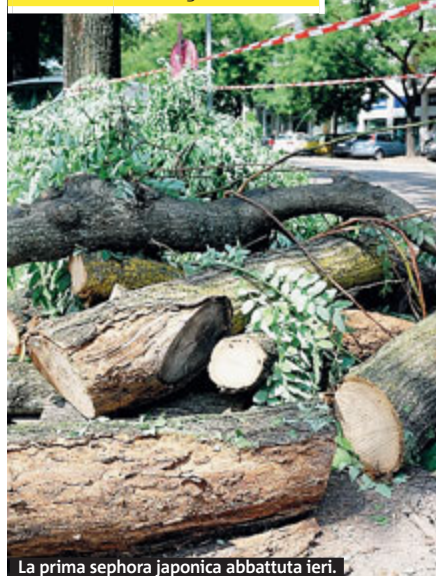
La prima sephora japonica abbattuta ieri.