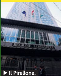
► Il Pirellone.