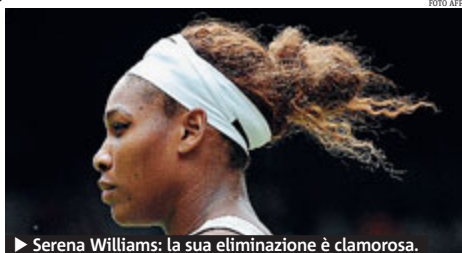
► Serena Williams: la sua eliminazione è clamorosa.

TENNIS L'erba di Wimbledon miete un'altra vittima eccellente: la numero 1 al mondo Serena Williams. L'impresa porta la firma della tedesca Sabine Lisicki, che si è imposta per 6-2 1-6 6-4. Capito azzurro: Flavia Pennetta è stata eliminata da Kirsten Flipkens, numero 20 del tabellone per 7-6 (7-2), 6-3. Non meglio Roberta Vinci: anche lei saluta Londra. La tarantina si è arresa alla cinese Na Li (numero 6 della classifica Wta) per 6-2 6-0, in 55 minuti.