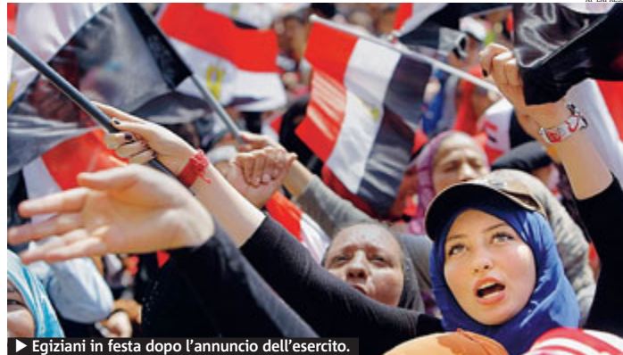
► Egiziani in festa dopo l'annuncio dell'esercito.

Il primo presidente dopo la rivoluzione è raramente stabile. Morsi poi ha fatto promesse che non ha mantenuto, tra cui un elenco di problemi da ri-