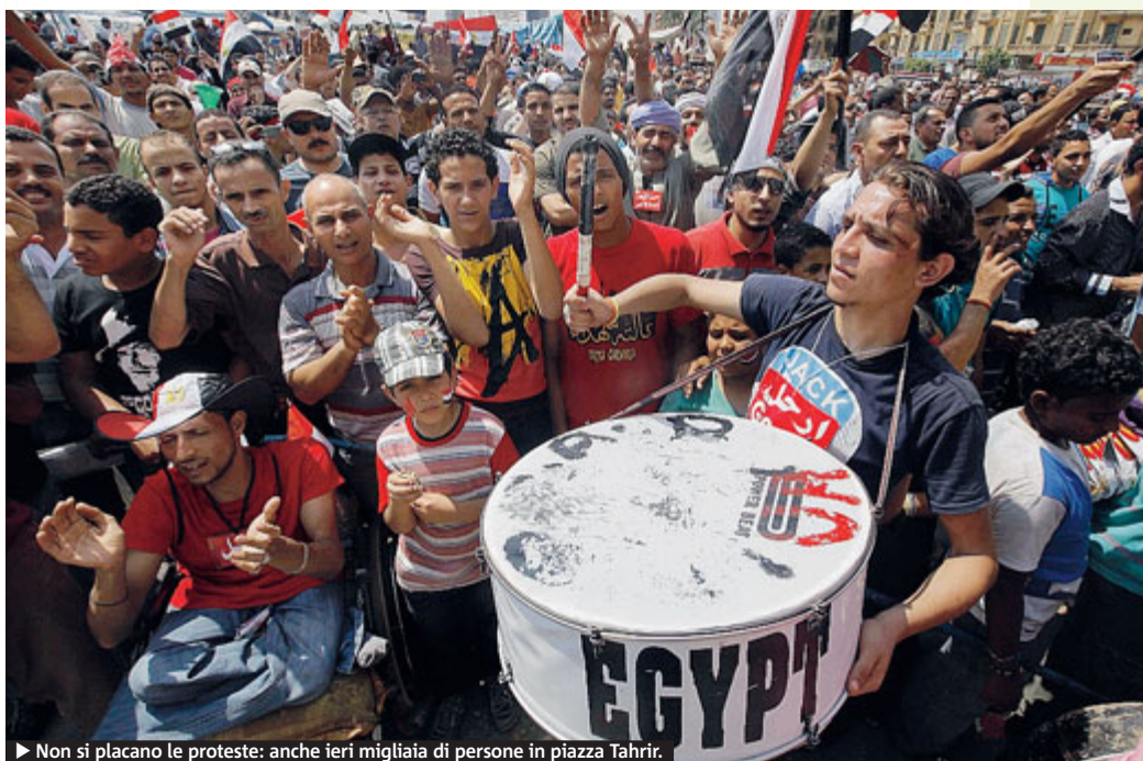
► Non si placano le proteste: anche ieri migliaia di persone in piazza Tahrir.

Egitto. Si dimettono cinque ministri. Una ventina i morti