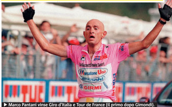
Marco Pantani vinse Giro d'Italia e Tour de France (il primo dopo Gimondi).

Il n°1 Uci Pat McQuaid "Potremmo cancellare Pantani dal tour '98"