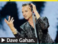
▶ Dave Gahan.