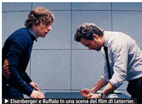
▶ Eisenberg e Ruffalo in una scena del film di Leterrier.