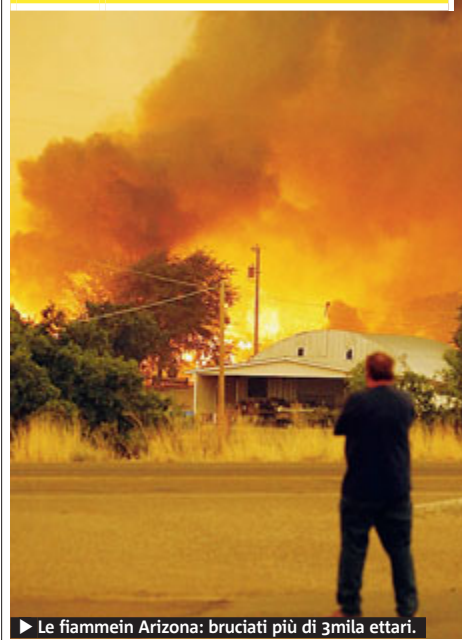
► Le fiamme in Arizona: bruciati più di 3mila ettari.