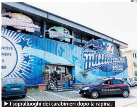
► I sopralluoghi dei carabinieri dopo la rapina.

MONCALIERI Hanno lasciato in auto per 12 ore il loro cane, che è stato soppresso per i danni irreversibili riportati. È successo domenica a Moncalieri. L'animale, un pastore corso, è stato notato alle 13.30 da una passante. I padroni, una coppia di 35 e 34 anni, sono stati denunciati per maltrattamento di animale. ● METRO