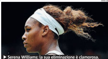
Serena Williams: la sua eliminazione è clamorosa.

TENNIS L'erba di Wimbledon miete un'altra vittima eccellente: la numero 1 al mondo Serena Williams. L'impresa porta la firma della tedesca Sabine Lisicki, che si è imposta per 6-2 1-6 6-4. Capitolo azzurro: Flavia Pennetta è stata eliminata da Kirsten Flipkens, numero 20 del tabellone per 7-6 (7-2), 6-3. Non meglio Roberta Vinci: anche lei saluta Londra. La tarantina si è arresa alla cinese Na Li (numero 6 della classifica Wta) per 6-2 6-0, in 55 minuti.