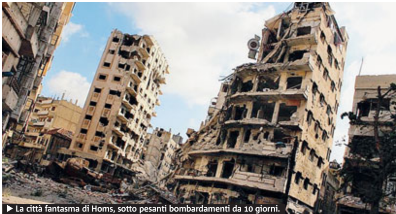
► La città fantasma di Homs, sotto pesanti bombardamenti da 10 giorni.