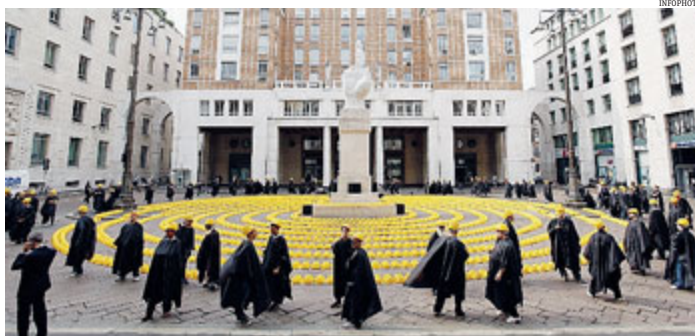
► Presentate 100 vessazioni che riguardano soprattutto l'attività legislativa farraginosa

MILANO Ritornano i caschetti gialli dell'edilizia in Piazza Affari, con una nuova giornata della collera. Lo scorso 13 febbraio la filiera delle costruzioni aveva chiesto interventi urgenti. Ma da allora si sono persi altri 690mila posti di lavoro. E ieri sono state presentate 100 vessazioni che rendono problematico lavorare. Tra cui: l'attività legislativa eccessiva e contrastante; la stratificazione nel tempo di procedure determinate dai singoli enti; la proliferazione dei soggetti che partecipano alle procedure edilizie e urbanistiche. ● AGI