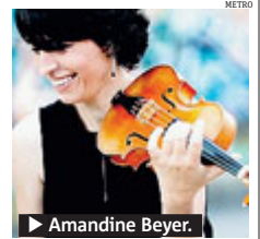
► Amandine Beyer.

MUSICA Al via, dal 16 luglio al 29 agosto, la settima edizione di "Milano Arte Musica", l'iniziativa di musica antica che quest'anno celebra i 20 anni dell'Associazione, offrendo all'estate milanese il maggiore ciclo italiano di questo genere con 19 date, 28 programmi musicali e 37 spettacoli in 12 diverse sedi. L'apertura della rassegna avverrà con un doppio appuntamento nella splendida Basilica di Santa Maria della Passione, il 16 luglio e 17 luglio, affidato alla prestigiosa Accademia Bizantina diretta da Ottavio Dan-