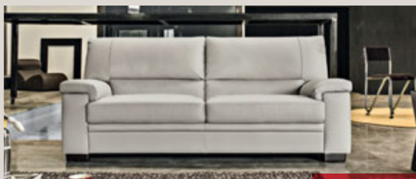
BELVEDERE divano 3 posti in VERA PELLE Genisia Grigio Perla - L201 P97 H89 cm