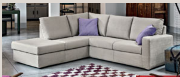
MAYS divano angolare in tessuto Etienne Grigio Perla - L240 P228 H88 cm