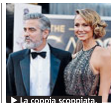
La coppia scoppiata.