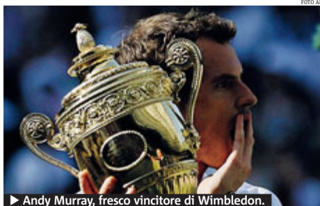
► Andy Murray, fresco vincitore di Wimbledon.

TENNIS Cambia il ranking Atp dopo che il sipario calato su Wimbledon: Andreas Seppi sale dal numero 28 al 23 del ranking, che vede invece lo svizzero Roger Federer scendere dal numero 3 al 5, suo peggior piazzamento da 10 anni. In vetta resta Djokovic, sconfitto in finale da Andy Murray che consolida il secondo posto. David Ferrer e Rafa Nadal salgono al numero 3 e 4. Tra gli azzurri Fabio Fognini va dal 30esimo al 31esimo posto. Donne: Sara Errani scende dal