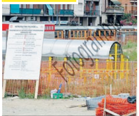
► Il cantiere di MM che chiuderà a marzo 2014.