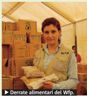
► Derrate alimentari del Wfp.