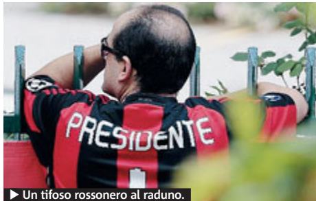
► Un tifoso rossoneri al raduno.

no sempre gli stessi, cioè andare in Champions e quindi piazzarsi nei primi tre posti, cercare di andare più avanti possibile nelle massima competizione europea e in Coppa Italia che non vinciamo da 10 anni». E mentre Robinho insiste per trasferirsi al Santos, per Allegri il jolly sarà il Faraone: «Quando El Shaarawi rientrerà, il 24 luglio, sarà più sereno e più carico che mai». Insomma Allegri, si aspetta da lui un avvio di campionato super. «La flessione