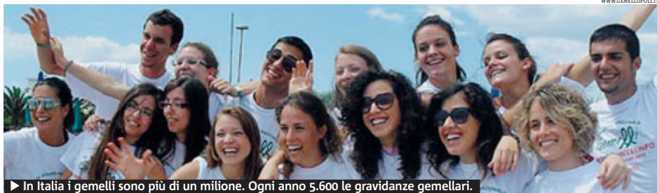
► In Italia i gemelli sono più di un milione. Ogni anno 5.600 le gravidanze gemellari.