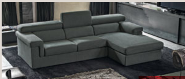
SALAK divano con penisola in tessuto Pheonix Grigio Fumo - L260 P176 H92 cm