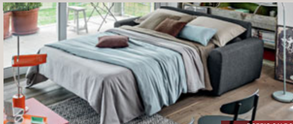
CAMBRIA divano LETTO 3 posti in tessuto Pheonix Antracite - L207 P91/226 H89 cm