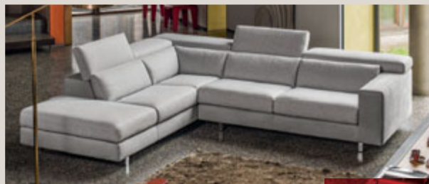
THYMUS divano angolare in tessuto Etienne Grigio Perla e Apios Nuvola - L303 P248 H96 cm