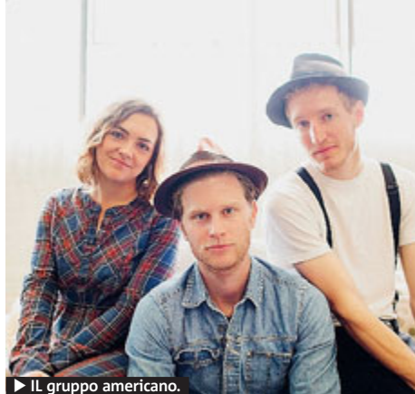
► IL gruppo americano.

Il cast è di tutto rispetto: grande attesa stasera per il folk-rock degli americani Lumineers, preceduti da Matinée, Willy Mason e Daughter. Domani i protagonisti saranno i Tame Impala, ma suoneranno anche Local Natives, Orange, Hot Gossip, Melody's Echo Chamber e Deap Vally. Ore 20, euro 23 più pre-vendita, abbonamento a 40 euro. Tutt'altro genere all'Ippodromo del Galoppo, dove per "Alfa Romeo