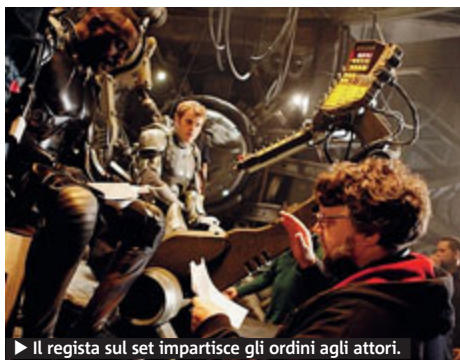
Il regista sul set impartisce gli ordini agli attori.

CINEMA Voleva un film che «sembrasse drammatico come un'opera lirica», dal quale schizzasse «la poesia delle macchine». Voleva un film «che catturasse un pubblico a cavallo di generazioni, l'immaginario di chi è nato tra i Settanta e i Novanta». Voleva tutto questo il mitico regista-produttore-scrittore-disegnatore messicano Guillermo Del Toro. Ne è nato «Pacific Rim», da giovedì nei cinema, con robottoni contro giganteschi mostri e con battaglie che cominciano in mare e finiscono nello spazio. Del Toro, cercava il fantasy? Non volevo la fantascienza, ma il fantasy e non volevo parlare di un futuro remoto, ma di una guerra di resistenza per la salvezza, fissare l'ultima umanità rimasta a un passo dall'apocalisse.