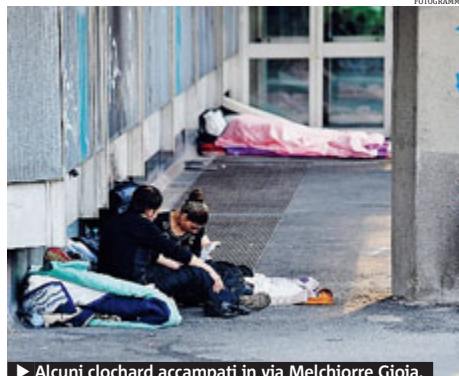
► Alcuni clochard accampati in via Melchiorre Gioia.

Molti anziani si sono lamentati per il pasticcio che ha portato alla sospensione del