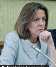
▶ Beatrice Lorenzin. L'ESPRESSO