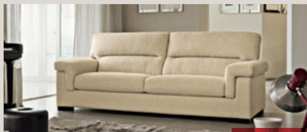
ROLLINIA divano 3 posti in tessuto Etienne Luna L210 P100 H92 cm