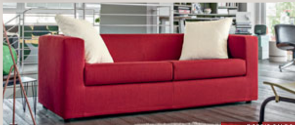
ALNO divano 3 posti in tessuto Pheonix Rosso L195 P87 H66 cm