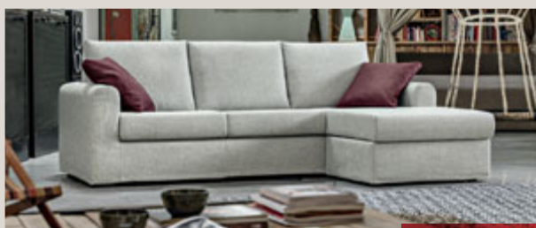
MELITTIS divano con penisola in tessuto Apios Nuvola L240 P155 H88 cm