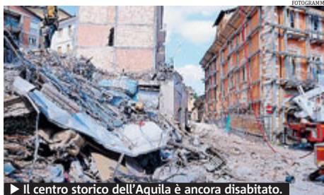
► Il centro storico dell'Aquila è ancora disabitato.

l'ex presidente della provincia oggi senatrice Pd: i soldi sono drammaticamente finiti con il 2013-14