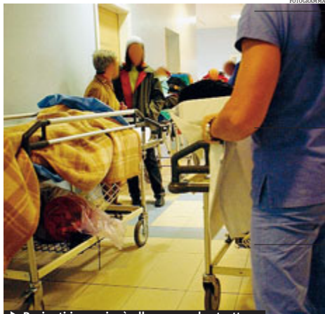
► Pazienti in corsia: è allarme per le strutture insufficienti e obsolete dei presidi ospedalieri italiani.