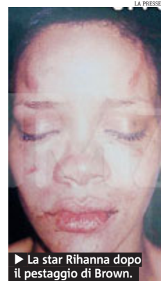
► La star Rihanna dopo il pestaggio di Brown.

condannato a 5 anni di libertà vigilata, a uno di partecipazione a un programma di prevenzione delle violenze domestiche e a 180 giorni di servizi sociali. In caso di nuovi reati è previsto che sconti 4 anni. Brown tornerà in aula perché a maggio con la sua Range Rover tamponò una Mercedes e non si fermò a fornire né soccorso, né generalità. ●METRO