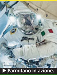
▶ Parmitano in azione.