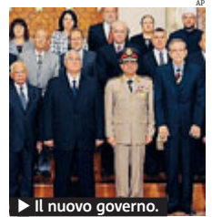
► Il nuovo governo.

EGITTO. Tornano le violenze in Egitto, dove lunedì notte ci sono stati 7 morti e 261 feriti negli scontri tra sostenitori di Morsi e le forze di sicurezza. Le violenze non rappresentano un buon viatico per il nuovo governo che ha giurato ieri presieduto da Hazem el Beblawy. Il nuovo governo conta 33 ministeri, la gran parte tecnocrati e di ispirazione li-