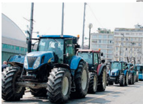
► Il corteo dei trattori da Carmagnola a Torino.