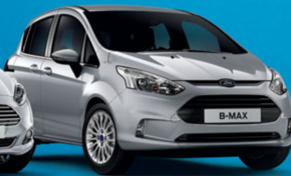
FORD B-MAX 1.0 EcoBoost 100CV Clima e Radio CD € 13.950