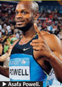
► Asafa Powell.