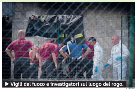
▶ Vigili del fuoco e investigatori sul luogo del rogo.