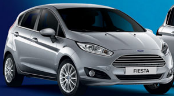
FORD Fiesta 1.0 80CV Clima e Radio CD € 9.950