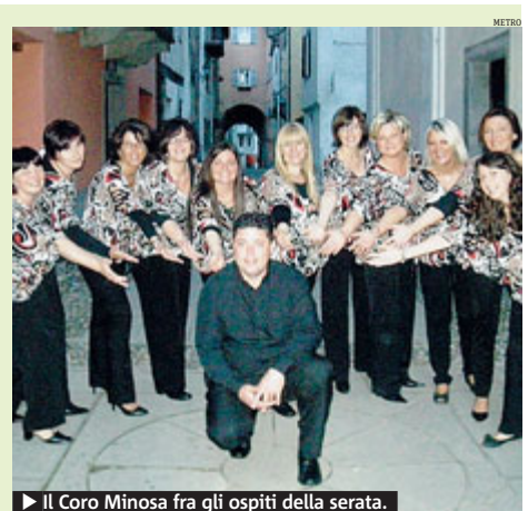
► Il Coro Minosa fra gli ospiti della serata.

CLASSICA Una serata benefica per raccogliere fondi per Telethon contro le malattie rare. Sarà quella di oggi, alle 21, in piazza del Municipio a Tavagnasco per il "Concerto in Piazza 2013". Un appuntamento all'insegna della musica che vedrà la partecipazione dell'Associazione Ars Nova, del Coro Mimosa di Tavagnasco e del Coro Mozart di Ivrea. Si tratta di tre prestigiose compagnie musicali che fanno dell'universo delle sette note uno spazio di grande professionalità e dal forte impatto sociale. Il coro femminile Mimosa infatti, nato nel '94, ha