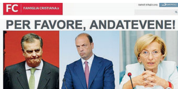
▶ L'home page di ieri del sito di Famiglia Cristiana contro Calderoli, Alfano e Bonino.

L'affondo di Famiglia Cristiana contro i ministri del governo Letta