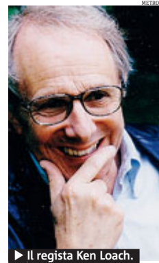
► Il regista Ken Loach.