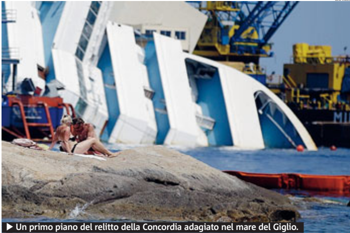
► Un primo piano del relitto della Concordia adagiato nel mare del Giglio.