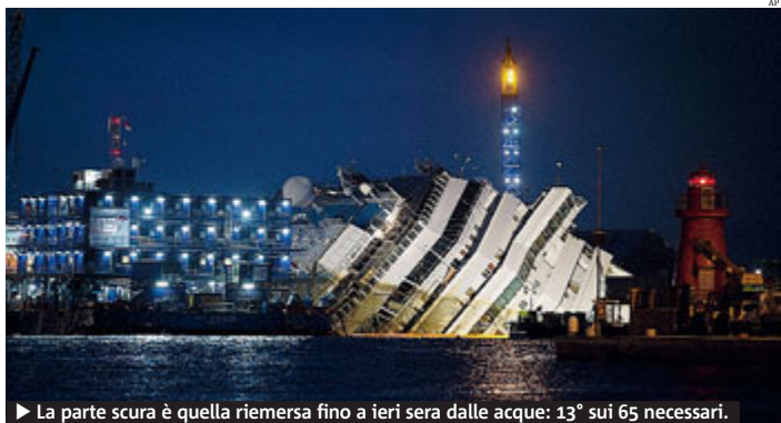
► La parte scura è quella riemersa fino a ieri sera dalle acque: 13° sui 65 necessari.