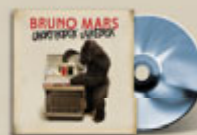
Unorthodox Jukebox CD e DIGITAL DOWNLOAD www.warnermusic.it