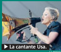
► La cantante Usa.

MUSICA È Pink la Donna dell'anno per "Billboard". Ultima ciliegina su un anno d'oro per la cantante, che con "The Truth About Love" ha venduto 1,7 milioni di copie. METRO