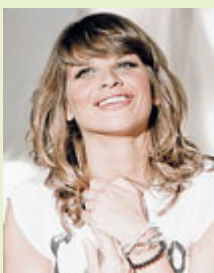
► Alessandra Amoroso.

INCONTRI "Un'altra sorpresa per la mia big family: vi aspetto sabato 21 settembre, alle 13,30, al Globe Theatre di Villa Borghese per festeggiare insieme". Con questa frase, postata sulle pagine ufficiali dei suoi social network, Alessandra Amoroso ha annunciato l'incontro/concerto riservato agli iscritti al suo fan club che si terrà al Globe Theatre, tre giorni prima dell'uscita del suo