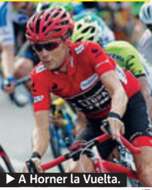
► A Horner la Vuelta.