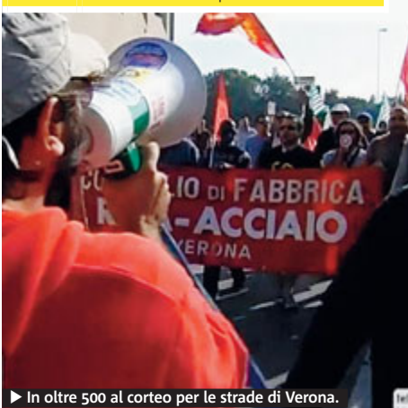
► In oltre 500 al corteo per le strade di Verona.