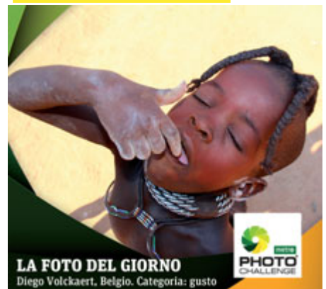
LA FOTO DEL GIORNO Diego Volckaert, Belgio. Categoria: gusto

Ogni giorno il concorso premierà la “foto del giorno” che verrà pubblicata su www.metrophotochallenge.com e (previa liberatoria) anche sul nostro giornale.