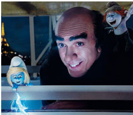
► Hank Azaria nei panni di Gargamella.

CINEMA L'idea è chiara: non importa da dove provieni, quello che conta è ciò che scegli di essere. Vale per tutti, più che mai per i Puffi. Anzi per i finti Puffi creati da Gargamella alla ricerca disperata dell'essenza magica degli omini blu, prima di scoprire che solo un Puffo doc può dargli ciò che vuole. È la sintesi de "I puffi 2-3D", che tornano da giovedì sui nostri schermi, live-action con i nostri Puffi in giro per il mondo, (partenza e arrivo Parigi). La regia è di Raja Gosnell che racconta: «La cosa più elettrizzante per me, come regista, è stato ambientare questa grande avventura in tutta la città di Parigi. Abbiamo girato in luoghi che, per quanto ne so, nessuno ha mai usato per girare un film. Siamo stati sul palcoscenico del teatro dell'Opera, abbiamo