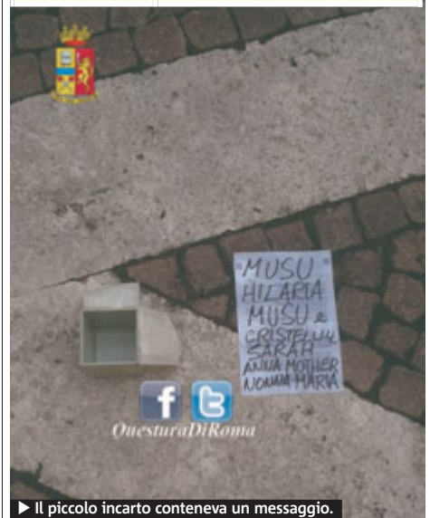
Il piccolo incarto conteneva un messaggio.

Via Sallustiana. Digos indaga su un pacchetto