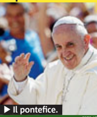
► Il pontefice.