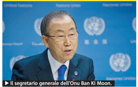
► Il segretario generale dell'Onu Ban Ki Moon.