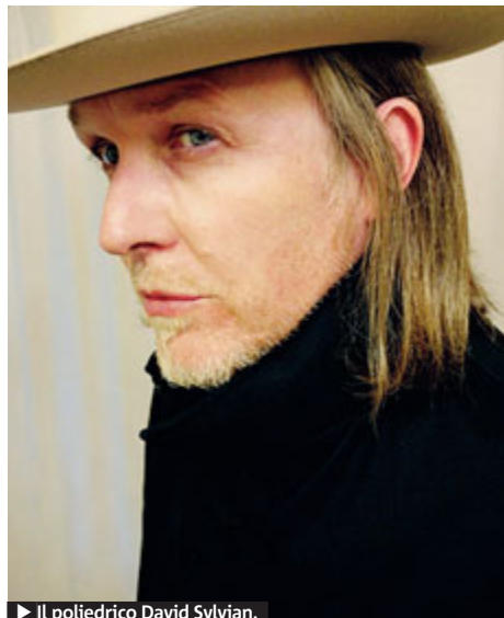
► Il poliedrico David Sylvian.

Con questo progetto hanno trovato un punto di fusione tra le ricerche melodiche di Sylvian - già leader dei leggendari Ja-