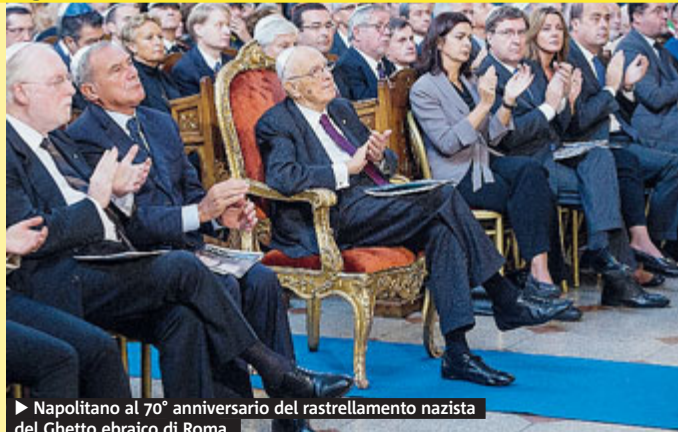
► Napolitano al 70° anniversario del rastrellamento nazista del Ghetto ebraico di Roma.