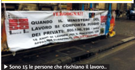
► Sono 15 le persone che rischiano il lavoro.

Via Veneto. Call center del ministero a rischio