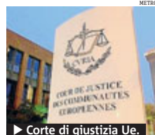
► Corte di giustizia Ue.

UE Il Tribunale Ue ha accolto il reclamo italiano per la bocciatura di un concorso per la selezione di funzionari delle istituzioni europee sulla base del fatto che si richiedeva ai candidati di conoscere «in modo soddisfacente» inglese, francese o tedesco come seconda lingua. Il Tribunale ha stabilito che il bando, relativo al 2010 e ora annullato, vio-