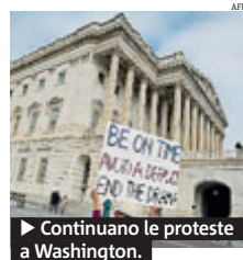
► Continuano le proteste a Washington.

USA I leader Democratici e Repubblicani del Senato Usa hanno raggiunto un'intesa per porre fine all'impasse fiscale, a 36 ore dal default, quando sarà stato raggiunto il tetto del debito di 16.700 miliardi. Il testo sarà approvato prima alla Camera (dove la maggioranza repubblicana è condizionata dall'ala intransigente del Tea Party, contraria ad un'in-