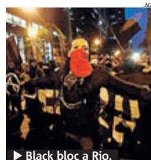
► Black bloc a Rio.

BRASILE Sono 264 i fermati per le violenze scoppiate a Rio e San Paolo dopo le manifestazioni per la Giornata del Professore. Migliaia di studenti, insegnanti e dipendenti pubblici hanno sfilato nelle due città, dove decine di Black Bloc si sono uniti ai cortei e hanno saccheggiato negozi e assaltato banche. A Rio, dove gli insegnanti sono in sciopero