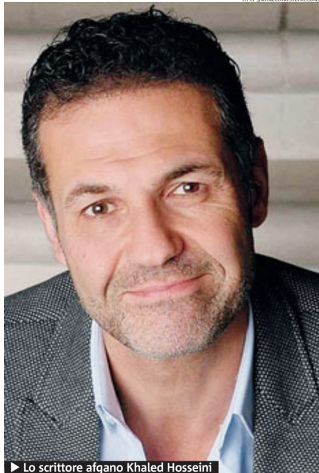
Lo scrittore afgano Khaled Hosseini

È tutto. C'è una poesia del poeta Rumi che dice: c'è un flauto di bambù strappato dalla sua terra perché suonò, ma il suono è quasi un pianto. Rumi