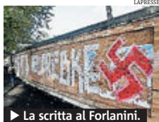
La scritta al Forlanini.