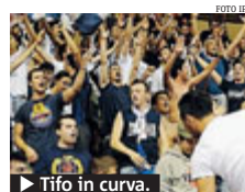
► Tifo in curva.

In quel caso la seconda sanzione si aggungerà alla prima. Le sanzioni vanno dalla chiusura del settore fino a quella dello stadio, che resta per i casi più gravi. Una ulteriore significativa modifica è quella che prevede il concetto di percezione della portata del fenomeno discriminatorio. Se i protagonisti del