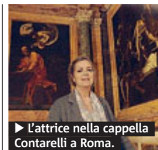
▶ L'attrice nella cappella Contarelli a Roma.

ritoccato. Kate Winslet si è invece da sempre opposta all'uso di Photoshop, sentendosi moralmente responsabile nel dare un'immagine reale di donna. ● M.N.