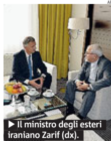
► Il ministro degli esteri iraniano Zarif (dx).

le sanzioni internazionali, che stanno strangolando sempre di più l'economia della Repubblica Islamica. Secondo indiscrezioni il piano prevede il riconoscimento al diritto dell'Iran di arricchire l'uranio e l'attuazione di misure volte a garantire la natura pacifica del programma atomico di Teheran. In attesa del prossimo round di colloqui (che si dovrebbe tenere a Ginevra entro novembre) i