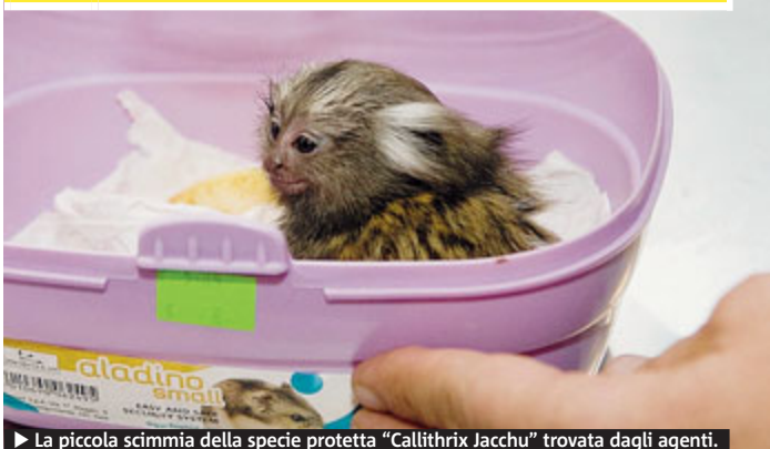
La piccola scimmia della specie protetta "Callithrix Jacchu" trovata dagli agenti.

Labaro. Salvati 15 cuccioli di cane e una piccola scimmia di un anno