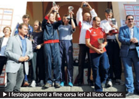
► I festeggiamenti a fine corsa ieri al liceo Cavour.