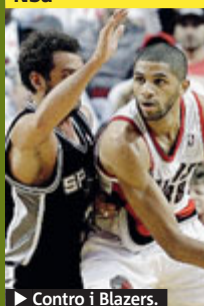
▶ Contro i Blazers.