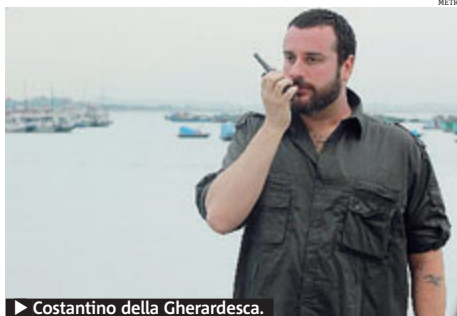
► Costantino della Gherardesca.

Sicuramente da conduttore si dorme molto meno dovendo precedere l'arrivo delle coppie: mi sono svegliato sempre alle 5 del mattino andando a letto mai prima dell'1,30. Da concorrente avevo fatto due mesi di allenamento per avere fiato. Da conduttore mi sono sottoposto ad un allenamento psicologico non indifferente che pensavo di non riuscire a superare. La cosa più atro-