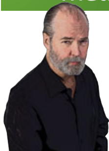
DOUGLAS COUPLAND VANCOUVER, BRITISH COLUMBIA 3 NOVEMBRE 2013