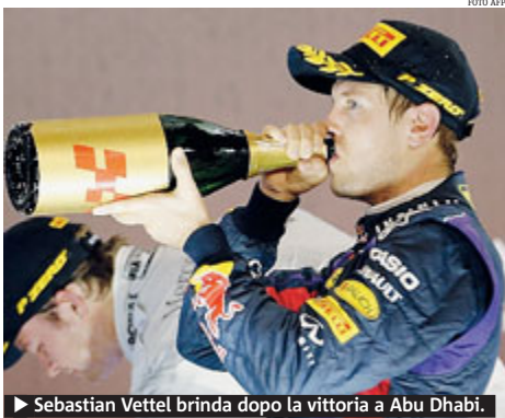
► Sebastian Vettel brinda dopo la vittoria a Abu Dhabi.

F1 «Vettel è di un altro pianeta. Io sto cercando di fare del mio meglio ma Seb è stato più bravo». Così Mark Webber ha reso onore al compagno di squadra Sebastian Vettel, vincitore del Gp d'Abu Dhabi proprio davanti a lui (settima di fila, eguagliato il record di Michael Schumacher del 2004). «La partenza non è stata ottima ha aggiunto il pilota australiano, che si è ritrova-