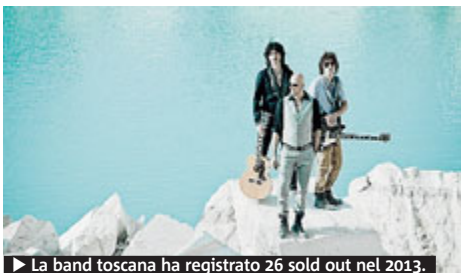
► La band toscana ha registrato 26 sold out nel 2013.

CONCERTI Tutto esaurito da giorni il Sistina per il concerto di stasera (h 21) dei Negrita. La band toscana, storica realtà del rock del nostro paese, arriva nella Capitale con il suo "Unplugged 2013", tour che è ripreso in autunno dopo i 26 sold out registrati nei primi mesi del 2013. Pau e compagni, sulle scene da circa 20 anni, saranno sul palco del teatro romano con il loro show acustico, un concerto di grande impatto, nel quale troveranno spazio tutti i classici del loro repertorio. Frutto dell'esperienza unplugged è "Deja vu", titolo del nuovo album, rilettura in chiave acustica di brani noti e meno noti e della band. Dav-