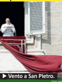
Vento a San Pietro.