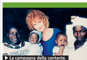
► La campagna della cantante.

► Nuovi allarmanti dati del dicastero del Lavoro ► “I giovani sono la fascia di età più colpita dalla crisi” {News}