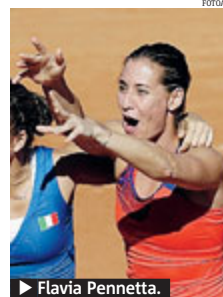
► Flavia Pennetta.

TENNIS «Siamo una grandissima squadra, tutte e cinque ci troviamo benissimo assieme e si vede anche sul campo». Sara Errani, numero uno azzurra, commenta così a caldo la vittoria della quarta Fed Cup della storia sulla Russia, una vittoria arrivata grazie ai due punti firmati dalla romagnola nei successi su Khromacheva e Kleybanova. Ma la finale di Fed Cup per l'Italia, sulla terra rossa del Tennis Club Cagliari, finisce in gloria con il punteggio di