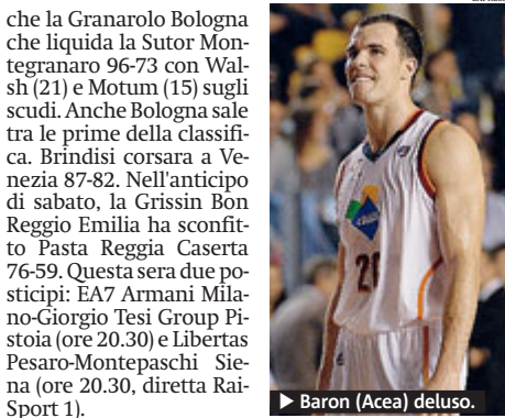
▶ Baron (Accea) deluso.

BASKET Cade in casa dopo un overtime, l'Accea Roma per mano di Cantù 82-80. Ai capitolini non sono bastati i 19 punti di Hosley. La Cimberio Varese supera agevolmente la Sidigas Avellino 85-68, con Clark (20 punti) e Polonara (15) su tutti. Varese sale tra le prime in classifica. Bel successo della Vanoli Cremona che batte il Banco Sardegna Sassari 86-74 con una buona prova di Rich (25). Per Sassari non sono bastati i 22 punti di Abdul Thomas. Bene anche la Granarolo Bologna che liquida la Sutor Montegrano 96-73 con Walsh (21) e Motum (15) sugli scudi. Anche Bologna sale tra le prime della classifica. Brindisi corsara a Venezia 87-82. Nell'anticipo di sabato, la Grissin Bon Reggio Emilia ha sconfitto Pasta Reggia Caserta 76-59. Questa sera due posticipi: EA7 Armani Milano-Giorgio Tesi Group Pistoia (ore 20.30) e Libertas Pesaro-Montepaschi Siena (ore 20.30, diretta Rai Sport 1).