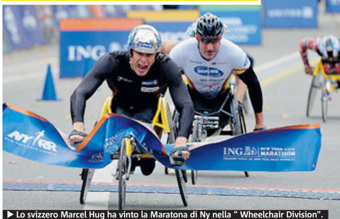
▶ Lo svizzero Marcel Hug ha vinto la Maratona di Ny nella "Wheelchair Division".

Maratona Il ritorno della corsa dopo lo stop del 2012