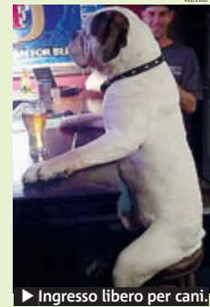
► Ingresso libero per cani.

aperte, dunque, agli amici a quattro zampe sia in ristoranti che in bar, nei negozi e perfino nelle pasticcerie e gelaterie. Il tutto purché i pelosi siano ovviamente accompagnati dal loro “amico bipede”, che dovrà tenerli al guinzaglio e dovrà essere pronto a far indossare loro la museruola. Inutile ribadire che i proprietari dei cani saranno responsabili della condotta dei loro amici.