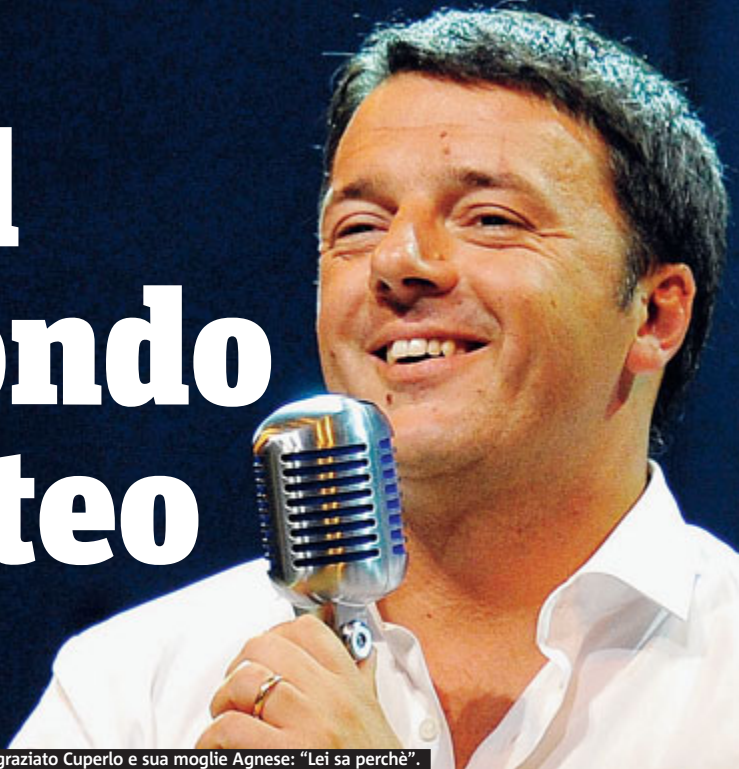
► Matteo Renzi per prima cosa ha ringraziato Cuperlo e sua moglie Agnese: "Lei sa perchè".

► Renzi ha stravinto le primarie e diventa segretario ► Affluenza vicino ai tre milioni di votanti ► Un successo che lancia il sindaco di Firenze alla guida del partito più forte dentro al governo delle larghe intese ► Deluso Cuperlo {News}