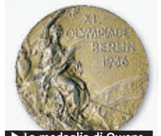
► La medaglia di Owens.