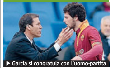
► Garcia si congratula con l'uomo-partita

► Almeno 200mila persone, ma secondo alcune fonti anche 500mila, hanno manifestato contro la politica antieuropeista di Yanukovych {News}