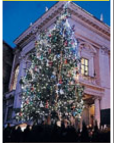
► Un abetepù luminoso.