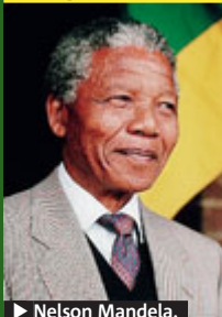
▶ Nelson Mandela.