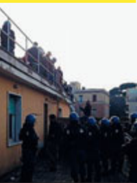
► La polizia interviene.