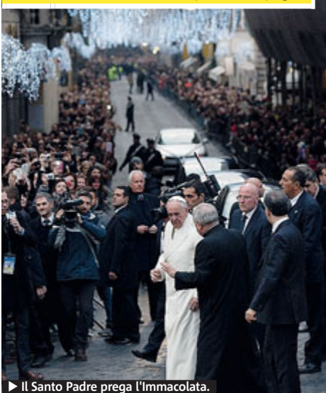
▶ Il Santo Padre prega l'Immacolata.

Roma. Accolto dalla folla in piazza di Spagna