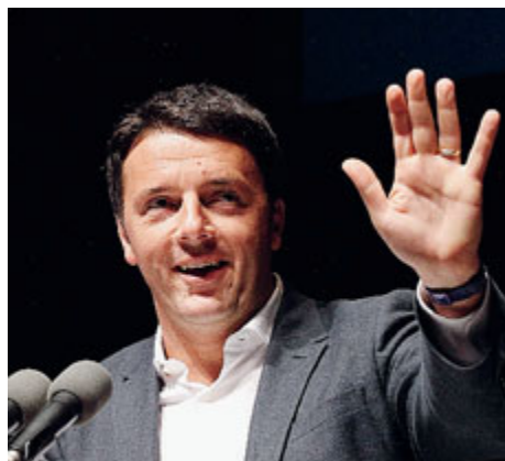
► «Non c'è più alibi per il cambiamento, tocca alla nuova generazione guidare la macchina», ha detto Renzi.

MILANO «La prima guerriglia parlamentare che faremo sarà contro ogni ipotesi di indulto e amnistia»: è il primo impegno politico della Lega secondo Matteo Salvini che al congresso di domenica a Torino si presenterà con la solida in-