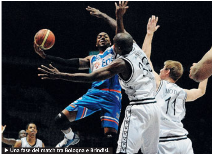
► Una fase del match tra Bologna e Brindisi.

BASKET La Granarolo Bologna ferma l'Enel Brindisi capolista 84-79, con una grande prova di Walsh (26) e Motum (20). Brindisi ora è raggiunta in testa da Siena e Sassari. Un quarto quarto di grande intensità permette al Montepaschi Siena di uscire vittoriosa dal parquet di Avellino 85-75. Con il solito grande Hackett (26 punti, 4 assist), da sottolineare la prova di Jeff Viggiano (12). Vince senza difficoltà l'EA 7 Armani, a Milano contro Montegranaro 101-85, merito anche di un terzo quarto perfetto. E' stata la partita di Nicolò Melli (20 punti, 7 rimbalzi) ma Milano ha mandato anche altri 4 giocatori in doppia cifra. Espugna l'Adriatic Arena, l'Accea Roma, bat-