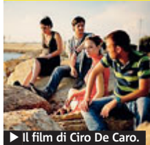
► Il film di Ciro De Caro.