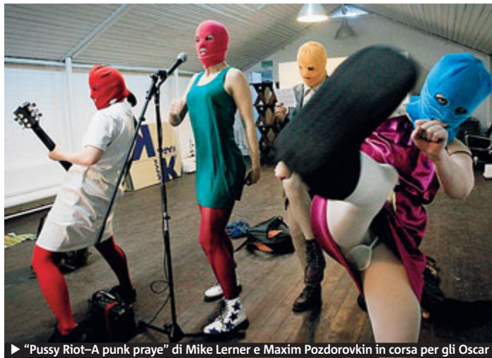
► “Pussy Riot—A punk prayer” di Mike Lerner e Maxim Pozdorovkin in corsa per gli Oscar

► Lerner & Pozdorovkin parlano del loro docu-film