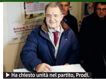
► Ha chiesto unità nel partito, Prodi.