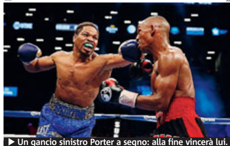
► Un gancio sinistro Porter a segno: alla fine vincerà lui.

BOXE Notte di stelle ieri nella Grande Mela: il pugile statunitense Shawn Porter (nella foto qui di lato, mentre sferra un irresistibile gancio sinistro) ha infatti conquistato il titolo mondiale dei pesi welters versione Ibf, battendo ai punti (con un verdetto unanime da parte della giuria) il rivale Devon Alexander, anche lui statunitense, in un match molto teso e sempre combattuto alla pari. Il pugile australiano di origine camerunense Sakio