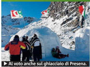
► Al voto anche sul ghiacciaio di Presena.