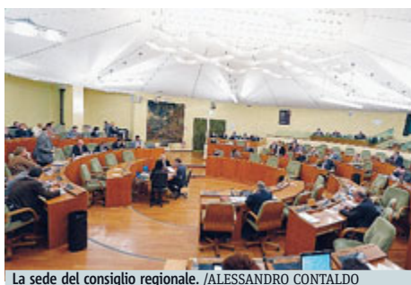
La sede del consiglio regionale.