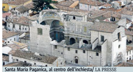
Santa Maria Paganica, al centro dell'inchiesta

Per questo la Procura aquilana ha disposto cinque ordinanze di custodia cautelare (tre ai domiciliari e due in carcere) nell'ambito dell'operazione cosiddetta "Betrayal". Complessivamente sono 17 gli indagati a cui gli inquirenti contestano, a vario titolo, reati che vanno dalla corruzione aggravata per un atto contrario ai doveri d'ufficio alla falsità ideologica commessa dal