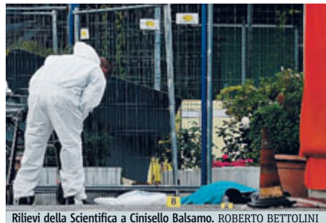
Rilievi della Scientifica a Cinisello Balsamo.

Fermato perché sospettato dell'omicidio è un italiano di 34 anni, bloccato sul ponte di Bresso in stato confusionale ma senza alcuna arma addosso. Secondo la prima ricostruzione, l'omicidio sarebbe