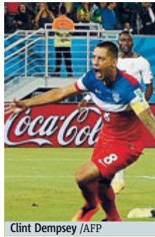
Clint Dempsey /AFP