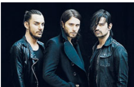
La band Usa capitanata dal premio Oscar Jared Leto.

CONCERTI Sono una delle band più amate dal pubblico giovane, soprattutto al femminile, grazie alla bella presenza di un fascinoso leader come Jared Leto, che divide la sua impegnata esistenza fra musica e cinema. Grande attesa, quindi, per l'avvento dei 30 Seconds To Mars, domani al Palaolimpico (h 21, euro 42.55/51.75), che verrà preso d'assalto dai tanti appassionati (i cosiddetti Echelon), vogliosi di saggiare da vicino il sex-