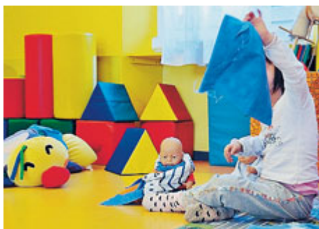
Al Sud l'accesso ai nidi è basso: in Calabria il 2,5%

bini in età compresa tra gli 0 e i 3 anni erano 2.171.465, di questi uno su cinque è nato da almeno un genitore straniero. Ma per molti mancano le risorse e, di conseguenza, i