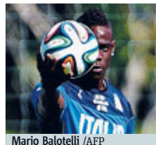
Mario Balotelli

rebbe da quota 30 mln. Riguardo SuperMario, poi, movimenti fantacalcistici non vanno esclusi: con Messi sponsor di Higuain e il Barcellona che potrebbe riempire le tasche di De Laurentiis di soldi veri, immaginare Balotelli sotto il Vesuvio non è assurdo. Più concretamente,