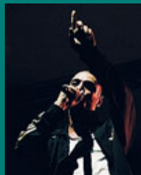
Marracash.