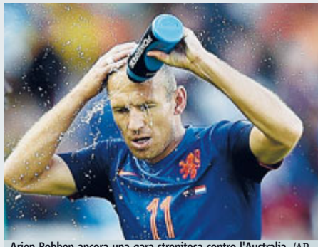
Arjen Robben ancora una gara strepitosa contro l'Australia.

CALCIO L'Olanda vince ancora al termine di una gara pazzica contro l'Australia: 3-2. Van Gaal conferma l'undici che aveva polverizzato la Spagna e dopo 20 minuti la strada per l'Olanda è in discesa. Robben recupera palla a centrocampo e arriva fino all'area di rigore dove fulmina Ryan. Neanche il tempo di esultare che Cahill gela l'entusiasmo del tifo olandese allo stadio "Beira Rio": l'attaccante australiano calcia al volo un cross che si insacca alle spalle di Cillessen, per un gol spettacolare, forse il più bello del Mondiale. Poi Jedinak fa