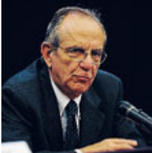
Il ministro Padoan