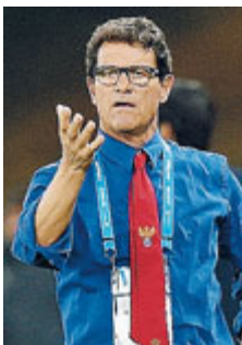
Fabio Capello