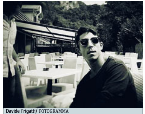
Davide Frigatti / FOTOGRAMMA