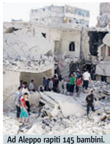
Ad Aleppo rapiti 145 bambini.

In Iraq i guerriglieri jihadisti ora puntano alla conquista delle infrastrutture petrolifere nel Nord del Paese e alcune delle principali compagnie petrolifere occidentali hanno dato l'ordine di evacuare gran parte del proprio