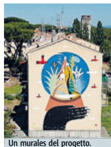
Un murales del progetto.