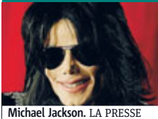
Michael Jackson.