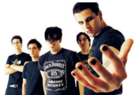
La band californiana.

CONCERTI Grandi nomi del panorama rock mondiale fra oggi e sabato sul palco dell'Ippodromo delle Capannelle per PostePay Rock in Roma. Stasera alle 21,30 ospiti del festival romano sono gli Avenged Sevenfold, band californiana già ospite della rassegna due anni fa. Il gruppo di Huntington Beach ha ottenuto un successo incredibile con i quattro dischi pubblicati in carriera, dall'album di debutto del 2005 "City of