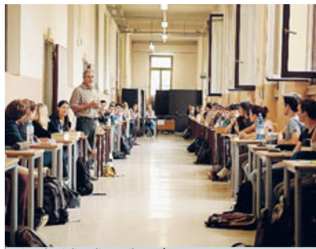
Gli studenti di un liceo milanese

• La prova In collegamento via Skype dall'India, Girone ha affrontato ieri la prova scritta di italiano. Il tema scelto dal fuciliere di Marina è quello dedicato alla fragilità e alla bellezza dell'Italia (Renzo Piano).