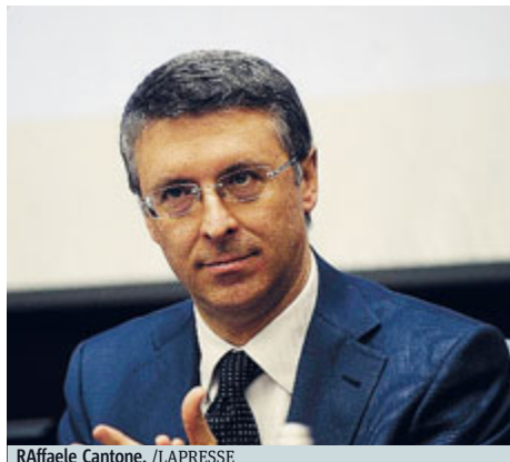
Raffaele Cantone.

ROMA Un altro esposto alla procura di Venezia e uno alla Corte dei Conti. Non si ferma Italia Nostra, da anni attiva sul fronte No Mose che ieri in una conferenza stampa ha illustrato le criticità degli appalti dell'opera che proprio oggi entrerà nella fase ulti-