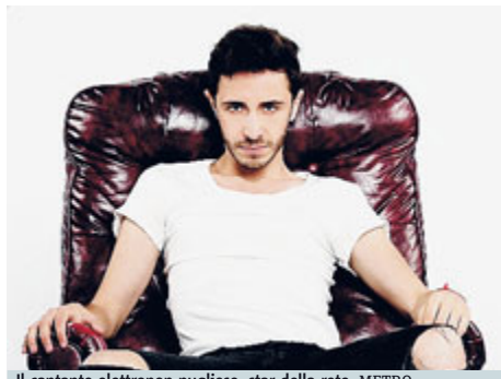
Il cantante elettropop pugliese, star della rete. METRO

Live a NY per la web star italiana. "Anch'io ne fui vittima" dice il cantante che punta su Renzi per i diritti dei gay