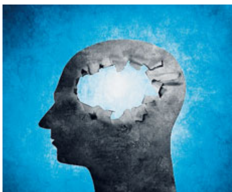
Il costo dell'Alzheimer è pari all'1% del pil mondiale