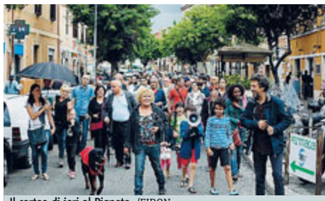
Il corteo di ieri al Pigneto.

Pigneto e S. Lorenzo assediate dai pusher a ogni ora del giorno nonostante le raffiche di arresti del 2013. I residenti esasperati