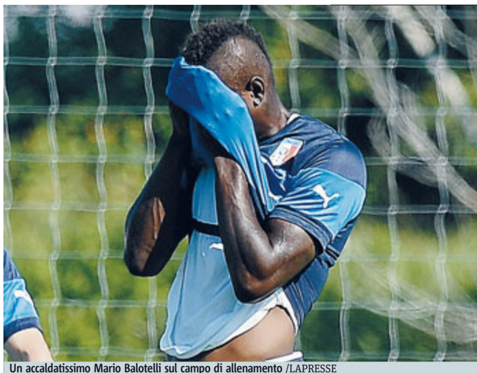
Un accaldatissimo Mario Balotelli sul campo di allenamento

CALCIO Altro che Costa Rica, sono il caldo e l'umidità la vera ossessione di Prandelli. Domani l'Italia, considerando anche il match da ultima spiaggia tra Uruguay e Inghilterra, potrebbe staccare il biglietto per gli ottavi se batte i centroamericani. Il problema è che a Recife le condizioni climatiche saranno terribili. Prandelli ha quindi voluto che i suoi si allenassero in condizioni analoghe (ore 13 locali). Insomma caldo tremendo e umidità asfissiante. Ma se c'è grandissima attenzione alla tenuta atletica, Prandelli sta anche pensando alla tattica per disinnescare Campbell e compagni ritoccando la squadra che ha battuto l'Inghilterra. A meno di ripensamenti dell'ultima ora Buffon dovrebbe tornare tra i pali con buona pace di Sirigu. Paletta non ha convinto e dovrebbe essere sostituito da Abate che però giocherà a destra con conseguente spostamento di Darmian sulla fascia sinistra. Cambio anche centrocampo in parte condizionato dal clima. Dentro Thiago Motta fuori Verratti. Prandelli non vuole che