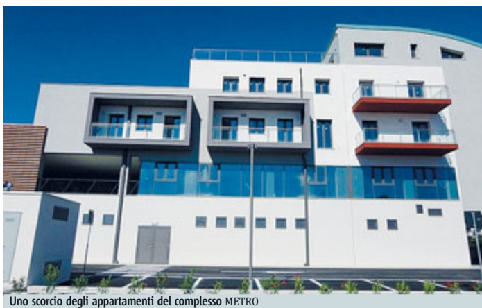
Uno scorcio degli appartamenti del complesso METRO

EDILIZIA Sono circa un milione, ha detto giorni fa il ministro dell'Ambiente, Galletti, gli occupati italiani «nel settore delle rinnovabili e dell'efficienza energetica», e solo nell'edilizia, nel 2013, sono a quota «339mila con un incremento del 42% rispetto al 2012» grazie alla politica di incentivi. Che il quadro non sia obbligatoriamente fosco è dimostrato, forse, anche dalla riuscita di importanti progetti. Uno degli ultimi a essere battezzati è l'"ecocittà" di Porto Potenza Picena, una ex area industriale (a 150 metri dal mare) trasformata in un quartiere commerciale-residenziale in classe A (per il riscaldamento e l'acqua calda sanitaria è previsto un impianto centralizzato con alimentazione a metano e caldaia a condensazione,