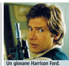
Un giovane Harrison Ford.