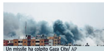
Un missile ha colpito Gaza City