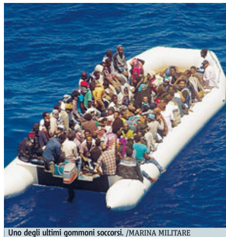
Uno degli ultimi gommoni soccorsi.

Intanto la notte scorsa le navi della Marina Militare hanno affrontato diverse situazioni di emergenza nel soccorso e recupero di molti migranti in arrivo dalle coste nordafricane. In totale sono 1.771 le persone soccorse negli ultimi giorni e in attesa dello sbarco nei porti