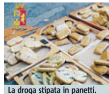
La droga stipata in panetti.

ANCONA Papà, mamma (incinta) e 4 figli. Erano partiti il 4 luglio in camper alla volta della Grecia per quella che sembrava una vacanza in famiglia. In realtà era un viaggio "d'affari". L'uomo, 44 anni, e la donna di 35, entrambi liguri, sono stati infatti arrestati al porto di Ancona con l'accusa di spaccio internazionale di stupefacenti. Il camper era im-