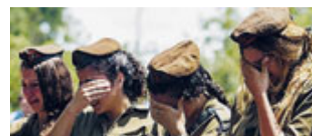
Soldatesse israeliane al funerale di un compagno