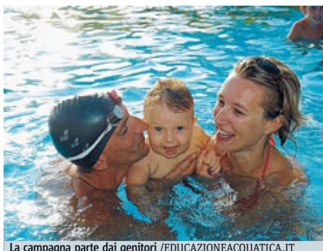
La campagna parte dai genitori

FAMIGLIA «Dai primi bagnetti alla prima scoperta del mare... con Tuo figlio, in acqua, devi sempre sapere cosa fare!». È lo slogan della campagna educativa volta a sensibilizzare le famiglie sui rischi connessi all'acqua, che sia del mare o di una piscina. L'iniziativa, con spot tv e radio in onda sulle principali emittenti radiotelevisive italiane fino al 31 agosto, è promossa da Acquatic Education (associazione nata nel 2009 per sostenere e promuovere un progetto ambizioso: veicolare, su scala nazionale, europea e mondiale, una mirata sensibilizzazione dedicata alla sicurezza in acqua in età pediatrica). Quello che emerge dalle statistiche è che i bambini e i giovani di età compresa tra 0 e 17 anni sono i più colpiti dal fenomeno degli incidenti in acqua e tanti,