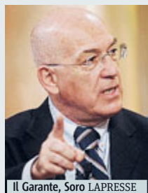
Il Garante, Soro