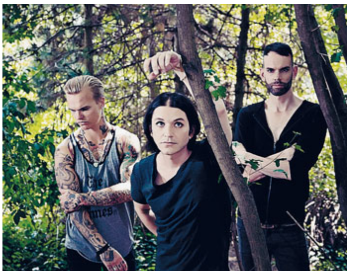
In scaletta oltre alle novità di "Loud Like Love" anche gli altri successi.

MUSICA Sono sulla scena da una ventina d'anni. E, nonostante lo scorrere del tempo e delle mode, sono ancora in grado di smuovere le platee e suscitare emozioni col loro stile particolare, in efficace equilibrio fra memorie "glam", echi bowiani, rock alternativo, impeti rabbiosi e momenti più riflessivi. Parliamo dei Placebo, stasera di scena all'Ippodromo del Galoppo (ore 21, euro 41.40/51.75) per "Alfa Romeo City Sound". Un gruppo dal fascino cupo e un po' perverso, che si traduce spesso in canzoni torbide e inquietanti, molto amate dai fan. Al centro ci sarà il cantante Brian Molko, una delle star più ambigue della scena rock. In scaletta, oltre alle novità di "Loud Like Love", non mancheranno i momenti più alti di una carriera disseminata di album intri-