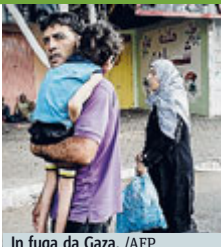
In fuga da Gaza.

Appello dell'Onu per un cessate il fuoco immediato. Ma la strage non si ferma FATTI E STORIE