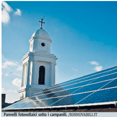
Pannelli fotovoltaici sotto i campanili.

«C'è stato un desiderio esplicito espresso al Comitato della Finanza di includere i combustibili fos-