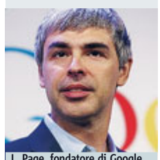
L. Page, fondatore di Google