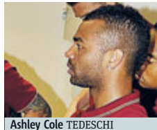
Ashley Cole

CALCIO La fame è tanta. Nonostante i 33 anni, Ashley Cole ha ancora grandi ambizioni. «Ho scelto la Roma perché voglio contribuire alla conquista dello scudetto - ha detto nella sua prima intervista - ho avuto offerte da squadre minori, anche dagli Usa, ma non avevo voglia di sdraiarmi in spiaggia. Ho vinto molto e non voglio fermarmi. Impossibile,