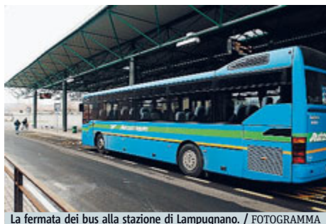
La fermata dei bus alla stazione di Lampugnano.

TRASPORTI «Non ci sono più soldi». È lapidario l'assessore ai Trasporti della Provincia Franco de Angelis. Interrogato sui tagli previsti per il trasporto su gomma, anticipati ieri da Metro, l'Assessore ammette: «I gestori dovranno rivedere i loro piani di servizio». Cioè, dovranno tagliare le corse. Da settembre, infatti, la Provincia dovrà tagliare circa 200mila Km-bus (sui 40 milioni totali effettuati).