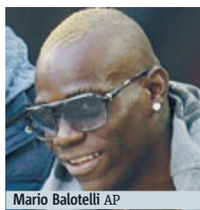
Mario Balotelli

12 mln cash più Niang avvicinandosi così alla quota 20 immaginata da Cairo, il quale sostituirebbe l'azzurro con Facundo Ferreyra, in fuga dallo Shaktar. Rimanendo a Mi-