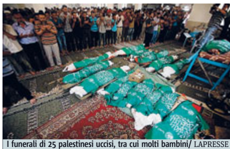
I funerali di 25 palestinesi uccisi, tra cui molti bambini

Fonti palestinesi hanno invece riferito che ieri in un raid israeliano su Rafah, sarebbero rimaste uc-