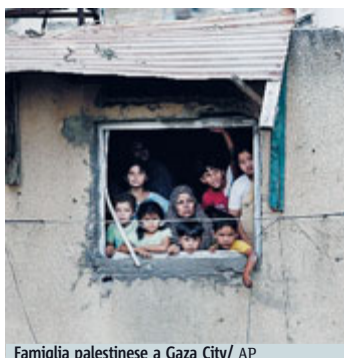
Famiglia palestinese a Gaza City