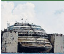
La prua riemorsa.