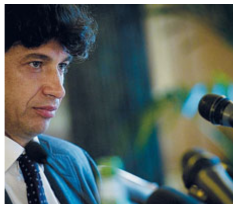
Demetrio Albertini: partita la scalata alla Figc

sembra stia avvenendo in questi giorni. Io ho il sogno che il calcio italiano possa tornare ad essere come era negli anni '90, quando il nostro era il campionato più bello del mondo». «Mi metto a disposizione di quello che potrebbe essere il rilancio, potrei fare il regista del cambio di marcia del nostro calcio. D'altra parte il regista lo facevo già in campo», ha detto. METRO