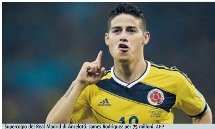
Supercolpo del Real Madrid di Ancelotti: James Rodriguez per 75 milioni.

CALCIO Fuori uno, avanti un altro. Wenger dice che no, «l'Arsenal non cerca Balotelli, avendo preso Sanchez e confermato Giroud». Vero o no, le voci di ieri riguardano il Galatasaray di Prandelli: la base rimangono sempre i 20 milioni, da Istanbul potrebbe partire Sneijder e certo però che, se tutto fosse vero, l'ex ct azzurro avrebbe un bel coraggio a riprendersi in casa l'ex SuperMario. Al Milan comunque non stanno fermi e Alessio Cerci è diventato il principale nome da inseguire: Lavezzi resta pure una grande tentazione, ma sull'argentino c'è da registrare lo scatto della Juve, avvenuto già lo scorso fine settimana e destinato a mantenere i bianconeri in vantaggio anche perché possono offrire il palcoscenico della Champions. Per Cerci, Galliani è pronto a offrire