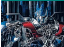
Un autorobot.