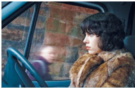
Scarlett Johansson in una scena di "Under the skin".

La Johansson, novella aliena sanguinaria, presenta il nuovo (e discusso) film "Under the skin" di Jonathan Glazer