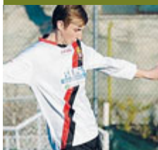
Lorenzo Costantini/ FACEBOOK