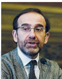
Riccardo Nencini.

L'interesse del governo e degli italiani è avere una struttura unica e averla sotto il ministero dei Trasporti. Questo significa