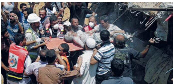
Una vittima estratta dalle macerie a Gaza ieri, dopo un raid israeliano