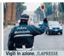
Vigili in azione.