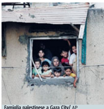
Famiglia palestinese a Gaza City