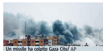
Un missile ha colpito Gaza City