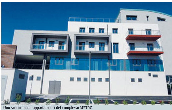
Uno scorcio degli appartamenti del complesso METRO

EDILIZIA Sono circa un milione, ha detto giorni fa il ministro dell'Ambiente, Galletti, gli occupati italiani «nel settore delle rinnovabili e dell'efficienza energetica», e solo nell'edilizia, nel 2013, sono a quota «339mila con un incremento del 42% rispetto al 2012» grazie alla politica di incentivi. Che il quadro non sia obbligatoriamente fosco è dimostrato, forse, anche dalla riuscita di importanti progetti. Uno degli ultimi a essere battezzati è l'"ecocittà" di Porto Potenza Picena, una ex area industriale (a 150 metri dal mare) trasformata in un quartiere commerciale-residenziale in classe A (per il riscaldamento e l'acqua calda sanitaria è previsto un impianto centralizzato con alimentazione a metano e caldaia a condensazione,