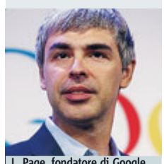
L. Page, fondatore di Google