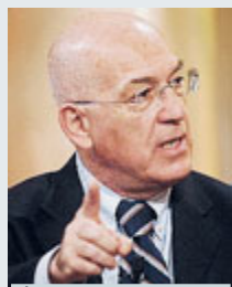
Il Garante, Soro