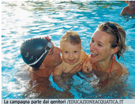
La campagna parte dai genitori

FAMIGLIA «Dai primi bagnetti alla prima scoperta del mare... con Tuo figlio, in acqua, devi sempre sapere cosa fare!». È lo slogan della campagna educativa volta a sensibilizzare le famiglie sui rischi connessi all'acqua, che sia del mare o di una piscina. L'iniziativa, con spot tv e radio in onda sulle principali emittenti radiotelevisive italiane fino al 31 agosto, è promossa da Acquatic Education (associazione nata nel 2009 per sostenere e promuovere un progetto ambizioso: veicolare, su scala nazionale, europea e mondiale, una mirata sensibilizzazione dedicata alla sicurezza in acqua in età pediatrica). Quello che emerge dalle statistiche è che i bambini e i giovani di età compresa tra 0 e 17 anni sono i più colpiti dal fenomeno degli incidenti in acqua e tanti,