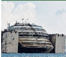
La prua riemorsa.