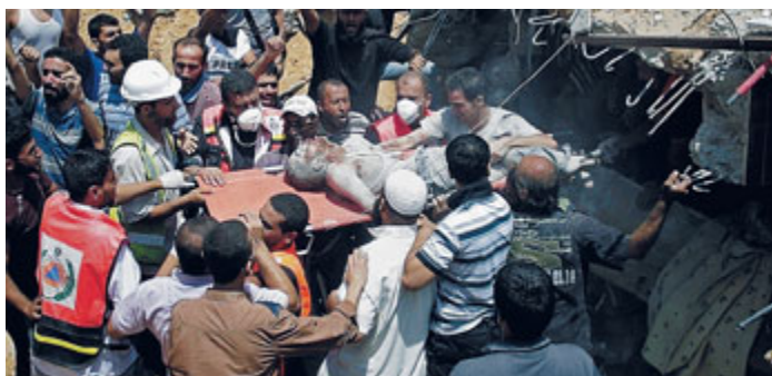
Una vittima estratta dalle macerie a Gaza ieri, dopo un raid israeliano