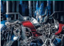
Un autorobot. METRO