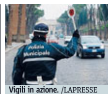
Vigili in azione.