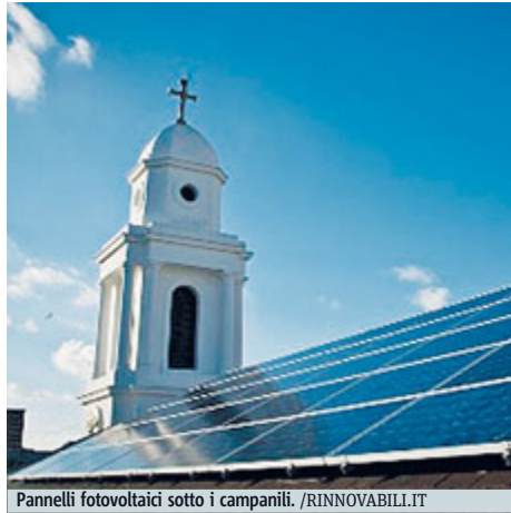
Pannelli fotovoltaici sotto i campanili.

«C'è stato un desiderio esplicito espresso al Comitato della Finanza di includere i combustibili fos-