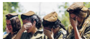
Soldatesse israeliane al funerale di un compagno