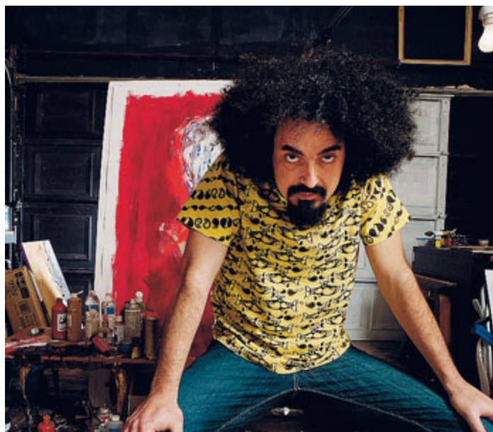
Michele Salvemini, in arte "Caparezza", questa sera alle 21.30 all'ippodromo delle Capannelle.

molto importante) per arrivare al nuovo album che è uscito lo scorso aprile. «Ogni brano di "Museica" spiega quindi Caparezza prende spunto da un'opera pittorica che diventa pretesto per sviluppare un concetto. Non esiste dunque una traccia che possa rappresentare l'intero disco perché non esiste un quadro che possa rappresentare l'intera galleria. In pratica questo album, più che ascoltato, va visitato». Ad aprire la serata sarà invece un set dei "Kutso", band rivelazione dell'anno. STEFANO MILIONI