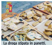
La droga stipata in panetti.

ANCONA Papà, mamma (incinta) e 4 figli. Erano partiti il 4 luglio in camper alla volta della Grecia per quella che sembrava una vacanza in famiglia. In realtà era un viaggio "d'affari". L'uomo, 44 anni, e la donna di 35, entrambi liguri, sono stati infatti arrestati al porto di Ancona con l'accusa di spaccio internazionale di stupefacenti. Il camper era im-