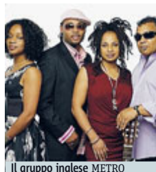
Il gruppo inglese METRO

MUSICA Sonorità funky fra jazz e dance saranno protagonisti stasera alle 21,30 sul palco del Campo Boario. Ospiti del festival "Eutropia" sono gli Incognito, storica band inglese che proprio quest'anno festeggerà i "primi" 35 anni di attività, 35 anni di ottima musica, creata sempre per cercare di anima-