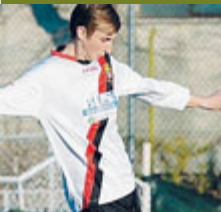
Lorenzo Costantini/ FACEBOOK