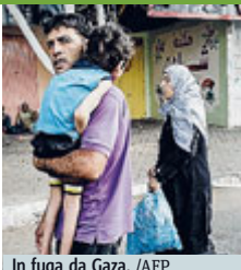
In fuga da Gaza.

Appello dell'Onu per un cessate il fuoco immediato. Ma la strage non si ferma FATTI E STORIE