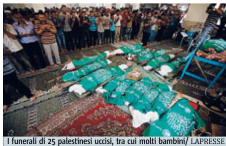
I funerali di 25 palestinesi uccisi, tra cui molti bambini

Fonti palestinesi hanno invece riferito che ieri in un raid israeliano su Rafah, sarebbero rimaste uc-