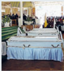
I funerali delle suore.