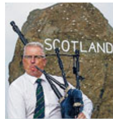
Sul confine scozzese

GB Ultima settimana prima del referendum sull'indipendenza della Scozia, e dopo la grande rimonta dei favorevoli queste sembrano le ore della riscossa dei contrari. Soprattutto pesano le incertezze economiche sull'eventuale nuovo Paese, che già hanno spaventato la Borsa e la sterlina. Ieri la Royal Bank of Scotland ha annunciato che in caso di secessione trasferirà la sua sede via da Glasgow preferendo Londra. Ma per il leader indipendentista Salmond, la Scozia