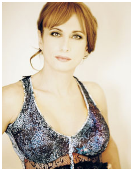
Vladimir Luxuria, direttrice artistica della kermesse.

Dal giovedì al sabato - ingresso gratis h 20-21. Da 8 a 18 gli altri giorni compresa consumazione (infotel. 3930046560 oppure su www.gayvillage.it ). ORI. CIC.