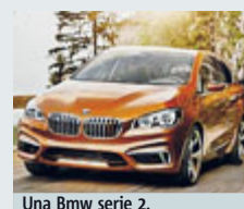
Una BMW serie 2.

AUTO Alphabet, azienda di noleggio a lungo termine del Gruppo BMW, lancia anche in Italia il progetto AlphaCity, cioè l'auto aziendale in condivisione. L'obiettivo è ridurre i costi per gli spostamenti di lavoro di dipendenti e collaboratori, in alternativa al taxi, al noleggio con conducente