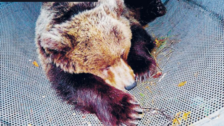
L'orsa Daniza narcotizzata durante una precedente cattura del 2011.