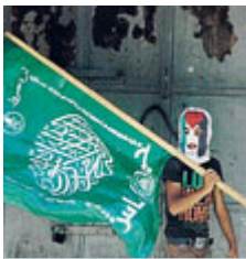
Militante a Gaza.

PALESTINA Negoziare con Israele non è haram, ovvero non è vietato dalla legge islamica. Lo ha detto Mousa Abu Marzouk, membro dell'ufficio politico del movimento. «Finora la nostra politica era quella di non negoziare con l'occupante, ma i palestinesi devono capire che questo non è proibito dalla legge islamica», ha detto. «Visto che possiamo negoziare tramite le armi, lo possiamo fare anche con le parole», ha aggiunto. L'esponente islamico ha affermato che