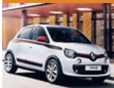
La nuova Renault Twingo