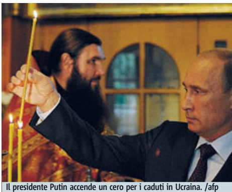
Il presidente Putin accende un cero per i caduti in Ucraina.

RUSSIA. La nuova tornata di sanzioni che entrano in vigore oggi dimostrano che «l'Ue ha fatto operato scelte contrarie ad una soluzione pacifica della crisi inter-ucraina», ha affermato ufficialmente il ministero degli Esteri russo denunciando come «i leader Ue debbano rispondere alla domanda dei loro cittadini sul perché abbiano deciso di porli a rischio di un confronto (militare), della stagnazione economica e della disoccupazione», decidendo di colpire Mosca.