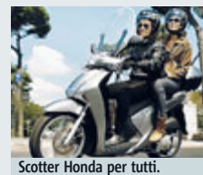
Scotter Honda per tutti.

MOTO Honda ha lanciato una promozione per facilitare l'acquisto di qualsiasi modello dei suoi scooter, come quelli della gamma SH, l'Integra, il PCX, il maxi SW-T400, valida per il mese di settembre: permette l'acquisto distribuendo la spesa su piccole rate. La promozione, nata dal-