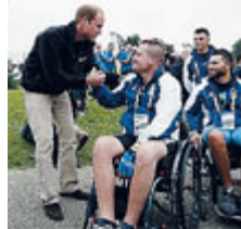
L'incontro principesco

Il principe ha incontrato gli atleti italiani al tor- neo Invictus dei militari feriti SPORT