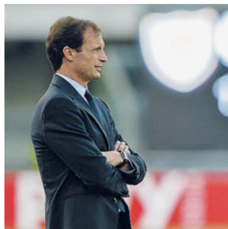
Allegri: sospiro di sollievo per il recupero dell'Apache.

poli: succederà spesso, in questa prima parte della stagione, che le due principali rivali per lo scudetto giochino il sabato complice gli impegni di Champions. «Ha ragione Garcia, la Juventus non si è indebolita - ha detto ieri il ds giallorosso Sabatini -. Noi però abbiamo ridotto il gap, che non era ampio