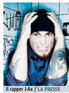
Il rapper J-Ax