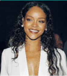
La cantante.