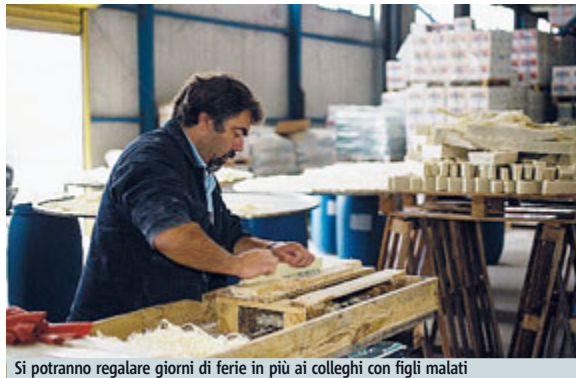
Si potranno regalare giorni di ferie in più ai colleghi con figli malati

Approvato ieri anche un emendamento del Governo per ampliare la platea di imprese che possono far ricorso ai contratti di solidarietà rimuovendo gli ostacoli per il contratto di solidarietà espansivo, quello cioè che favorisce nuove assunzioni attraverso una contestuale riduzione