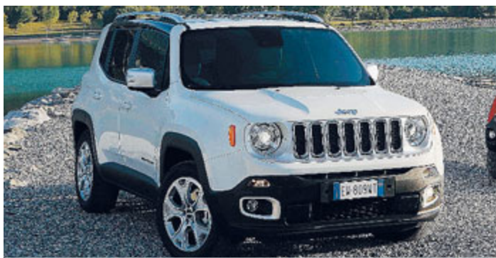
La prima Jeep made in Italy (fatta a Melfi) arriva sul mercato a settembre: è la Renegade METRO

Ecco la nuova Twingo. Risultato di un accordo fra Renault e Mercedes è la "gemella" della futura Smart a 4 porte. Trazione posteriore, guida alta e numeri da record in città. In vendita dal 20 settembre. METRO