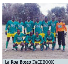
La Koa Bosco FACEBOOK

CALCIO Metti una squadra che non ha più soldi per iscriversi al campionato. Ma non una squadra qualsiasi, di creste all'aria e muscoli da rivista: a non potersi iscrivere al campionato di terza categoria è l'Asd Koa Bosco, composta da soli immigrati della tendopoli di Rosarno e nata, alla faccia del razzismo che abita gli stadi, dall'impegno di don Roberto Meduri, parroco nella frazione Bosco di Rosarno, e di Domenico Bagala, ad della società. Mancano 7000 euro. I conti della serva: 1950