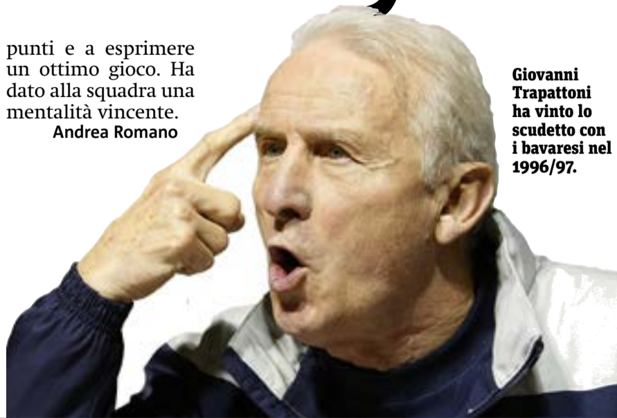
Giovanni Trapattoni ha vinto lo scudetto con i bavaresi nel 1996/97.