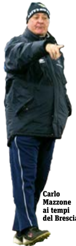
Carlo Mazzone ai tempi del Brescia.