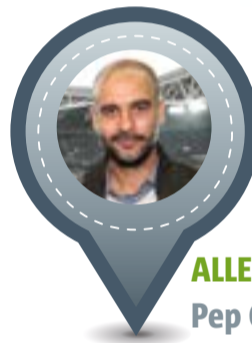
ALLENATORE Pep Guardiola