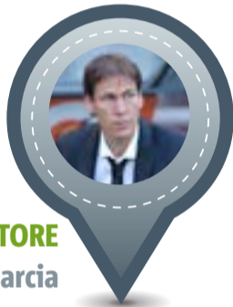
ALLENATORE Rudi Garcia