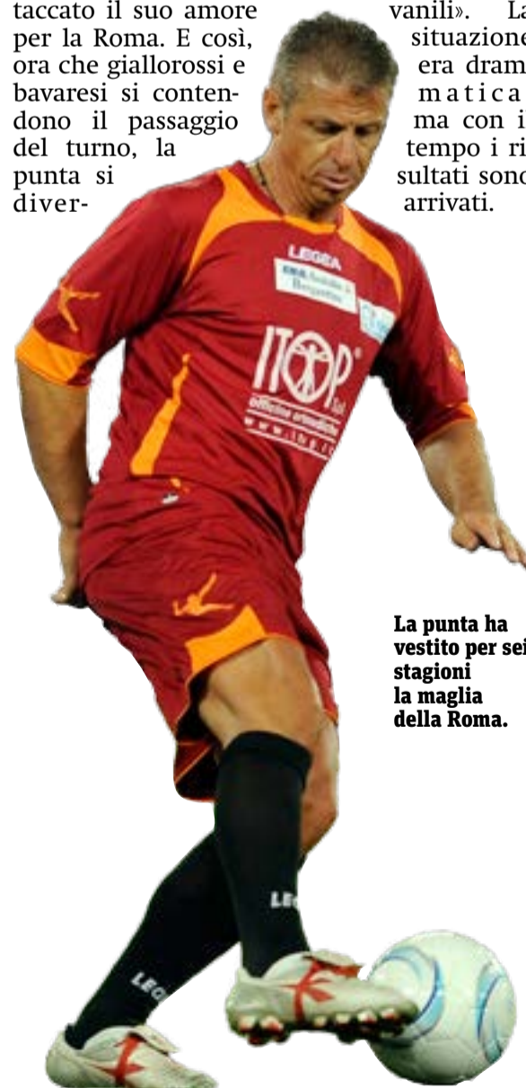
La punta ha vestito per sei stagioni la maglia della Roma.

Molto frizzante. La Federazione tedesca aveva deciso di investire sui giovani. Diceva alle squadre: «Io ti do 100, ma 30 sono per le giovanili». La situazione era drammatica, ma con il tempo i risultati sono arrivati.