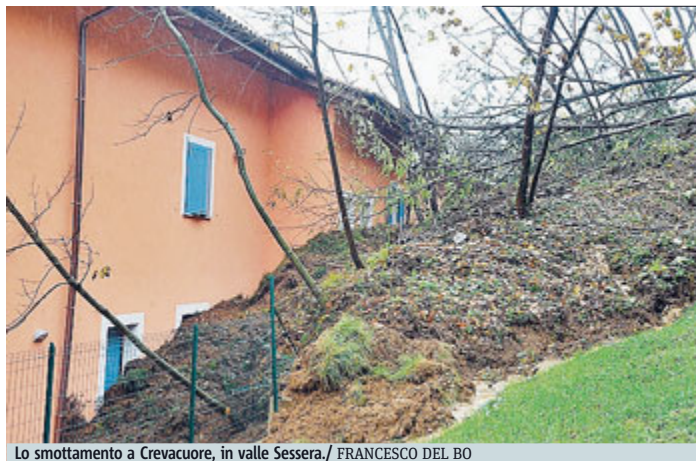
Lo smottamento a Crevacuore, in valle Sessera.

Numerose esondazioni si sono registrate in Lombardia. Sorvegliati speciali il lago Maggiore, il fiume Olona, il Po che ha rotto gli argini fra le province