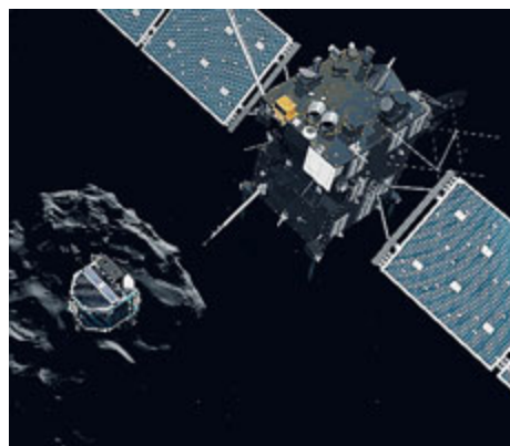
La sonda Rosetta (destra) e il modulo Philae.

Philae è un lander distaccato dalla sonda Rosetta, la quale ha viaggiato per 10 anni con la missione di raggiungere la cometa. Costata circa un miliardo di euro e dal peso approssimativo di tre tonnellate, la sonda Rosetta trasporta 21 strumenti scientifici, 11 dei quali sulla navicella orbitante e 10