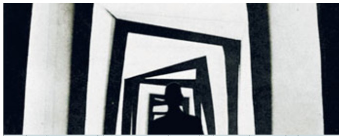
Korridor sarà protagonista del 2° appuntamento di Sensoralia, il 29 novembre a La Pelanda.