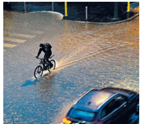
Esondazione del Seveso tra via Veglia e Largo Desio PHOTOVIEWS