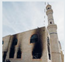
La moschea bruciata.

MO Coloni israeliani hanno bruciato nella notte una moschea vicino Ramallah, mentre estremisti palestinesi hanno attaccato una sinagoga a Gerusalemme est. Fonti della sicurezza palestinese hanno riferito che «i coloni hanno dato fuoco al primo e al secondo piano» della moschea nel villaggio di Al-Mughayir, nei pressi dell'insediamento di Shilo, nella zona subito dopo sono scoppiati scontri. Sconosciuti hanno in-