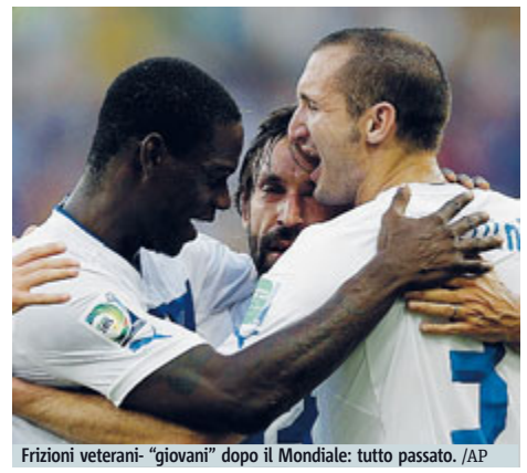
Frizioni veterani- "giovani" dopo il Mondiale: tutto passato.

rico per affrontare questa avventura che sarà importante per l'Italia e anche per lui». Nel frattempo, Marco Verratti ha lasciato Coverciano: ieri mattina il centrocampista del Psg ha fatto ritorno in Francia per proseguire le cure fisioterapiche necessarie al recupero dalla tendinopatia inserzionale all'adduttore sinistro che gli aveva impedito di allenarsi da lunedì. METRO