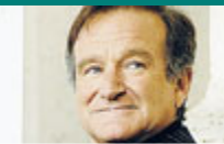
L'attore morto suicida.