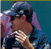
Sebastian Vettel.