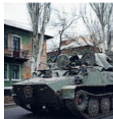
Blindati in Ucraina.

E si aggrava anche la situazione in Ucraina. La Nato ha confermato l'in-