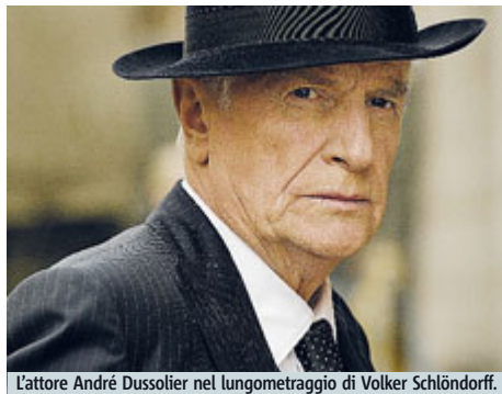
L'attore André Dussolier nel lungometraggio di Volker Schlöndorff.

CINEMA Una notte per salvare Parigi. È la notte tra il 24 e il 25 agosto del '44, gli alleati entrano nella città e, a un passo dall'alba, il generale tedesco Dietrich von Choltitz, governatore militare di Parigi, si prepara ad eseguire gli ordini di Hitler, distruggere la capitale francese. Ponti e monumenti erano già tutti stati minati e pronti ad esplodere ma l'ordine non arrivò perché von Choltitz, da sempre fedele al Terzo Reich, si rifiutò di farlo eseguire. La storia è questa, ce la racconta