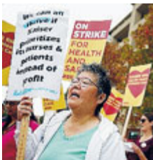
Proteste degli infermieri.

Negli Stati Uniti 18 mila infermieri hanno incrociato le braccia e manifestato in 16 Stati e in diverse città degli Usa per chie-