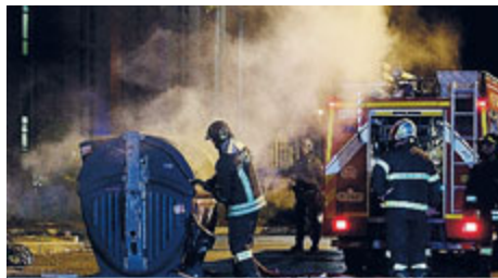
L'ultima notte di scontri, martedì sera.

Il primo cittadino ha incontrato i comitati di quartiere, tra cui quello di Tor Sapienza, assicurando a breve l'apertura di una biblioteca, la pulizia straordinaria delle strade e nuova illuminazione. Il presidente del