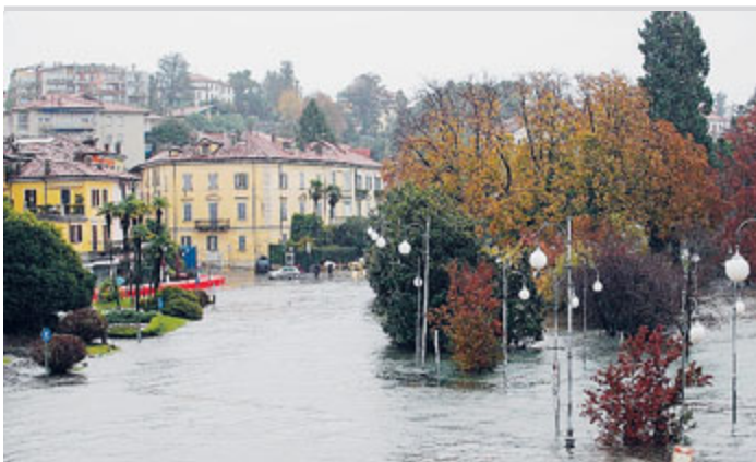
Esondazione del Lago Maggiore a Pallanza: la passeggiata sul lungolago di Verbania.