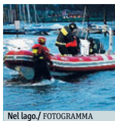
Nel lago.