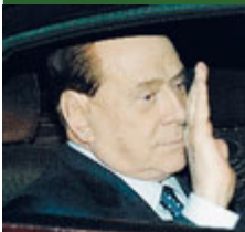
Silvio Berlusconi