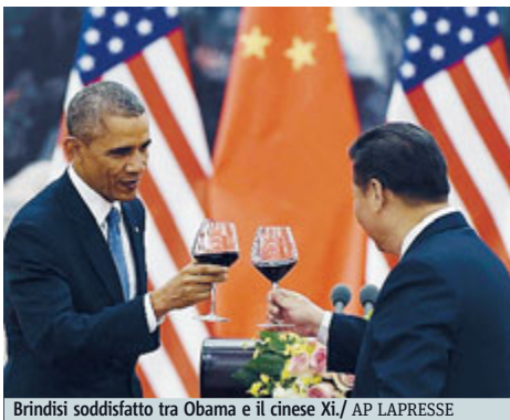
Brindisi soddisfatto tra Obama e il cinese Xi.

CINA Il presidente americano Barack Obama e il suo collega cinese Xi Jinping hanno concordato a Pechino nuovi obiettivi sulle emissioni di CO2 nell'ambito della lotta contro i cambiamenti climatici. Xi ha annunciato che l'aumento delle emissioni cinesi di CO2 verrà fermato entro il 2030 e che entro quella data il 20% dell'energia non proverrà da fonti fossili. Il leader cinese non ha fissato un limite al livello delle emissioni o quantificato la loro riduzione,