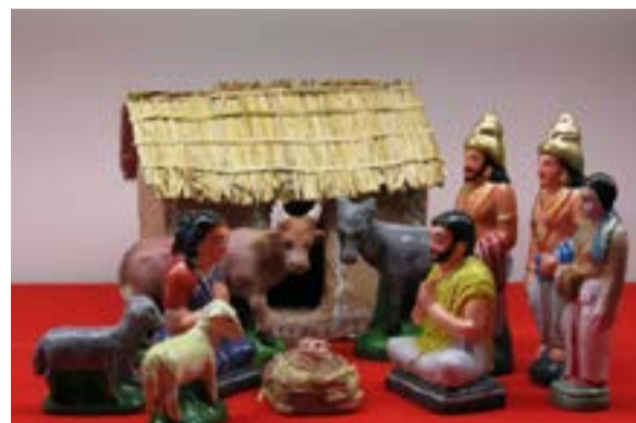
Presepi dal mondo all'Abbazia di Morimondo - India - foto di don Mauro Loi.