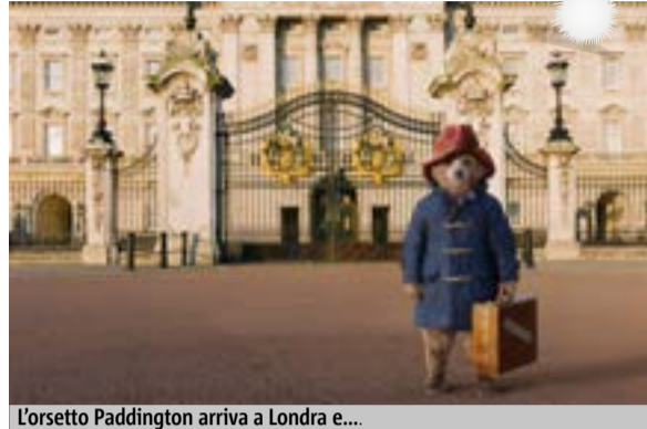
L'orso Paddington arriva a Londra e...

A contendere il record al botteghino sarà poi Paddington. La storia di un giovane orso di nome-