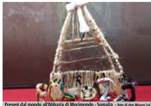
Presepi dal mondo all'Abbazia di Morimondo - Somalia