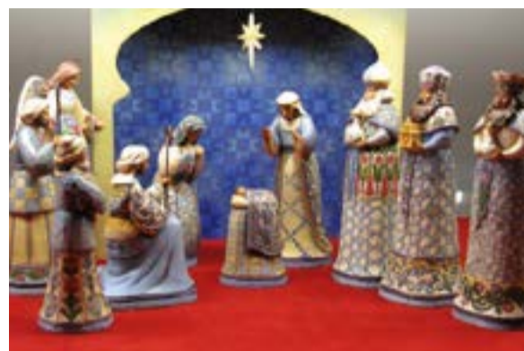
Presepi dal mondo all'Abbazia di Morimondo - USA - foto di don Mauro Loi.