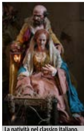
La natività nel classico italiano.

Nel segno della multiculturalità Che Milano tenti di diventare sempre più cosmopolita è un dato