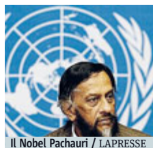
Il Nobel Pachauri

NIGERIA Una donna kamikaze si è fatta esplodere su una corriera in una stazione alla periferia di Potiskum, nel nord-est della Nigeria, causando 20 morti e 53 feriti. AGI