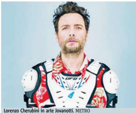
Lorenzo Cherubini in arte Jovanotti.

L'artista torna in pista con "Lorenzo 2015 cc", 30 brani tra rap, dance e folk dove si parla anche di Lampedusa