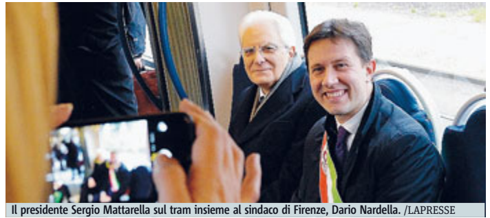
Il presidente Sergio Mattarella sul tram insieme al sindaco di Firenze, Dario Nardella.

FIRENZE Per raggiungere la Scuola superiore della Magistratura a Scandicci il presidente Mattarella ha preso il tram da Firenze. Il capo dello Stato ha parlato di «un bisogno di legalità fortemente avvertito», ha ricordato che il magistrato non è «né protagonista né burocrate» e serve «una risposta di giustizia tempestiva». Intanto con 265 sì, 51 contrari e 63 astenuti, la Camera ha approvato la riforma della responsabilità civile dei magistrati. Ora è legge. METRO