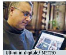
Ultimi in digitale. /METRO

BRUXELLES L'Italia è sotto la media Ue per l'economia digitale ed è il peggior Paese Ue per copertura di internet veloce. Abbiamo dietro solo Grecia, Bulgaria e Romania. Lo segnala la Commissione Ue nel rapporto sull'economia digitale. L'Italia è venticinquesima su 28 Paesi. Solo il 59% degli italiani usa internet regolarmente,