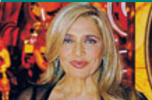
Mara Venier.