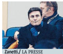
Zanetti.

CALCIO Tre vittorie di fila. Il 2-1 di Cagliari è stato un balsamo per il club nerazzurro. «Sono felicissimo, siamo molto contenti e non avevo dubbi che i risultati sarebbero arrivati»: ha detto così il vicepresidente dell'Inter e storico ex capitano Javier Zanetti. «Vedo lavorare i ragazzi - ha aggiunto - si stanno impegnando tantissimo, speriamo di continuare».