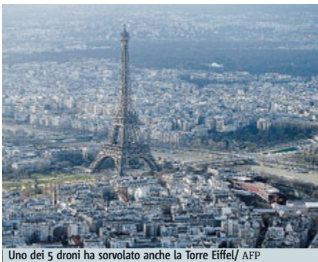
Uno dei 5 droni ha sorvolato anche la Torre Eiffel

FRANCIA Almeno cinque droni sono stati avvistati nella notte del 23 febbraio mentre sorvolavano luoghi simbolo di Parigi. Finora non è stato possibile individuare chi comandasse a distanza i piccoli velivoli che ovviamente preoccupano una Francia ancora scossa dalle stragi jihadiste di gennaio. Il primo avvistamento è avvenuto nei pressi dell'ambasciata americana, successivamente sono stati sorvolati anche la Torre Eiffel, Place de la Concorde e Les Invalides, il museo del-