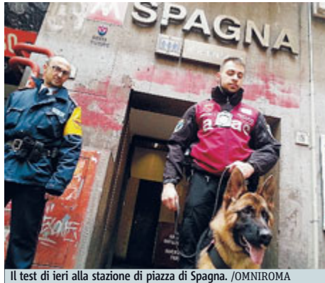
Il test di ieri alla stazione di piazza di Spagna.