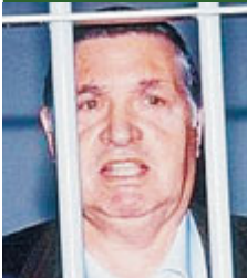
Totò Riina.