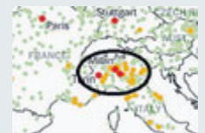
Mappa del rischio.

centuali di Pm10 (polveri sottili) nell'aria, da qui al 2030 la situazione potrebbe precipitare. Le stime preoccupanti sono basate sul fatto che già ora molte città europee sfiorano costantemente i limiti fissati da Ue e Oms.