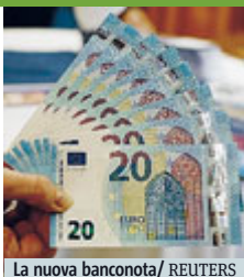
La nuova banconota

Ha un nuovo dispositivo antifalsari la nuova banconota da 20 euro, dal 25 novembre FATTI E STORIE