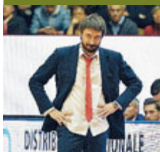
Pozzeco./ LA PRESSE