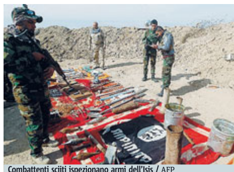
Combattenti sciiti ispezionano armi dell'Isis

Giunge notizia che gli jihadisti hanno aperto 2 scuole per bambini in lingua inglese nelle zone sotto il loro controllo in Siria