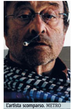
L'artista scomparso.