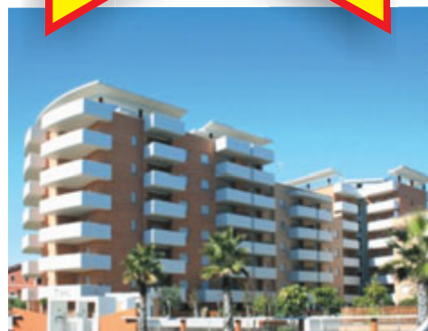
Classe energetica C