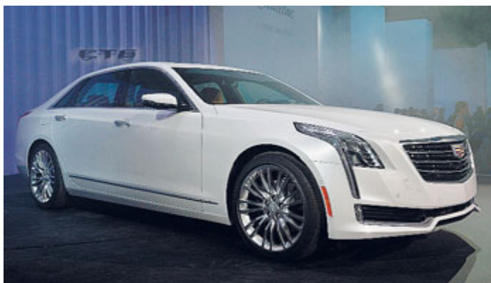
La CT6 conferma il ritorno di Cadillac nel settore delle auto più "in".

Dopo la prima di Peugeot Partner a Algeri, c'è attesa per quella nazionale al Transpotec di Verona (16-19/4). Partner vuole rafforzare la leadership del modello precedente che nel 2014 è stato il commerciale estero più richiesto in Italia. ITALPRESS