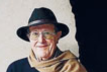
Il regista scomparso.