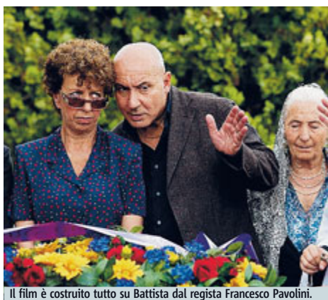
Il film è costruito tutto su Battista dal regista Francesco Pavolini.

Cornice una Roma di ponti, cominciando da quello da cui si vuol buttarlo il protagonista all'inizio del film. E, tra l'improvvisazione a raffica di Battista e Tiziana Cruciani, nel mezzo di tanta romanità (piena zeppa di cinesi e cineserie) arriva il