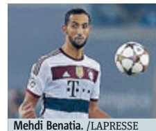
Mehdi Benatia.

CALCIO Il Marocco potrà partecipare alle prossime due edizioni della Coppa d'Africa dopo che ieri il Tas (Tribunale di arbitrato per lo Sport) di Losanna ha annullato la sanzione inflitta dalla Caf (Confederazione africana di calcio). La Caf aveva squalificato il Marocco dalle prossime due edizioni del torneo (2017 e 2019), dopo che il Paese nord africano si era