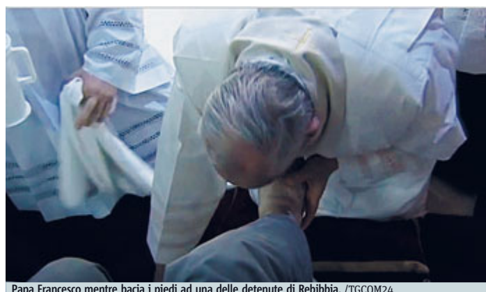
Papa Francesco mentre bacia i piedi ad una delle detenute di Rebibbia. /TGC0M24

MACERATA Uno sbilanciamento del carico (70 quintali di cozze) che ha fatto rovesciare l'imbarcazione. Sarebbe questa la causa dell'affondamento del peschereccio "Sparviero", avvenuto ieri mattina al largo di Civitanova Marche, nel quale sono morti due marittimi (un 25enne pugliese e un 19enne romeno) e altri due (entrambi romeni di 35 e 39 anni) risultano al momento dispersi. Uno dei due sopravvissuti, ricoverati in ospedale, ha riferito di un'onda "anomala" che avrebbe colpito il peschereccio. METRO