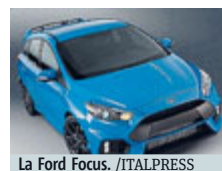
La Ford Focus.