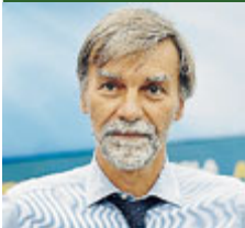
Graziano Delrio.