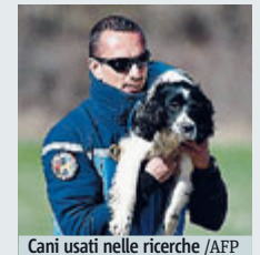
Cani usati nelle ricerche

FRANCIA È stata ritrovata la seconda scatola nera dell'aereo Germanwings con 150 persone a bordo fatto precipitare dal copilota sulle Alpi francesi il 24 marzo. Si spera di ricavarne dati utilizzabili. Intanto gli inquirenti tedeschi hanno reso noto che Andreas Lubitz aveva fatto ricerche sul web sui metodi per suicidarsi e sui dettagli del sistema di sicurezza della porta della cabina di pilotaggio dell'Airbus. Decade così l'ipotesi di un raptus improvviso.