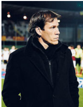
A sinistra Rudi Garcia allenatore della Roma e Rafa Benitez tecnico del Napoli.

CALCIO È scontro diretto per la Champions League. Roma e Napoli si affrontano domani all'Olimpico (ore 12.30, diretta Sky Calcio) e la vittoria di una delle due squadre potrebbe avere un peso importante per l'esito finale. Se dovessero vincere i giallorossi, la distanza con i napoletani aumenterebbe a più 9 punti, mentre con la Lazio (lontana solo 1 punto) potrebbe rimanere invariata, se i biancazzurri dovessero battere il Cagliari. Ma queste sono ipotesi. La realtà dice che la Roma, che non vince in casa dallo scorso 30 novembre, è ancora in emergenza. Gervinho, infortunatosi con la maglia della Costa d'Avorio, ne avrà per almeno 3 settimane. Totti continua a svolgere lavoro differenziato e solo dopo la rifinitura di questa sera, si saprà se sarà convocato o meno. Doumbia lavora