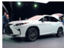
La nuova Lexus RX.