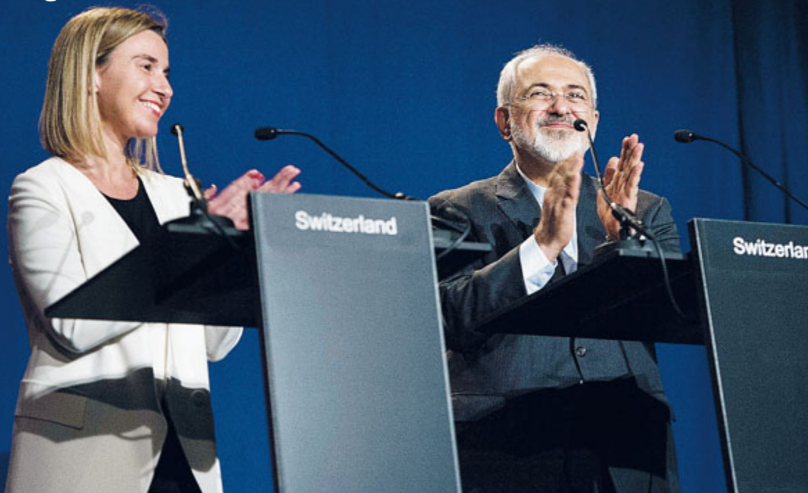
La rappresentante europea degli Affari Esteri Federica Mogherini e il ministro degli esteri iraniano Javad Zarif applaudono dopo l'annuncio dell'accordo

Mogherini annuncia l'accordo storico sul nucleare iraniano FATTI E STORIE