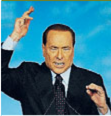
Silvio Berlusconi.