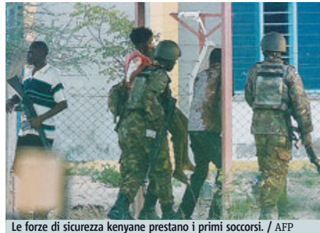
Le forze di sicurezza keniane prestano i primi soccorsi.