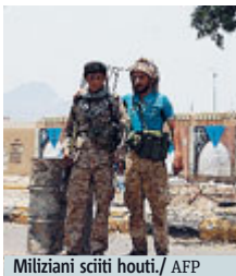
Miliziani sciiti houthi.

YEMEN Combattimenti nella città protuale di Aden, nel sud dello Yemen, dove avanzano i ribelli sciiti. Almeno quaranta le vittime ieri, ma è giallo sullo sbarco di militari per controllare una zona del porto. Secondo alcune voci sarebbero egiziani, il primo intervento terrestre di un Paese arabo sul suolo yemenita, dopo che Egitto e Arabia Saudita stanno già agendo militarmente con aerei e navi a sostegno del governo scacciato dalla capitale Sanaa. Intanto al nord negli