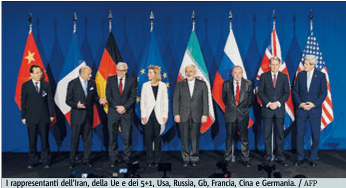
I rappresentanti dell'Iran, della Ue e dei 5+1, Usa, Russia, Gb, Francia, Cina e Germania.

pervisione dell'Aiea (l'agenzia Onu per l'energia nucleare) e il ritiro delle sanzioni internazionali a Teheran. Ma si configura come un accordo quadro che dovrà poi essere definito entro giugno. «Il lavoro non è finito», ha detto il