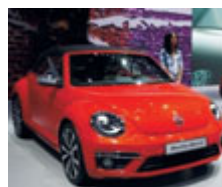
Vw Maggolino concept.