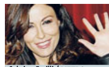
Sabrina Ferilli

TV Un'edizione all star per il serale di “Amici” di Maria De Filippi, da sabato 11 aprile nel prime time di Canale 5, con un cast in cui figurano, in giuria, la confermata Sabrina Ferilli con Francesco Renga e una staffetta tra Renato Zero (previsto per ora nella prima puntata «e poi si vedrà», dice la conduttrice) e Loredana Berté. A capo delle squadre bianca e blu in cui sono divisi i 12 talenti in gara, Emma e Elisa. Alla direzione artistica dello show Giuliano