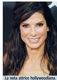
La nota attrice hollywoodiana.