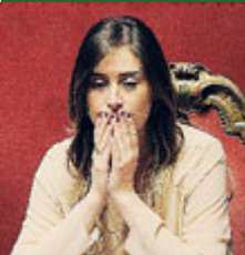
Maria Elena Boschi