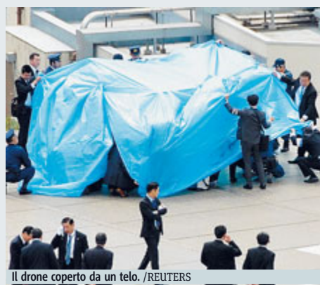
Il drone coperto da un telo.

trasportava una piccola macchina fotografica e una bottiglia d'acqua. Abe è partito per l'Indonesia per un summit Asia-Africa e non c'era nel suo ufficio quando è avvenuto l'incidente. La polizia ha avviato un'indagine sulla vicenda, che pone comunque interrogativi sulla sicurezza. Per gli investigatori, «un gesto dimostrativo». METRO