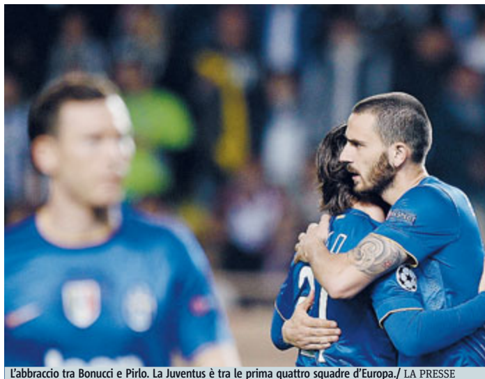
L'abbraccio tra Bonucci e Pirlo. La Juventus è tra le prime quattro squadre d'Europa.

CALCIO Dodici anni dopo, la Juventus torna tra le migliori quattro squadre d'Europa. A Montecarlo è bastato lo 0-0 per festeggiare il passaggio del turno: decisivo insomma il successo dell'andata, il gol su rigore di Vidal contestato dai francesi. Francesi che anche ieri sera hanno recriminato per un sandwich di cui si sono resi protagonisti nel primo tempo lo stesso cileno e Chiellini nei confronti di Bernardo Silva: l'arbitro Collum però non se l'è sentita di fischiare la massima punizione e la Signora ha ringraziato. Senza giocare una grande partita. L'attacco del Monaco ne azzeccava poche, Berbatov era il fantasma scarso del giocatore che fu, Martial troppo acerbo per reggere il peso di una partita del genere. Così, nel finale era Pirlo a sfiorare la rete con la solita punizione "maledetta". «Tanta tensione - ha ammesso Buffon, il solo superstite della semifinale 2003-04 - però abbiamo riportato la Juve dove merita. È stato un percorso lungo, ma ne è valsa la pena. Fermo restando che non abbiamo ancora vinto nulla». DOMENICO LATAGLIATA