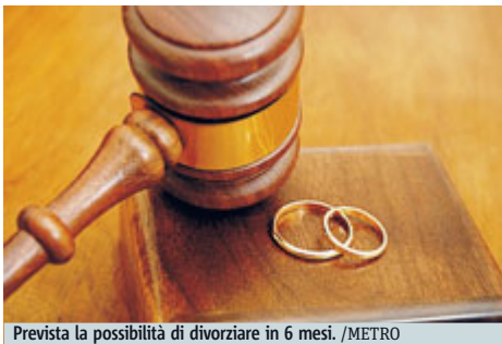
Prevista la possibilità di divorziare in 6 mesi.

ROMA Il divorzio breve è legge. L'ok della Camera alla proposta di legge (presente in agenda parlamentare dal 2003) arriva in un clima di sostanziale distensione politica. Già approvato dalla Camera il 29 maggio 2014, il provvedimento - che consta di tre articoli - è tornato ieri all'esame della Camera con le modifiche introdotte dal Senato, che ha approvato il testo, con modificazioni, il 18 marzo 2015. Stralciata la parte che conteneva il divorzio immediato.