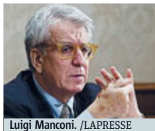
Luigi Manconi.

ROMA Il senatore Luigi Manconi (Pd) è membro della Commissione Difesa e anche presidente della Commissione straordinaria per la tutela dei diritti umani. Su un punto è in disaccordo con Renzi: «Concentrare la gran parte delle dichiarazioni e delle richieste, delle iniziative e delle strategie sulla figura del trafficante di esseri umani, rischia di risultare un equivoco pericoloso».