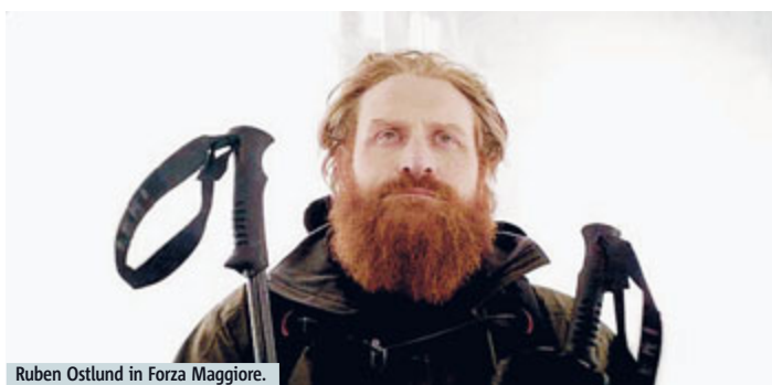
Ruben Ostlund in Forza Maggiore.