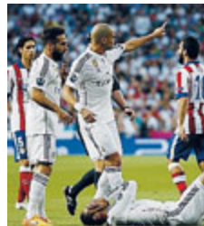
Bolgia a Madrid.

quando, al 30' del secondo tempo, è stato espulso Turan dopo fallo su Ramos (che accentua). I colchoneros rimangono in 10. E le merengues affondano i colpi sulla porta di Oblak. Al 43' del secondo tempo, a due minuti dalla fine, Hernandez tocca in scivolata dopo un'azione di Ronaldo. È gol. Il Real per la quinta volta consecutiva è in semifinale. METRO