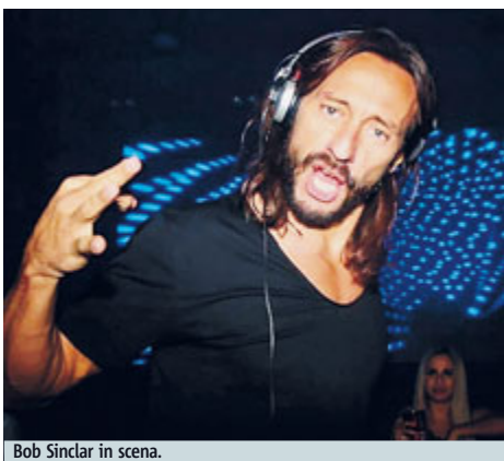
Bob Sinclar in scena.

Nel campo della dance Sinclar è un'istituzione assoluta, autore di tantissime hit e con alle