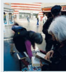
Lo scambio. /OMNIROMA

venerdì, ma che a ridosso dello sciopero erano del tutto impreparati. Inoltre, secondo l'inchiesta, ci sarebbero inadempienze gravi da parte del responsabile della linea, del coordinatore, dell'assistente, di 5 addetti alla direzione centrale traffico (Dct) e da parte di un macchinista che quella mattina ha abbandonato un convoglio sulla banchina, nonostante la folla di utenti. Ed è giallo sulla comunicazione sparita tra la Dct e un macchinista nel panico per l'assedio dei passeggeri, al quale è stato ordinato via radio di evacuare un convoglio pieno. Sparizione che non dovrebbe impedire di risalire a chi imparti quell'ordine. METRO