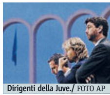
Dirigenti della Juve.