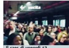
Il caos di venerdì 17.

La Commissione Atac: i presunti responsabili del venerdì nero sulla linea A rischiano il posto. Giallo sulle comunicazioni sparite