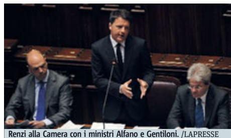
Renzi alla Camera con i ministri Alfano e Gentiloni.

«Credo che un intervento dell'Onu in questo momento sia essenziale e doveroso», ha detto invece il ministro della Difesa italiano, Roberta Pinotti, spiegando che si lavora ad «un'operazione di polizia internazionale» e «le opzioni pratiche sono molte, i nostri stati maggiori le stanno studiando». Parlando alla Camera e al Senato il premier Renzi ha spiegato che oggi dirà «che non bisogna limitarsi a una reazione emotiva e