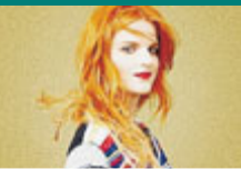
La cantante e autrice.