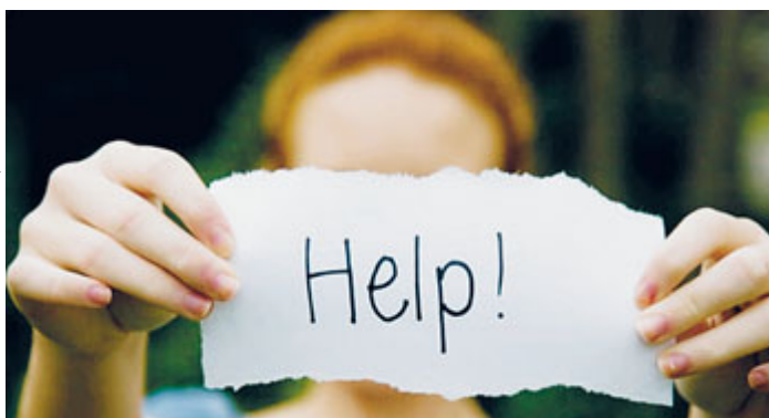
Per gli scienziati dell'Università di Kassell il depresso mostra un'iperattività in alcune aree del cervello.

È la psicoterapia l'arma più efficace contro il male oscuro. Lo dice un recente studio