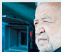
Il regista emiliano.