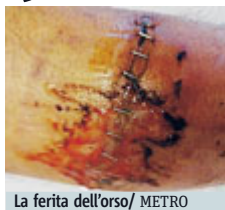
La ferita dell'orso / METRO

TRENTO Dicono che ce ne sono 50. Secondo altri 100. Non è dato da sapere il numero preciso; così come non è dato da sapere cosa potrà accadere in estate, quando le montagne si popoleranno di escursionisti, atleti, campi all'aperto di giovani e bambini.