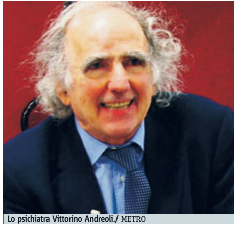
Lo psichiatra Vittorino Andreoli.

Sì, affligge i ragazzi che non vogliono crescere. Ma come spiego nel libro ci sono anche moltissimi