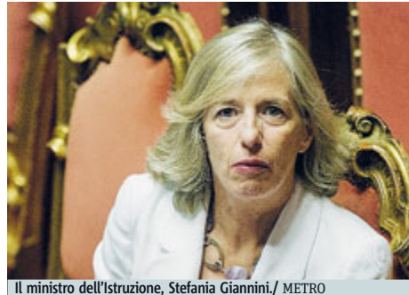
Il ministro dell'Istruzione, Stefania Giannini.

E ieri è stata una giornata piena di tensioni: infatti