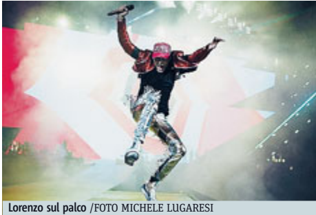
Lorenzo sul palco

MUSICA Tre sere con Jovanotti. Arriva a San Siro, da giovedì a sabato (ore 21, da euro 34.50), "Lorenzonegli stadi 2015". E sarà festa di ritmo, colori, suoni, tecnologia, emozione e divertimento. «Questo spettacolo è la mia idea di "rock'n'roll show" oggi. Rispetto al 2013 è un "action poetico" che punta dritto alla leggerezza, ha molto a che fare con la mia infanzia e con il senso di stupore e di coinvolgimento che si prova prima di confrontarsi con il mondo reale, quello delle furbizie e del retropensiero», spiega Lorenzo. Ed è lecito aspettarsi un live inedito e sorprendente sin dall'inizio, con un minifilm realizzato ad hoc