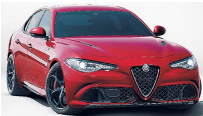
La nuova Giulia mette in campo il meglio della tradizione della Casa del Biscione /METRO

Il rinnovamento Alfa Romeo è coinciso col il nuovo logo del Biscione che debutta sulla Giulia. Un logo "modernizzato" ma che rimanda immediatamente alla gloriosa storia della Casa automobilistica. METRO