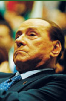
Silvio Berlusconi.