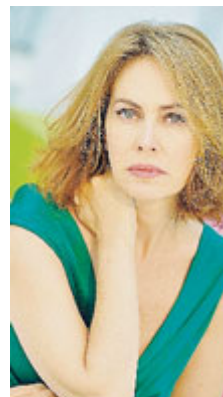
Elena Sofia Ricci nel ruolo di madre in "Noi sono Francesco".