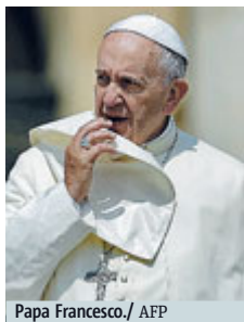
Papa Francesco.

bole o i figli piccoli alle ferite più gravi causate dalla prepotenza e dalla violenza, dall'avvilimento e dallo sfruttamento, dall'estraneità e dall'indifferenza». Ma il pensiero più intenso è dedicato ai bambini, e alle sofferenze che vengono loro provocate dalle divisioni dei genitori. «I bambini non diventi-