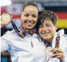
La Volpi e la Cipriani.