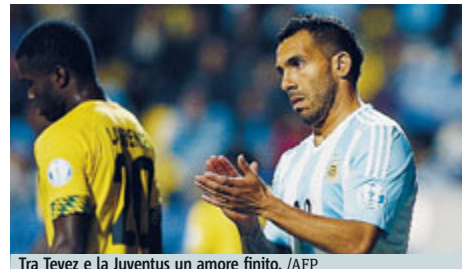
Tra Tevez e la Juventus un amore finito.