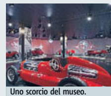
Uno scorcio del museo.

AUTO Inaugurato in occasione del lancio della nuova Giulia anche il nuovo Museo storico Alfa Romeo che sarà visitabile dal 30 giugno tutti i giorni tranne il martedì, dalle 10 alle 18 con prolungamento fino alle 22 il giovedì. Ben 69 i modelli esposti: tutti hanno