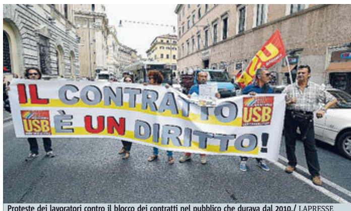
Proteste dei lavoratori contro il blocco dei contratti nel pubblico che durava dal 2010.

ROMA Anche se con la sentenza contro il blocco dei contratti non si creerà un buco di bilancio, il governo dovrà mettere mano al portafogli per avviare la stagione contrattuale subito come invocano tutte le sigle sindacali, da quelle che hanno promosso i