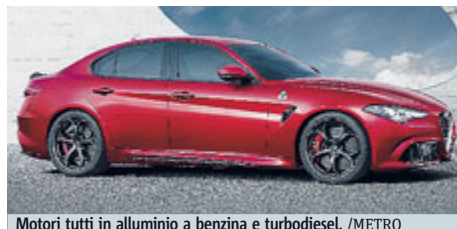
Motori tutti in alluminio a benzina e turbodiesel.

più rischiosa, quella di rimettere l'Alfa Romeo al centro di uno di quei settori dove a prevalere sono ormai da anni i marchi tedeschi, da Audi a BMW e fino a Mercedes. Per farlo la nuova Giulia mette in campo il meglio della tradizione della Casa del Biscione, dalla trazione posteriore o integrale, allo stile "made in Italy" dai motori tutti in alluminio a benzina e turbodiesel e alle prestazioni all'altezza se non superiori a quelli dei più blasonati concorrenti. L'esemplare del-