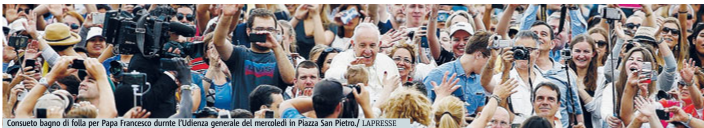
Consuetudine di folla per Papa Francesco durante l'Udienza generale del mercoledì in Piazza San Pietro.