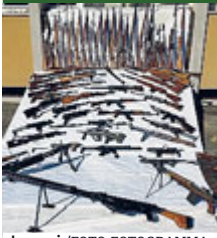
Le armi