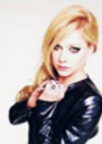
Avril Lavigne.