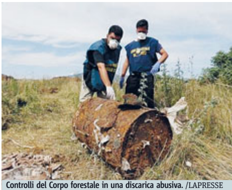
Controlli del Corpo forestale in una discarica abusiva.

ROMA Ben 29.293 reati accertati, circa 80 al giorno, per un fatturato criminale che è cresciuto di 7 miliardi rispetto all'anno precedente raggiungendo i 22 miliardi (di cui oltre 4,3 nel settore agroalimentare). È un bilancio pesante quello evidenziato dal rapporto Ecomafia di Legambiente. Dal dossier emerge la crescita dell'incidenza criminale nelle quattro Regioni a tradizionale presenza mafiosa (Puglia, Sicilia, Campania e Calabria), dove si è regi-