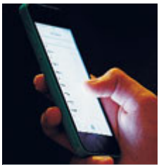
Stessi costi in Ue

UE Il "roaming", le tariffe telefoniche maggiorate all'estero, sarà abolito in tutti i 28 Paesi dell'Unione europea a partire dal 15 giugno 2017. Dopo un lungo iter la proposta l'accordo è stato raggiunto nella scorsa notte, al termine di 12 lunghe ore di negoziato fra Commissione, Parlamento e Consiglio. Già a partire da aprile 2016 le spese aggiuntive che si pagheranno all'estero per la telefonia mobile saranno ridotte. Oltre all'attesa fine del roaming, verranno fissate re-