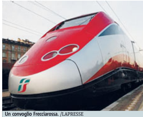
Un convoglio Frecciarossa.

Da oggi obbligatorio prenotare il posto sui treni AV Dal 15 luglio scattano le multe