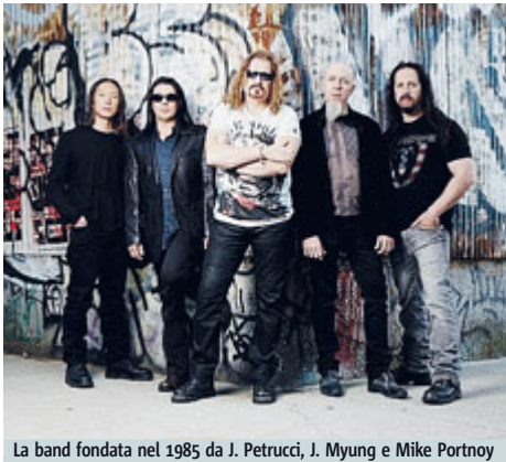
La band fondata nel 1985 da J. Petrucci, J. Myung e Mike Portnoy

CONCERTI Una delle realtà storiche del metal-progressive stasera dalle 21,45 alla cavea del Parco della Musica. Ospiti per la prima volta della rassegna Luglio Suona Bene sono i Dream Theater, band fondata a Boston nel 1985 da John Petrucci, John Myung e Mike Portnoy, che nel giro di pochissimi anni ha conquistato l'attenzione delle grandi platee internazionali. L'anno della svol-