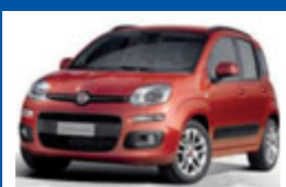
Fiat Panda 1.2 Easy E 6

CON FINANZIAMENTO TASSO DEL 2,95 + SERVIZI