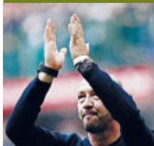
Walter Zenga.