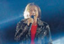
La rocker toscana.