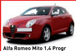
Alfa Romeo Mito 1.4 Progr