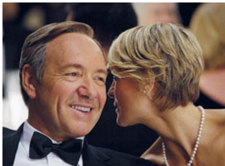
Robin Wright e Kevin Spacey in una scena di "House of Cards", la serie che ha fatto conoscere Netflix nel mondo.