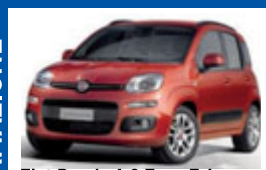
Fiat Panda 1.2 Easy E 6