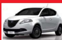
Lancia Ypsilon Gold 1.2

CON FINANZIAMENTO TASSO DEL 2,95 + SERVIZI