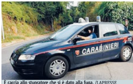
È caccia allo stupratore che si è dato alla fuga.

CITTÀ Si è finto poliziotto per abusare di una 16enne in un parcheggio nei pressi degli uffici giudiziari di piazzale Clodio. Intorno alla mezzanotte di lunedì la minore era con due amiche alla fermata dell'autobus e stavano tornando a casa dopo aver assistito allo spettacolo pirotecnico di Castel Sant'Angelo. L'uomo, mostrando un tesserino, ha detto di essere un agente ed ha chiesto di vedere i documenti delle ragazze. Alla giovane che ne era in possesso ha intimato di seguirlo con la scusa di una verifica. Magiunta