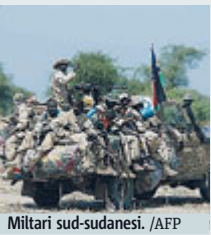
Militari sud-sudanesi.

SUD SUDAN Le Nazioni unite hanno accusato le forze del governo del Sud Sudan e i loro alleati di avere abusato sessualmente di donne e bambine e di averne bruciate vive alcune nelle loro abitazioni durante gli ultimi scontri avvenuti nel Paese. La denuncia della missione Onu si basa sulle testimonianze di 115 persone residenti nel distretto di Unità, in cui ad aprile le forze del governo hanno lanciato un'offensiva contro i ribelli in