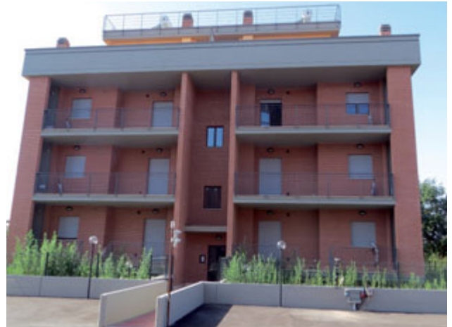
IMMAGINE IMMOBILIARE S.R.L. tel. 06/20434064 - cell. 339/3162251

Paghi l'affitto di soli € 400,00 mensili, e se vuoi diventi proprietario continuando a pagare la stessa rata!!! Ti affittiamo un bellissimo appartamento di soggiorno camera servizi giardino o terrazzo con posto auto nelle adiacenze del Centro Commerciale di Roma Est e della Fermata FS Lunghezza