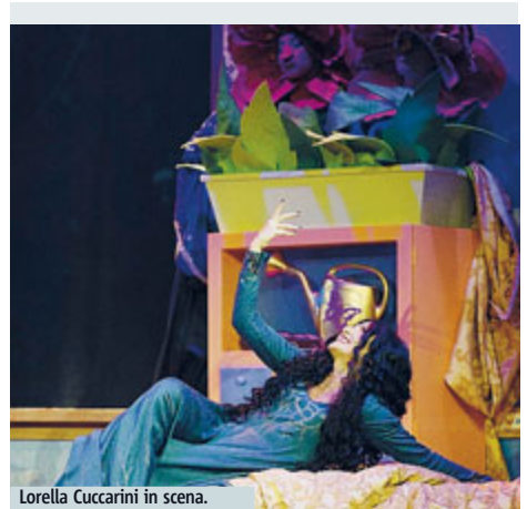
Lorella Cuccarini in scena.