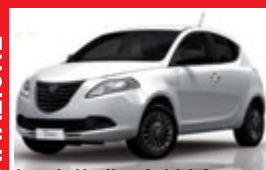
Lancia Ypsilon Gold 1.2