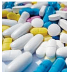
Medicinali online. /WEB

UE Con un marchio di garanzia, da oggi in Europa possono aprire i battenti anche le farmacie online. Entra in vigore il regolamento Ue che permette di vendere online medicine provenienti da siti di farmacie che esistono e che espongono il logo comune europeo, approvato dalla Commissione. In Italia un decreto fisserà un logo identificativo nazionale per identificare le farmacie online legali, dotate dell'autorizzazione all'e-commerce. Il logo incorporerà il link alla lista