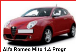
Alfa Romeo Mito 1.4 Progr