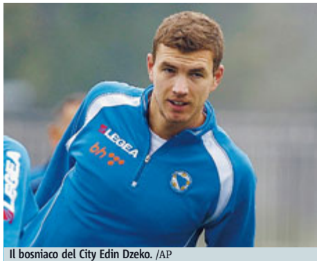
Il bosniaco del City Edin Dzeko.

Sembrava fatta per il bosniaco ma il mercato è bizzarro Sfumato Imbula il Mancio chiama Jovetic