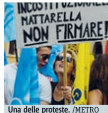
Una delle proteste.

territoriale. Slitta invece all'anno scolastico 2016/2017 la contestata "chiamata diretta" da parte dei presidi dei nuovi assunti. Plauso infine dal 118 all'inserimento dell'obbligo di insegnamento del primo soccorso: «Uno straordinario primato di civiltà». METRO