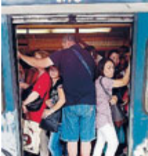
I disagi in metro.