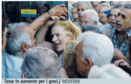
Tasse in aumento per i greci.

entrate dello Stato (le misure inizialmente previste e bocciate valevano 8 miliardi). Lo rivela il quotidiano economico greco Naftemporiki, secondo cui sarà questa la carta che Tsipras presenterà ai creditori. Per Naftemporiki, ci sarebbe anche il dettaglio di alcuni interventi: la tassazione per le aziende salirebbe dal 26 al 28%, l'I-