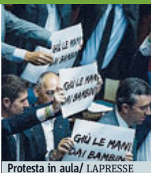
Protesta in aula

Approvata tra le contestazioni la "Buona scuola". A settembre 47mila assunzioni FATTI E STORIE