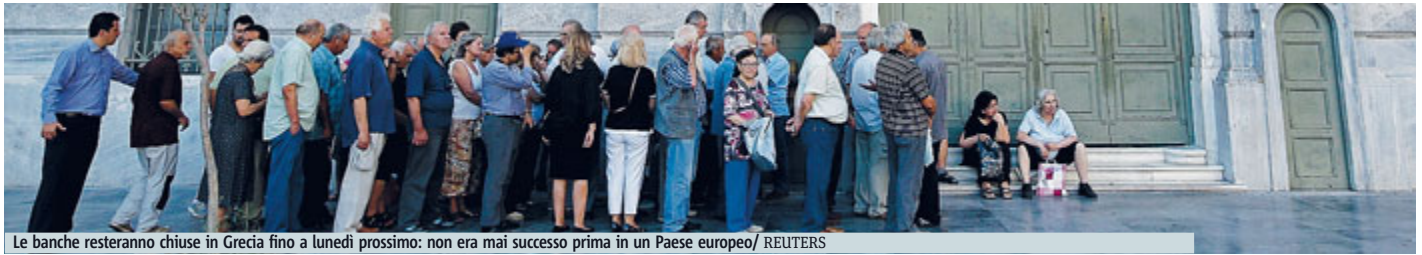
Le banche resteranno chiuse in Grecia fino a lunedì prossimo: non era mai successo prima in un Paese europeo