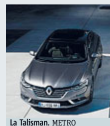
La Talisman. METRO

AUTO Prosegue l'offensiva Renault: l'ultima in ordine di tempo è la berlina Talisman. Arriverà in Francia a fine anno e negli altri mercati europei a inizio del 2016. Avrà cinque motori, due a benzina, l'Energy TCe 150 e l'Energy TCe 200 abbinati esclusivamente con il cambio automati-