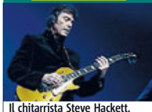
Il chitarrista Steve Hackett.