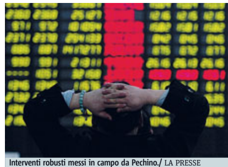
Interventi robusti messi in campo da Pechino.

lo che appare come il maggior balzo giornaliero dal 2009 (con recuperi, prima della chiusura, superiori al 7%). Tra le iniziative decise da Pechino che hanno invertito la tendenza dopo la debacle di ieri, il divieto ai grandi azionisti (5% della capitalizzazione) agli amministratori delegati delle società quotate di vendere i propri titoli per sei mesi (l'iniziativa punta «a mantenere la stabilità dei mercati dei capitali e proteggere i diritti