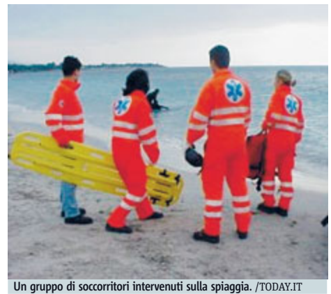
Un gruppo di soccorritori intervenuti sulla spiaggia.