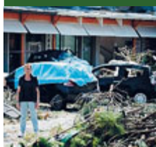
Conta dei danni.