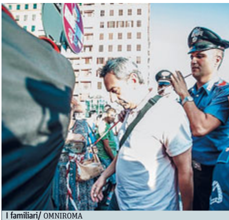
I familiari

sori di quella stazione sono spesso fuori uso, anche se i guasti sono sempre segnalati. Due ore dopo l'incidente, avvisato con tutto il tatto possibile