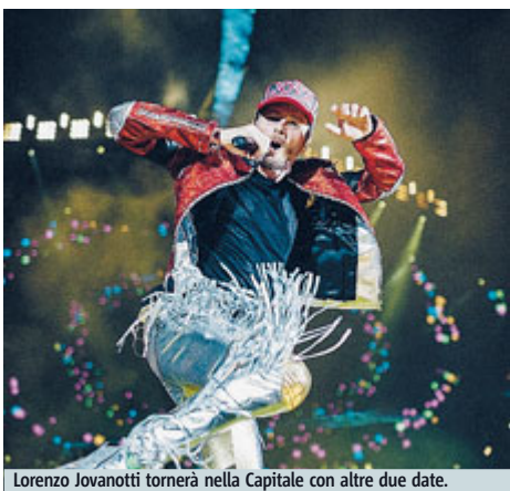
Lorenzo Jovanotti tornerà nella Capitale con altre due date.

CONCERTI Il caleidoscopio musicale di un grande protagonista della musica italiana domenica, dalle 21, sul palco dello Stadio Olimpico (da giorni tutto esaurito). Nella Capitale fa tappa il tour di Jovanotti, cantautore e rapper di Cortona, capace dagli Anni '80 a oggi di mettere a punto un linguaggio molto personale e immediatamente riconoscibile. Partito da brani dance e poco impegnati come fra gli al-