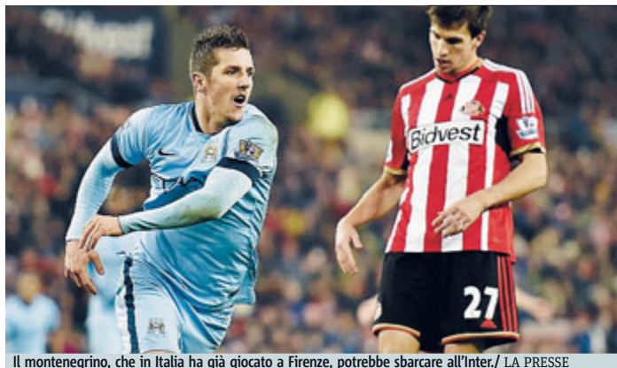
Il montenegrino, che in Italia ha già giocato a Firenze, potrebbe sbarcare all'Inter.

CALCIO Le grandi si muovono. E, se (quasi) tutte le rose fioriranno, parecchi tifosi sogneranno. Intanto, le milanesi: l'Inter è a un passo da Persic (Wolfsburg), grazie al fatto che Shaqiri potrebbe accettare la proposta dello Schalke 04. Fassone ha poi spiegato di «essere alla finestra per Salah, ma non siamo stati scorretti»: tanti saluti alla Fiorentina, ecco. Ma attenti: l'Inter avrebbe anche l'intesa con Jovetic per un quadriennale: al Manchester City (che non ha ancora accettato) sono stati offerti 20 milioni. L'agente del giocatore ieri sera è sbarcato a Milano. Dal canto suo il Milan non pensa solo alla difesa (Romagnoli) ma anche al centrocampio, dove c'è un ritorno di fiamma per Witsel (Zenit): Galliani ha pronti 20 milioni, i russi ne vogliono 30 ma c'è margine. Poi, il