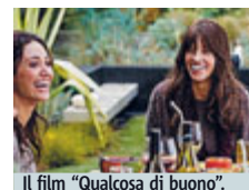
Il film "Qualcosa di buono".

CINEMA Hilary e la malattia. L'indimenticabile protagonista di "Boys Don't Cry" e di "Million Dollar Baby", due Oscar di fila, arriva al cinema dal 27 agosto a raccontarci come si affronta la malattia in un periodo in cui ha sposato il suo lavoro di attrice per accudire il padre malato di tumore perché «la vita fugge e la famiglia va amata». Arriva con "Qualcosa di buono", tratto dall'omonimo romanzo di Michelle Wildgen. Il film è centrato sulla malattia ma soprattutto sul rapporto tra due donne: una sorta di "Quasi Amici" al femminile che la Swank ha voluto interpretare e di cui ha anche comprato i diritti.