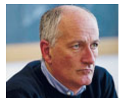
Non deve avvenire

“Ci dobbiamo interrogare su come sia possibile che questo genere di cose accadano”.