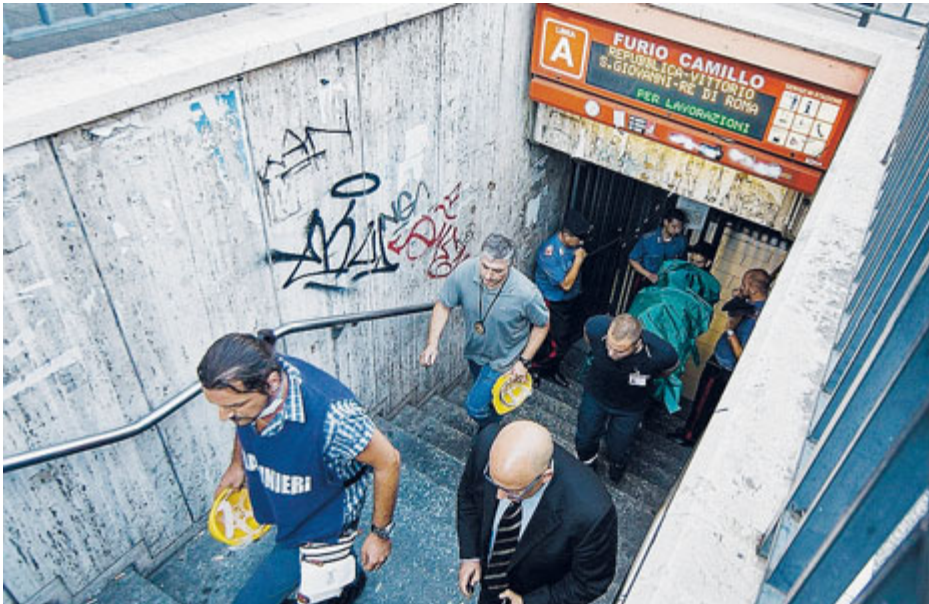
L'indagine della procura dovrà accertare se la procedura applicata dall'addetto alla sicurezza fosse conforme.

Sta di fatto che nel passaggio tra un ascensore e l'altro Marco è caduto nel vuoto, forse spaventato. I soccorsi sono stati immediati, ma non c'è stato nulla da fare. La tragedia davanti agli occhi della madre. E proprio con la madre si è intrattenuto per oltre due ore il sindaco di Roma, Ignazio Marino, che è stato contestato dai cittadini che si erano affollati davanti alla stazione. In molti hanno raccontato che gli ascen-