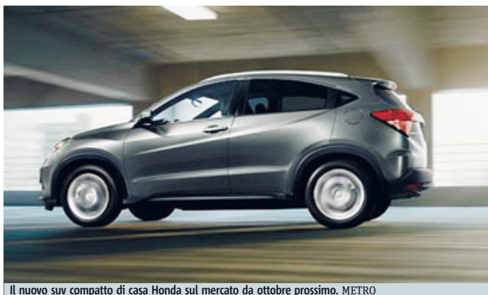
Il nuovo suv compatto di casa Honda sul mercato da ottobre prossimo. METRO

Debutto importante per Skoda: la nuova Superb si presenta anche in versione Wagon e dopo l'anteprima mondiale al Salone di Francoforte (19-27 settembre) sarà commercializzata in Italia dalla fine dello stesso mese. c.c.