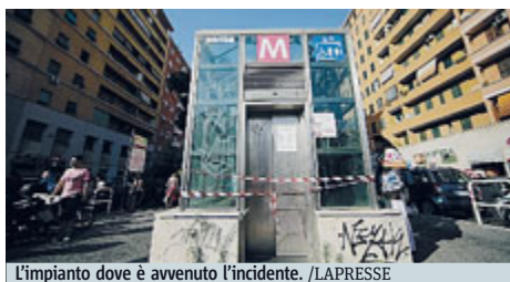
L'impianto dove è avvenuto l'incidente.

La tragedia davanti agli occhi della madre. L'elevatore era bloccato con alcuni passeggeri dentro. Errore umano l'ipotesi privilegiata