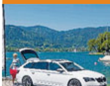
La nuova Wagon. METRO