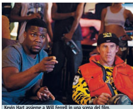
Kevin Hart assieme a Will Ferrell in una scena del film.

Siamo in "Duri si diventa" (appena uscito nei nostri cinema), firmato da Ethan Cohen (che nulla ha a che vedere col mi-