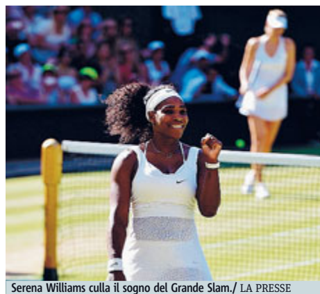
Serena Williams culla il sogno del Grande Slam.

torneo, alla prima finale in carriera in un major, che oggi ha sconfitto al terzo set (6-2 3-6 6-3) la polacca Agnieszka Radwanska. Oggi intanto l'attenzione è tutta per il tabellone maschile: dalle 14 giocheranno infatti Novak Djokovic contro Richard Gasquet ed a seguire Roger Federer contro l'idolo di casa Andy Murray. METRO