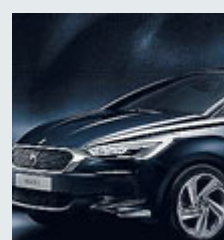
L'ammiraglia Citroën. METRO

AUTO Citroën svela la nuova DS5, ammiraglia che si propone come vettura alto di gamma, in vendita con prezzi compresi tra 30.900 e 47.250 euro. La versione Hybrid sarà in listino a 40.900 euro. Sarà immatricolata in 5 mila unità in Italia entro fine anno. L'offerta a benzina è limitata al