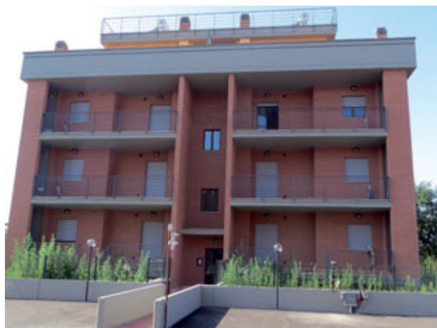
IMMAGINE IMMOBILIARE S.R.L. tel. 06/20434064 - cell. 339/3162251