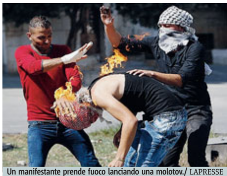
Un manifestante prende fuoco lanciando una molotov.

Cosa sta succedendo? Siamo di fronte al risultato della perdita di centralità della questione nell'attenzione del mondo. I conflitti non si parcheggiano, come invece si è pensato di fare in attesa di tempi migliori. Là dove