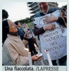
Una fiaccolata.

ROMA I cristiani sono il gruppo religioso maggiormente perseguitato e la loro condizione continua a peggiorare in molti dei Paesi in cui affrontano da tempo gravi limitazioni. Emerge dal rapporto “Perseguitati e Dimenticati”, presentato dalla Fondazione pontificia Aiuto alla Chiesa che Soffre. In 17 dei 22 Paesi in cui sono perseguitati la condizione dei cristiani si è aggravata tra l'ottobre 2013 e il giugno 2015. Tra le nazioni