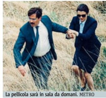
La pellicola sarà in sala da domani.