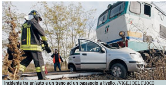
Incidente tra un'auto e un treno ad un passaggio a livello.

• Roma. Dal 2011 la circolazione dei treni deve essere completamente interrotta in presenza di un cantiere di lavoro sul binario interessato e su quelli adiacenti, a meno che il confine tra area interessata e binari in esercizio non sia chiaramente individuato e reso percepibile. L'Ansf ha chiesto a Rfi maggiori garanzie.