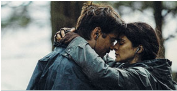
Colin Farrell e Rachel Weisz in una scena del film.

Il Festival di Sanremo, che vedrà Carlo Conti nella doppia veste di conduttore e direttore artistico, si terrà dal 9 al 13 febbraio 2016. Il 27 novembre saranno invece scelti in diretta tv i 6 giovani che con i 2 vincitori di Area Sanremo arriveranno all'Ariston.