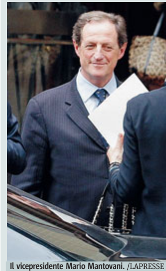
Il vicepresidente Mario Mantovani.