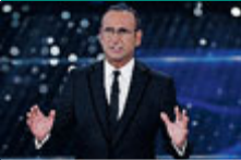
Carlo Conti.