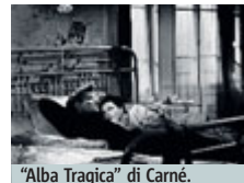
"Alba Tragica" di Carné.

CINEMA Un appuntamento con la Settima Arte adatto a tutti i gusti. Stasera sugli schermi del cinema Massimo spazio a tre imperdibili pellicole. Si parte alle 18 con "Alba Tragica", capolavoro di Marcel Carné sceneggiato da Jacques Prévert, che inaugura la nuova stagione di "Histoire(s) du cinéma", mentre alle 20.30, per "Crossroads", rendez-vous con "Arcade Fire. The Refle-