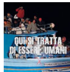
La campagna.

ROMA Non sanno a cosa vanno incontro, spesso non sono in grado di nuotare e non conoscono il deserto; ma nonostante questo partono, spinti da necessità economiche. È questa la fotografia dei potenziali migranti scattata dal primo Rapporto sulle migrazioni dall'Africa Sub-sahariana, elaborato da Missioni Don Bosco e VIS (Volontariato internazionale per lo sviluppo) e che ha spinto a dare vita alla campagna “Stop Tratta - Qui si tratta di esseri umani” (www.stoptratta.org). L'obiettivo è contrastare il traffico di esseri umani sensibilizzando sui rischi del viaggio verso l'Europa e offrendo progetti di sviluppo nei paesi di origine. GAIA ROMANI