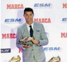
Ronaldo.