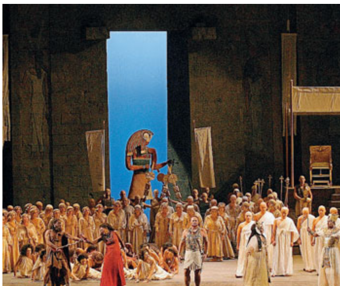
Una scena dell'Aida da questa sera in scena sul palco del Teatro Regio

Diretta dal Maestro Gianandrea Noseda, l'opera in quattro atti, commissionata al genio bussetano per l'inaugurazione del nuovo teatro del Cairo nel 1871, sarà allestita in maniera fastosa e spettacolare dal regista premio Oscar William Friedkin, cineasta di fama internazionale per pellicole come "Il braccio violento della legge" e "L'esorcista". Sul palco l'attenzione sarà tutta