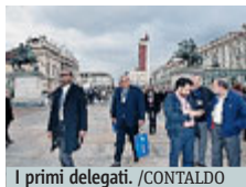
I primi delegati. /CONTALDO

Forum mondiale sullo sviluppo economico, 4 giorni di confronto su cibo, risorse, energia Atteso Ban Ki-moon