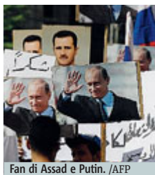
Fan di Assad e Putin.

Ieri due razzi hanno colpito l'ambasciata russa a Damasco. L'attacco è avvenuto mentre 300 persone si erano radunate davanti alla rappresentanza diplomatica nel quartiere di Mazraa per esprimere il loro sostegno ai raid aerei