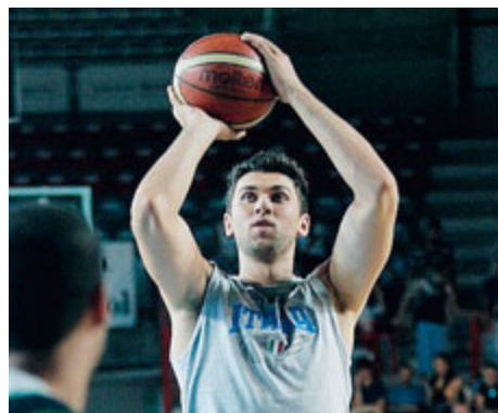
All'ala classe 1985 offerto un contratto triennale.

giocatore abbia rifiutato un'offerta dalla Turchia e un'altra dalla Grecia: segnali chiari rispetto al gradimento per l'Olimpia. Bargnani ha iniziato ad allenarsi a Roma. Mercoledì i primi tiri al PalaAvenali, seguito da Marco Calvani e Francesco Cuzzolin. Nessun allenamento con l'Eurobasket dell'ex playmaker azzurro Davide Bonora. Almeno per il momento. CARLO PASSARELLO