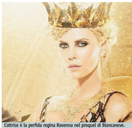
L’attrice è la perfida regina Ravenna nel prequel di Biancaneve .

Lei crede che le favole possano influenzare i bambini di oggi? Ogni fiaba ha un fondamento nella realtà, realtà che trascendono il tempo, per questo ritengo che le favole siano storie che ancora oggi, sicuramente, possono insegnare valori