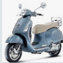
La mitica Vespa.

MOTO La Vespa, festeggia quest'anno i 70 anni. Il compleanno verrà celebrato il 23 aprile: in quel giorno del lontano 1946, infatti, fu depositato a Firenze il brevetto della nuova moto. Da allora la Vespa contribuì a rimettere in moto l'Italia uscita dalla guerra ma, poi, prodotta dall'India al