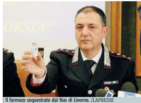
Il farmaco sequestrato dai Nas di Livorno.

LIVORNO Avrebbe ucciso 13 persone tra il 2014 e il 2015 attraverso un'iniezione letale a base di anticoagulante non prescritto nelle terapie. Questa l'accusa per un'infermiera professionale dell'ospedale di Piombino arrestata dai carabinieri del Nas di Livorno. La donna è ritenuta responsabile del reato di omicidio volontario continuato aggravato nei confronti di 13 pazienti tutti ricoverati, a vario titolo e per diverse patologie, presso l'unità operativa di anestesia e rianimazione dell'ospedale civile di Piombino. L'infermiera avrebbe somministrato come iniezione letale, non per fini terapeutici, un farmaco anticoagulante, nello specifico eparina, tanto da determinare, secondo gli investigatori - una rapida, diffusa ed irreversibile emorragia con conseguente morte. La presenza di questo farmaco è stata riscontrata negli esami ematochimici effettuati sui pazienti con una concentrazione, in alcuni casi, anche 10 volte superiore rispetto a quelle compatibili con le consen-