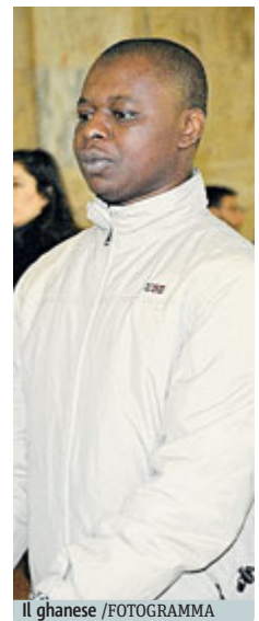
Il ghanese

Una perizia psichiatrica, firmata dallo psichiatra Ambrogio Pennati e dalla criminologa Isabella Merzagora, che aveva riconosciuto un vizio parziale di mente per il ghanese che soffre di "schizofrenia paranoide", ma aveva anche evidenziato che la sua capa-