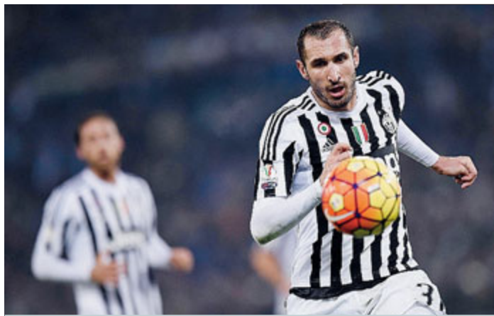
Chiellini ha recuperato dall'infortunio al polpaccio e sarà in campo domani contro l'Empoli.

Assenze pesanti per i bianconeri contro l'Empoli, tra squalifiche ed infortuni. Chiellini rientra, spazio a Rugani