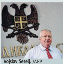
Vojislav Seselj.

OLANDA Il Tribunale penale internazionale dell'Aja ha assolto in primo grado l'ultranazionalista serbo Vojislav Seselj, dichiarandolo "non colpevole" per tutti i nove capi di imputazione, tra cui crimini di guerra e contro l'umanità, commessi ai danni delle popolazioni croata e musulmana tra il 1991 e il 1993, durante il conflitto in ex Jugoslavia. «La sentenza è vergognosa ed è una sconfitta per la Procura dell'Aja - ha com-