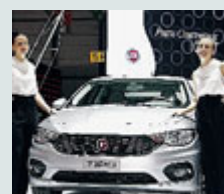
La nuova Tipo./ METRO

AUTO Dopo la berlina ora si possono ordinare le altre due varianti di carrozzeria della nuova Fiat Tipo: la 5 porte e la Station Wagon, da 15.900 euro (cinque porte) e da 17.300 (familiare). Due gli allestimenti, Easy e Lounge. L'Easy ha di serie il clima manuale, il sistema UConnect Radio con