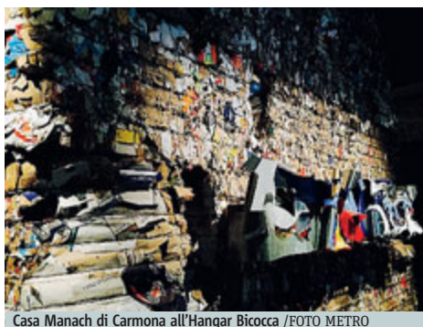
Casa Manach di Carmona all'Hangar Bicocca

Dopo quasi 20 anni torna l'Esposizione che si sviluppa in venti sedi su oltre 22 mila mtq e dura sei mesi