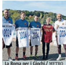
La Roma per i Giochi.