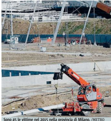
Sono 45 le vittime nel 2015 nella provincia di Milano.

Il dato peggiore si sviluppa nella provincia di Milano con 45 vittime tra gennaio e dicembre. In seconda posizione si attesta la provincia di Brescia con 30 morti bianche, seguita da quella di Pavia con 11 e da Mantova con