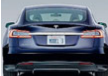
In Europa dal 2018./ METRO