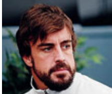
Fernando Alonso.