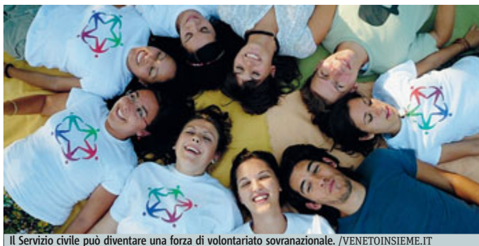
Il Servizio civile può diventare una forza di volontariato sovranazionale.

I tempi, però, non saranno immediati. Dopo l'ok di Palazzo Madama (con 146 sì, 74 contrari e 16 astenuti) il ddl di riforma del terzo settore deve infatti tornare alla Camera per il via libera finale (atteso entro l'estate). A quel punto il governo avrà un anno di tempo per approvare i decreti attuativi.