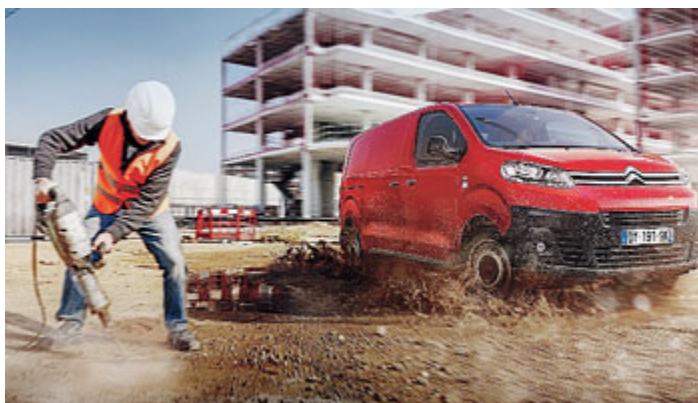
Veicolo commerciali leggeri: la versione Citroen Jumpy.

Arriva la prima Tesla per tutti. Si tratta della Model 3 che negli USA sarà in vendita dall'anno prossimo a 35.000 dollari (in Europa arriverà nel 2018). Progettata da un team di designers e ingegneri scelti da Elon Musk, Ceo di Tesla, è accreditata di un'autonomia di 320 km. METRO