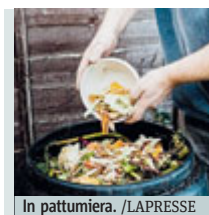
In pattumiera.

Italia Sociale per «sostenere la realizzazione e lo sviluppo di interventi innovativi da parte di enti di Terzo settore rivolti, in particolare, ai territori e ai soggetti più svantaggiati». «Una nuova mangiatoia - tuona il M5S, che ha votato contro il ddl - che potrà utilizzare soldi pubblici in modo del tutto arbitrario per finanziare attività private». METRO