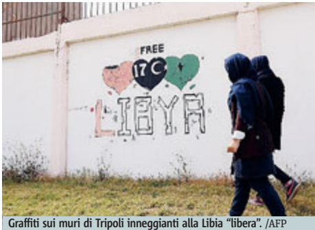
Graffiti sui muri di Tripoli inneggianti alla Libia "libera".

LIBIA A Tripoli resta alta la tensione, dopo l'arrivo del capo del governo di unità nazionale sostenuto dall'Onu e dall'Ue, nonostante le minacce del governo ribelle nella capitale. Le autorità non riconosciute insediates a Tripoli hanno chiesto al premier di lasciare la capitale: il capo del governo non riconosciuto dalla comunità internazionale, Khalifa Ghwell, ha minacciato il gabinetto di unità nazionale offrendogli solo due opzioni, abbandonare la capitale o essere arrestati. Ghwell ha tenuto la conferenza stampa in un'emittente satellitare che, poco dopo, è stata assalita da uomini armati ed è stata chiusa.