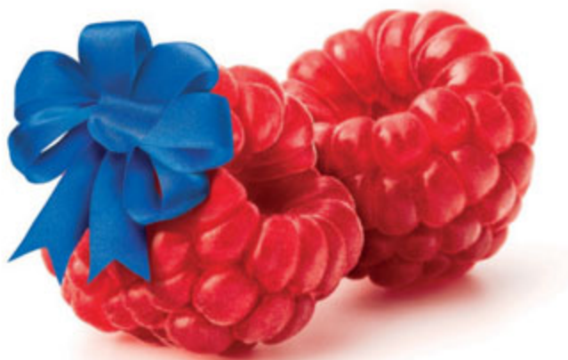
IMMAGINE A SCOPO ILLUSTRATIVO