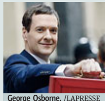
George Osborne.

GRAN BRETAGNA Aumenti delle tasse e tagli alla spesa sanitaria, militare e per l'istruzione. A pochi giorni dal referendum sulla permanenza di Londra nell'Ue, il ministro delle Finanze George Osborne sottolinea la ricadute della Brexit. «Uscire dall'Ue - ha detto - danneggerà gli investimenti, le famiglie e l'economia con un "buco" da 37,9 miliardi di euro nel-