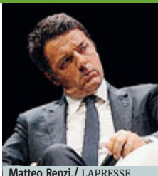
Matteo Renzi.

Sospensione e licenziamento rapidi per i dipendenti pubblici disonesti FATTI E STORIE