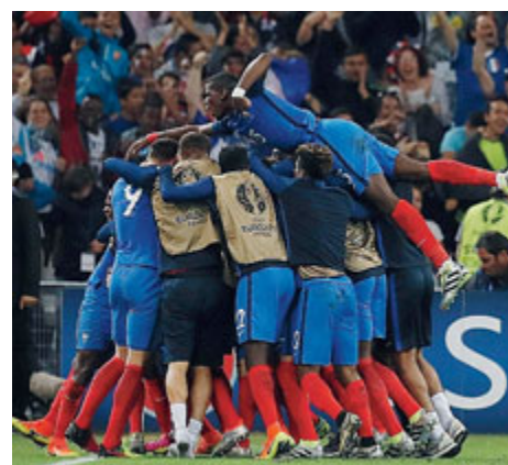
La gioia della Francia, che sblocca la gara al 90'

trenta minuti Giroud non ha ricevuto un solo pallone giocabile) li ha frettolosamente buttati nella mischia. E infatti, sulle ali della disperazione, i transalpini hanno cominciato a spingere nel secondo tempo. Al 69', col portiere albanese Berisha battuto, Giroud si avvitava in cielo ed il pallone si stampava sul palo. Il pubblico incitava, ansioso, mentre su ogni pallone francese si