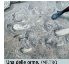
Una delle orme.

ERITREA Impronte umane fossili di ominidi vissuti 800 mila anni fa sono state portate alla luce in Eritrea. Potrebbero essere le prime orme attribuibili con certezza alla specie dell'Homo erectus. L'eccezionale scoperta è avvenuta durante l'ultima campagna di scavo coordinata dall'Università La Sapienza di Roma e dal National Museum of Eritrea nella regione della Dancalia. Il ritrovamento