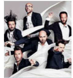
I Negramaro vincitori dell'Mtv Video Award

Alessandra Amoroso, Alessio Bernabei, Annalisa, Benji & Fede, Elisa, Emis Killa, Emma, Francesca Michielin, Lorenzo Fragola, Max Pezzali, The Kolors sono gli artisti che si esibiranno