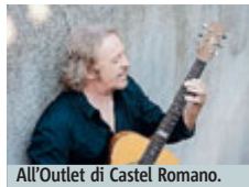
All'Outlet di Castel Romano.

MUSICA Da "Ti amo" a "Tu" passando per "Gloria" (portata al successo oltreoceano da Laura Branigan e nel 2014 colonna sonora del film di Scorsese The Wolf of Wall Street), "Stella Stai" e "Notte Rosa". Toccherà a Umberto Tozzi e ai suoi grandi successi aprire, domenica alle 21, il cartellone di #modamusic2016 al Castel Romano Designer Outlet, in piazza del Foro Romano. Il primo dei tanti live gratuiti vede protagonista un nome sto-