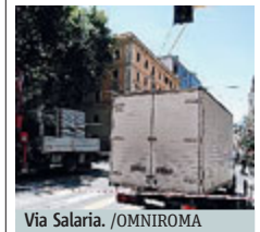
Via Salaria. /OMNIROMA

CITTÀ Un banale incidente ha mandato in tilt la circolazione ai paroli. Ieri mattina i tram sono stati costretti a fermarsi lungo la direttrice viale Regina Margherita-viale Liegi. Un mezzo pesante aveva infatti urtato i cavi di alimentazione della linea tranciandolo. Sul posto sono accorsi carabinieri e vigili del fuoco, che hanno transennato l'area dell'incrocio tra via Salaria e viale Liegi-Regina Margherita che è rimasta interdetta al traffico. Auto e bus sono stati deviati, le linee tram 3 e 19 hanno limitato la corsa fino alla fermata Galeno. Atac ha istituito delle navette sostitutive, ma la circolazione ha subito pesanti ripercussioni. La situazione è tornata alla normalità intorno alle 17. METRO