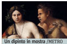
Un dipinto in mostra /METRO

MOSTRE Cinquecento anni dalle cavalcate dell'Orlando Furioso e una mostra-festa travolgente. Da oggi al 30 ottobre nella cornice di Villa d'Este a Tivoli una esposizione tutta dedicata a quello che "le donne, i cavalieri, le armi, gli amori, le cortesie..." di Ludovico Ariosto hanno prodotto nelle arti figurative. Ed ecco "I voli dell'Ariosto", dai dipinti alle sculture, dagli arazzi alle ceramiche, dai disegni alle inci-