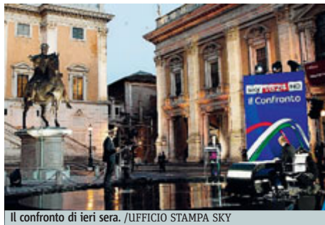
Il confronto di ieri sera.

Tra i temi affrontati buche, Olimpiadi, debito e Atac. Toni accesi e polemica sui nuovi autobus