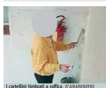
I cartellini timbrati a raffica. /CARABINIERI