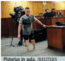
Pistorius in aula.

SUDAFRICA Si è spogliato, si è tolto le protesi e ha camminato sui moncherini delle gambe amputate quando aveva un anno per mostrare la sua disabilità e vulnerabilità al giudice. È la carta emozionale giocata dalla difesa dell'atleta paralimpico Oscar Pistorius durante l'udienza al processo per l'omicidio della sua fidanzata, Reeva Steenkamp. Il campione paralimpico rischia fino a 15 anni di car-