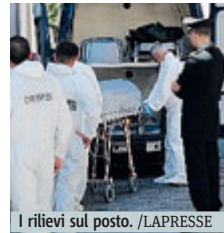
I rilievi sul posto.

di Nola e nel suo studio privato a Palma Campania. A dare l’allarme, chiamando il 118 e i carabinieri, è stato il fratello del medico che abita in un appartamento attiguo a quello in cui si è verificato l’omicidio-suicidio. I corpi dei due coniugi, che avevano due figli maggiorenni che non vivevano con loro, sono stati portati al II Policlinico di Napoli per l’esame autopsico disposto dal pm. Gli inquirenti stanno ascoltando parenti, vicini e amici della coppia per