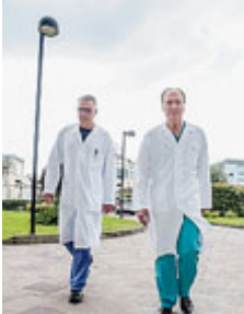
Zangrillo e Alfieri.