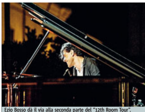
Ezio Bosso dà il via alla seconda parte del "12th Room Tour".

Il pianista, compositore e direttore d'orchestra sarà domenica live per "Luglio Suona Bene"