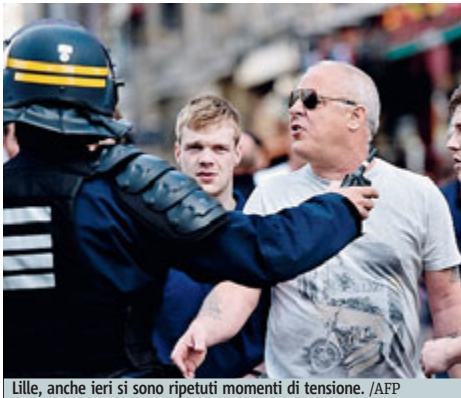
Lille, anche ieri si sono ripetuti momenti di tensione.

La cosa che non va giù a Mosca è che l'ambasciatore russo ed il consolato siano stati tenuti all'oscuro del-