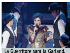
La Guerritore sarà la Garland.