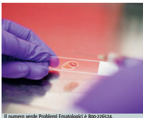
Il numero verde Problemi Ematologici è 800-226524.

SALUTE I progressi della ricerca scientifica e soprattutto la "medicina" più potente per renderli efficaci: l'attenzione concreta al mondo dei malati. Sono questi i pilastri su cui si fonda la Giornata Nazionale per la lotta contro leucemie, linfomi e mieloma giunta alla sua XI edizione. In programma il 21 giugno rappresenta un'occasione "sul campo" per parlare dei e ai pazienti ematologici, sia bambini che adulti. Attraverso incontri e iniziative di sensibilizzazione e raccolta fondi organizzate in tante città d'Italia, da nord a sud. A promuoverla l'Ail che punta all'informazione a 360 gradi sulla malattia per combatterla in maniera consapevole, con tutti gli strumenti disponibili. Per esempio una linea diretta con otto ematolo-