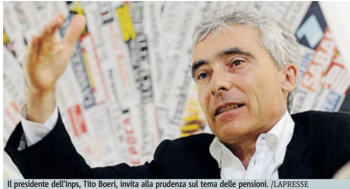
Il presidente dell’Inps, Tito Boeri, invita alla prudenza sul tema delle pensioni.

“I dettagli sono molto importanti”, mette in guardia il presidente dell’Inps in merito all’ipotesi del governo