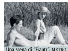
Una scena di “Frantz”.

CINEMA Quando la bugia serve alla verità. È il messaggio di Francois Ozon nel bellissimo “Frantz”, presentato alla scorsa Mostra veneziana, interpretato da Pierre Niney (vincitore due anni fa del César come miglior attore) e dalla giovanissima Paula Beer e dal 22 in sala. «In un'epoca ossessionata dalla verità e dalla trasparenza, volevo fare un film sulla menzogna - chiosa Ozon - ho sempre trovato le bugie molto eccitanti da raccontare e da filmare, e poi ho scoperto uno spettacolo teatrale di