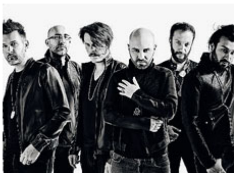
I Negramaro sabato in concerto al Parco Sempione di Milano.

Per il 15° compleanno di Samsung Italia la band salentina ha regalato un live gratuito ai milanesi