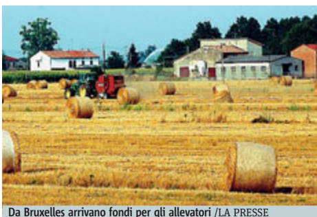
Da Bruxelles arrivano fondi per gli allevatori

FINANZIAMENTI Nuove risorse per il finanziamento dei contratti di filiera e di distretto e per i produttori di latte vaccino. Dopo i 240 milioni già stanziati tra 2014 e 2015, altri 200 milioni di euro sono stati assegnati al regime di aiuto per lo sviluppo di imprese agricole che appartengono alla stessa filiera o che operano nello stesso distretto produttivo. Mentre da Bruxelles arrivano 150 milioni di fondi Ue per gli allevatori.