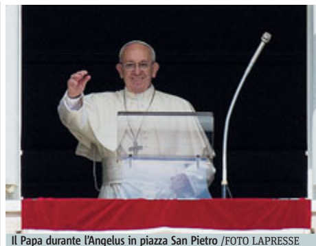
Il Papa durante l'Angelus in piazza San Pietro

cialdemocratici, in calo di cinque punti al 23. L'Afd col 12% entra nel decimo Parlamento regionale su 16 in Germania, e punta ormai a conquistare un ruolo nel prossimo Bundestag. METRO