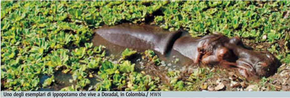
Uno degli esemplari di ippopotamo che vive a Doradal, in Colombia. / MWN