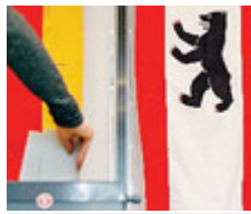
Urne a Berlino.

GERMANIA Il voto amministrativo nella città-regine di Berlino ha confermato quanto si attendeva: uno slittamento a sinistra, una crescita dei populisti di destra dell'Afd, un calo consistente dei principali partiti, la Cdu e l'Spd. Il partito della cancelliera Merkel ha perso cinque punti scendendo al 18%. resta però secondo partito difendendo dall'assalto di Verdi e Linke (entrambi intorno al 16%) e Afd. È il secondo pessimo risultato di fila per la Cdu in pochi giorni. Primo partito i so-