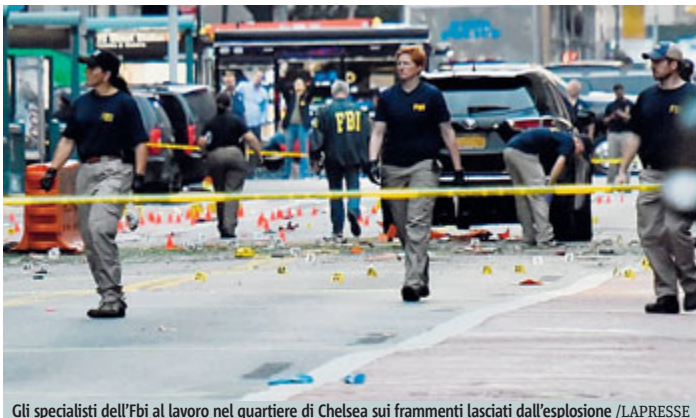
Gli specialisti dell'Fbi al lavoro nel quartiere di Chelsea sui frammenti lasciati dall'esplosione

Nessuna rivendicazione invece, neanche dell'Isis, per la fortissima esplosione che ha sconvolto New York nella tarda sera-