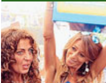
Le vincitrici.