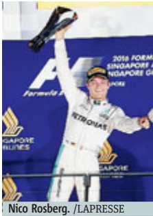
Nico Rosberg.