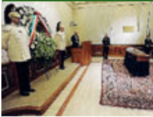
Camera ardente.