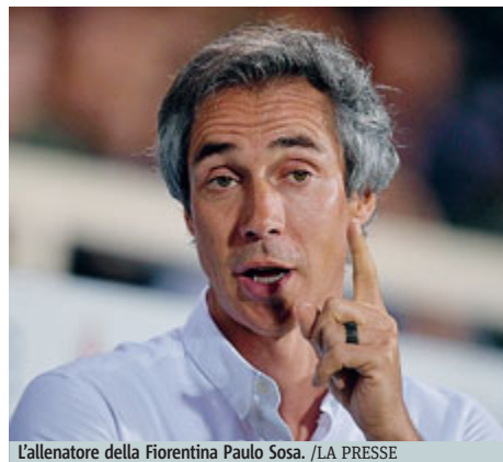
L'allenatore della Fiorentina Paulo Sousa.

Totti a una manciata di minuti dal termine si trova sul destro un pallone che potrebbe regalare il pari alla sua squadra, ma il tiro esce di circa un metro dallo specchio della porta. Insomma alla fine molto rammarico per i giallorossi. In classifica, la squadra di Sousa sale a 6 punti in classifica, con la sfida con il Genoa da recuperare, mentre la Roma resta a quota 7. c.c.r.