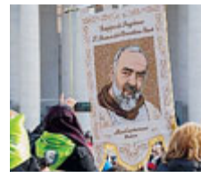
San Padre Pio.

USA Il cuore di San Pio domani sarà traslato a Boston ed esposto, dopo un tour di importanti chiese, nella cattedrale, lasciando per la prima volta il Santuario di San Giovanni Rotondo, dove viene custodito in un prezioso reliquario, per raggiungere gli USA. I corrispondenti Diplomatici di Boston, autori dell'iniziativa, hanno voluto che "la reliquia di San Pio negli USA" fosse un segno vivo come il Padre accoglie quanti sono in cerca del suo perdono.