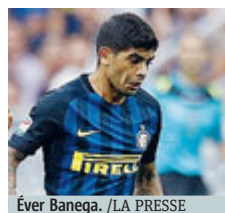
Ever Banega.

testa) si mangiava un gol quasi fatto, Icardi scheggiava il palo dopo un corpo a corpo con Chiellini e, infine, Pjanic cercava il palo più lontano con un colpo di biliardo che però finiva a lato di poco. Pochino, insomma, nei primi 45': meglio, molto meglio,