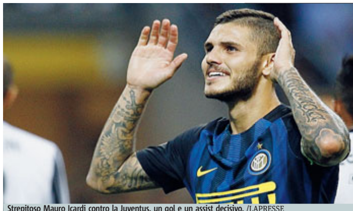
Strepitoso Mauro Icardi contro la Juventus, un gol e un assist decisivo.

Strepitosa gara del centravanti che segna il gol del pari e poi inventa l'assist decisivo per la rete di Perisic