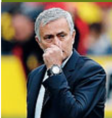
José Mourinho.