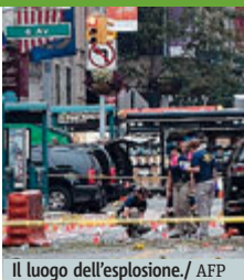
Il luogo dell'esplosione.

Non è sicura la pista terroristica: 29 feriti tutti dimessi. Secondo ordinario inesplosivo FATTI E STORIE