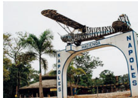
L'ingresso dell'Hacienda Napoles.

Cosa stava cercando di fare Pablo Escobar portando animali come gli ippopotami nella sua proprietà?