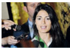
Virginia Raggi.

Settimana decisiva per trovare il nuovo assessore, anche per sbloccare la delibera sui fondi ad Atac