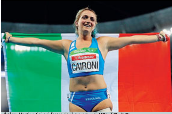
L'atleta Martina Caironi festeggia il suo oro nei 100m T42.

PARALIMPIADI L'Italia chiude le Paralimpiadi di Rio de Janeiro con 39 medaglie. 11 podi in più rispetto a Londra, 10 ori contro otto, e 11 medaglie anche più dei colleghi olimpici, impegnati sugli stessi campi il mese scorso. A mettere la ciliegina sulla torta, la portabandiera azzurra Martina Caironi, medaglia d'oro nei 100 metri T42 in cui la truppa azzurra festeggia doppiamente per il bronzo di Monica Contraffatto. Per la primatista iridata Caironi è invece del 2° oro paralimpico: il primo ottenuto a Londra da giovane esordiente, il secondo se lo porta a casa proprio a Rio in una gara senza concorrenza. Con un timido tentativo ha provato a opporsi la tedesca Vanessa Low ma nei 100 la sprinter delle Fiamme Gialle fa da padrona. Se nel lungo si era dovuta accontentare del secondo posto, qui il suo crono è imbattibile: 14"97 per lei, non molto lontano dal suo record del mondo (14"61) e leggermente più alto del 14"80 corso nella batteria della mattinata (nuovo re-