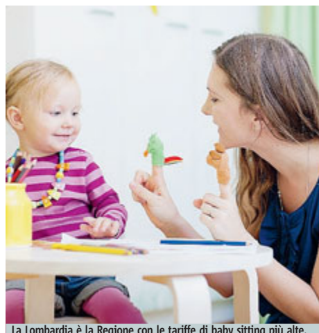
La Lombardia è la Regione con le tariffe di baby sitting più alte.

di quasi 3 euro di differenza all'ora tra Nord e Sud. La regione più cara è la Liguria, seguita da Lombardia, Piemonte e Friuli Venezia Giulia. Le meno care, la Basilicata e la Calabria. Le città più care sono Sarzana (7,98 euro), Luino (9,53 euro) e Sesto Calende (9,30 euro), mentre la città più conveniente dove trovare qualcuno a cui affidare i propri figli è Corato,