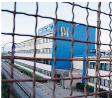
Ilva ancora sotto accusa.

Il gruppo in studio è costituito dalle 321.356 persone residenti tra il 1 gennaio 1998 ed il 31 dicembre 2010 nei comuni di Taranto, Massafra e Statte. Tutti i soggetti sono stati seguiti fino al 31 dicembre 2014, ovvero fino alla data di morte o di emigra-