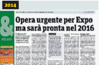
L'articolo di Metro del 9 ottobre 2014 con il quale in nostro giornale denunciava i tanti lati oscuri di un appalto milionario.