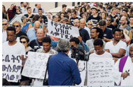
La manifestazione per il terzo anniversario del naufragio LAMPEDUSA.

Ieri intanto è stato celebrato il terzo anniversario del tragico naufragio presso Lampedusa nel quale persero la vita 366 persone migranti. «Lo sconvolgente naufragio del 3 ottobre 2013 è una ferita aperta nella coscienza di ciascuno di noi e costituisce tuttora un monito per l'Europa intera», ha scritto nell'occasione il presidente Mattarella. «La por-