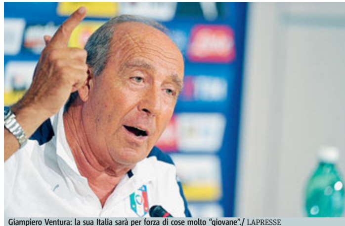
Giampiero Ventura: la sua Italia sarà per forza di cose molto “giovane”.

Il ct azzurro prepara il match di giovedì contro la Spagna: ma dice che SuperMario può ancora sperare