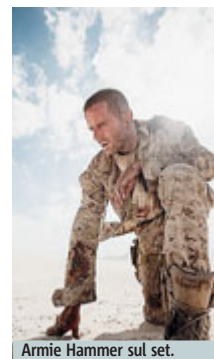
Armie Hammer sul set.

CINEMA La guerra come un thriller dell'anima che ti fa riattraversare tutta la tua vita. È “Mine” (da giovedì in sala), prodotto americano ma firmato da due italiani, Fabio Guaglione e Fabio Resinaro, interpretato da Armie Hammer che qui sa toccare stomaco e cuore. Lui, che sarà padre per la seconda volta, giura di «avere amato questo film difficile e di tenere moltissimo a ciò che posso lasciare ai miei figli per eredità: un film del genere rientra tra queste cose. Un film che parla di vita, di caso e di morte attraverso un soldato che è un eroe, anche se i miei eroi sono quelli che cercano