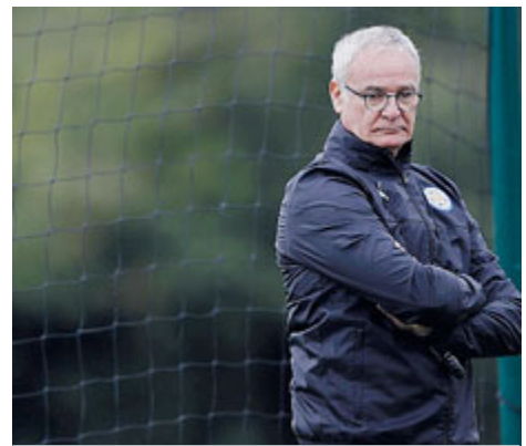
Claudio Ranieri: il suo Leicester non brilla in Premier.