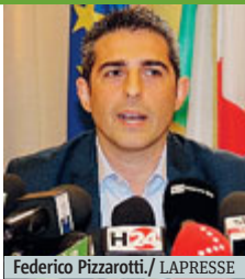
Federico Pizzarotti.

Il sindaco di Parma lascia il Movimento e attacca: “Arrivisti ignoranti” FATTI E STORIE