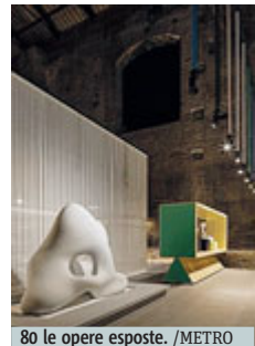
80 le opere esposte. /METRO

cano fino al 15 gennaio 2017 Jean Arp, con 80 opere di grande impatto visivo che ci guidano nello straordinario mondo del pittore e scultore francese. Presenti in esposizione anche diverse opere della moglie Sophie Taeuber, con la quale visse un sodalizio sentimentale e artistico tra i più fecondi del '900. Info: 0639967700. DO. PA