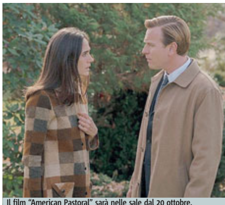
Il film “American Pastoral” sarà nelle sale dal 20 ottobre.

Ewan McGregor debutta alla regia in “American Pastoral” di cui è anche interprete con Jennifer Connelly e Dakota Fanning