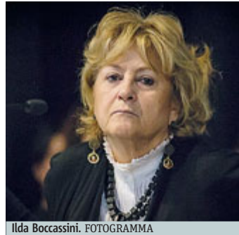
Ilda Boccassini. FOTOGRAMMA

Il piatto più ricco è l'appalto per la costruzione della ferrovia tra il Terminal 1 e 2 dell'aeroporto milanese di Malpensa. Un appalto da 110 milioni di euro gestito da Ferrovie Nord Milano del quale "Metro" denunciò più volte i diversi lati oscuri già dal 2014. Il primo e più macroscopico è che quest'opera sia stata dichiarata "fondamentale per Expo" e come tale abbia goduto di una corsia preferenziale nell'iter delle gare e, soprattutto, nei controlli. Peccato però che il bando di gara per la costruzione della ferrovia prevedesse un inizio lavori a Esposizione Universale già aperta. Un assurdo. Ora si sospetta che sul quell'appalto senza con-