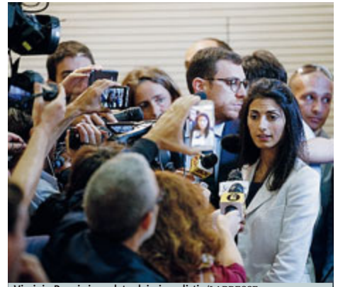
Virginia Raggi circondata dai giornalisti.

La sindaca, che annuncia di aver recuperato 9 milioni per il sociale, giovedì alle 13 presenterà la rinnovata giunta ai consiglieri comunali