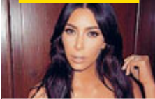
La star Usa.