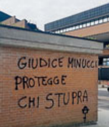
Le scritte davanti al tribunale. LORENZETTI