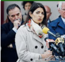
Virginia Raggi.