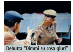
Debutta "Dimmi su cosa giuri"

In scena, anche il rapporto tra medico e paziente in cui quest'ultimo vede il medico come una specie di saggio nelle mani del quale affidarsi con assoluta speranza. È così che il medico finirà presto per trasformarsi in una vesta-