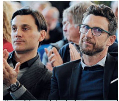
Montella e Di Francesco ieri a Coverciano.

ndr) ma ho un contratto e da parte mia non ci sono problemi», ha detto, prima di negare, filosoficamente, che le vicende del closing abbiano distratto lui o la squadra: «Sinceramente non ho speso molte energie in questo discorso, è una cosa più grande di noi...». Chiusura su Donnarumma, oggi in porta contro l'Olanda: «Merito di Sinisa che l'ha lanciato». METRO