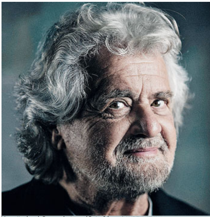
Lo spettacolo sarà di scena solo stasera al Teatro Colosseo

Lo farà cominciando proprio da se stesso a cui rivolgerà un sonoro "Vaffa", marchio di fabbrica del Grillo leader politico. In scena si assi-