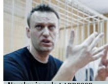
Navalny in aula

partecipato alle manifestazioni di Mosca dietro la promessa di rimpicciolate finanziarie». Respinte seccamente le critiche di Unione europea e Stati Uniti e la richiesta di liberare i manifestanti. Lo stesso Navalny è stato su-