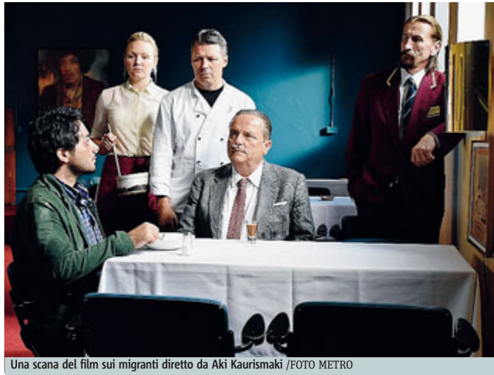
Una scena del film sui migranti diretto da Aki Kaurismäki

Aki Kaurismäki racconta "L'altro volto della speranza", vincitore dell'Orso d'argento a Berlino, dal 6 aprile in sala