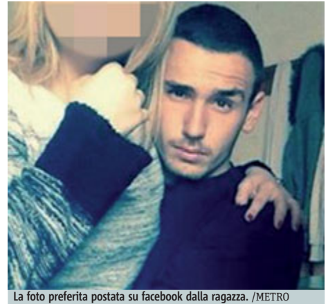
La foto preferita postata su facebook dalla ragazza.

La fidanzata del giovane massacrato ad Alatri lo saluta su Facebook dando voce al dolore suo e di una comunità scioccata e annichilita