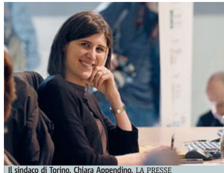
Il sindaco di Torino, Chiara Appendino.

zione della Prima cittadina è giunta a margine della presentazione del festival dedicato ad Antonio Vivaldi: «Entro marzo dovevamo decidere come stanziare le risorse e la decisione è stata di mettere in sicurezza welfare e sistema educativo: se in questo momento avessimo dovuto spostare risorse dal sistema educativo, significava dover tagliare nell'immediato 600 posti nido». «Un sindaco - ha