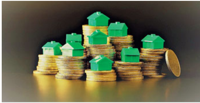
Nei primi mesi del 2017, si è registrato un aumento delle richieste dei trilocali.

I primi mesi dell'anno hanno visto un deciso ritorno all'acquisto anche se, con scenari macroeconomici ancora incerti, la prudenza è d'obbligo. I bassi tassi di interesse sui mutui, i prezzi delle abitazioni ormai a livelli minimi ed una rinnovata fiducia hanno determinato un aumento delle compravendite come hanno confermato gli ultimi dati dell'Agenzia delle Entrate. Negli ultimi anni il mercato immobiliare ha visto i prezzi scendere progressivamente e questo ha comportato un cambiamento a livello di tipologie immobiliari richieste.