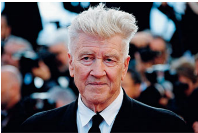
Il regista David Lynch sul red carpet al festival di Cannes 2017

Al festival di Cannes il regista ha fatto vedere in anteprima i primi due episodi della nuova serie, in tv dopo 17 anni dalla prima