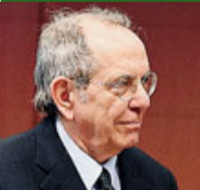
Pier Carlo Padoan.