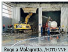
Rogo a Malagrotta.

«No alle discariche» Iter in corso per i 3 impianti di organico. Incendio a Malagrotta