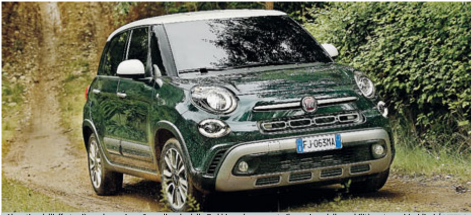
Al vertice dell'offerta c'è ora la versione Cross, l'erede della Trekking, che consente il massimo della mobilità su terreni insidiosi./ METRO

C'è un altro motorshow a Bologna: l'Autopromotec, rassegna attrezzature e aftermarket per auto. Fino a domenica. METRO