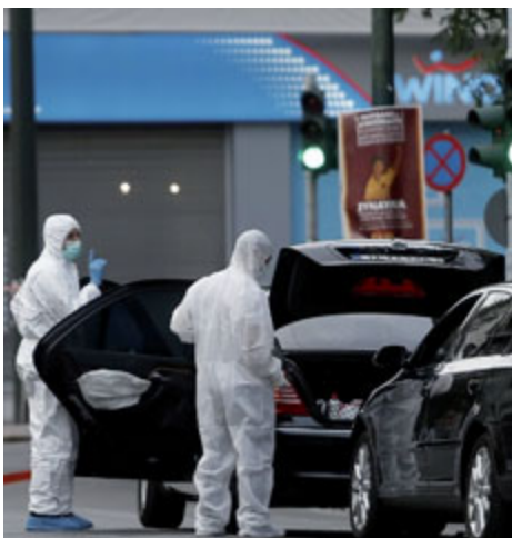
I rilievi della polizia sull'auto di Papademos.

Paesi saranno rappresentati da un esordiente: il presidente francese, Emmanuel Macron, la premier britannica, Theresa May, e il nostro premier Paolo Gentiloni. Abissale la distanza fra le parti (in particolare tra Ue e Usa) su temi come quelli del clima, del commercio e dei rapporti con la Russia. «Non sarà un confronto semplice», concorda il premier Gentiloni. METRO