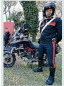
I mezzi Ducati.