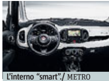
L'interno "smart"/ METRO

AUTO Oltre il 40% dei componenti rinnovati per la nuova Fiat 500L che sarà in vendita dal 17 di giugno a dei prezzi pressochè invariati oltre che in promozione a partire da 15.900 euro per il modello di accesso alla gamma, mille in meno se lo si acquista con la rateazione. La 500L da sempre un modello di conquista si evolve sia nello stile adesso ancora più personale che nelle dotazioni di sicurezza e quelle più hitech molto apprezzate da giovani. Al vertice dell'offerta c'è ora la versione Cross, l'erede della Trekking che oltre allo