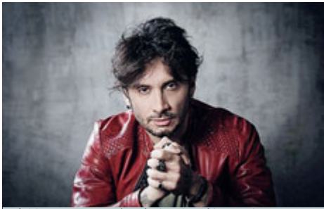
Fabrizio Moro presenterà anche i suoi vecchi successi

Dopo Sanremo, Fabrizio Moro sarà stasera e domani sera al Palalottomatica con il suo nuovo album