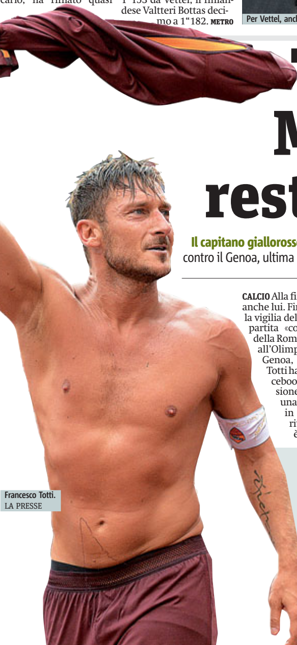
Francesco Totti.

Il capitano giallorosso rompe il silenzio sul suo futuro: ma non chiarisce se quella contro il Genoa, ultima gara con la maglia della Roma, sarà pure l'ultima da giocatore