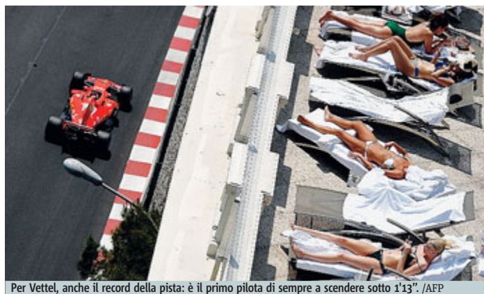
Per Vettel, anche il record della pista: è il primo pilota di sempre a scendere sotto 1'13".

mezzo secondo all'australiano Daniel Ricciardo (1'13"207) con la Red Bull. Terzo Kimi Raikkonen, a 0"563 da Vettel. Seguono le due Toro Rosso di Daniil Kvyat e Carlos Sainz. Lontane le Mercedes: l'inglese Lewis Hamilton (che aveva dominato la prima sessione) ha chiuso ottavo a 1"153 da Vettel, il finlandese Valtteri Bottas decimo a 1"182. METRO