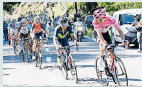
Dumoulin tiene a distanza di sicurezza gli avversari.

co Pozzovivo, team AG2R La Mondiale, +8". Resta dunque in maglia rosa l'olandese del Team Sunweb, Tom Dumoulin, in ritardo di 1'06" seguito con lo stesso tempo da Nairo Quintana, (Movistar). Nibali, undicesimo, avvisa Dumoulin: «non sia troppo spavaldo. Potrebbe scendere dal podio». E domenica l'arrivo a Milano. METRO