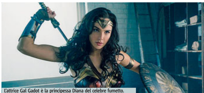
L'attrice Gal Gadot è la principessa Diana del celebre fumetto.

La Rivoluzione sta arrivando, ultimo album d'inediti dei Negramaro è stato certificato doppio disco di platino. La band di Sangiorgi è in studio di registrazione sul prossimo progetto. Oro per i Pooh con The Collection 5.0. Tra i singoli Pamplona di Fabri Fibra (feat. Thegiornalisti) è Oro. Ed Sheeran con Shape of you vola a 7 platino, mentre Despacito di Luis Fonsi feat. Daddy Yankee raggiunge quota 6 platino. METRO