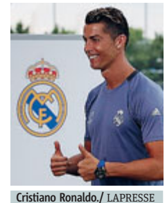
Cristiano Ronaldo.

CALCIO Il Real segna da 64 partite, ma la BBC bianca nera è pronta. Impermeabile a tutto. Anche all'età, al momento. E al cambio del modulo. Così, quando pareva fosse arrivato il momento per mettersi da parte, Andrea Barzagli è tornato imprescindibile o quasi: quarto di destra, con poche licenze offensive ma utilissimo per coprire le spalle a Cuadrado o Dani Alves. Andrà così anche a Cardiff, dimenticando i 36 anni compiuti e mettendosi - quando necessario - sulle tracce di Cristiano Ronaldo. «Come