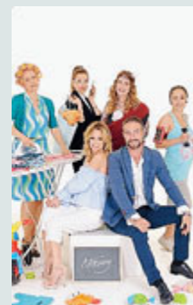
Le mamme e i conduttori del nuovo programma.

Dopo essersi presentate e avere espresso un desiderio pensato ad hoc per fare felici i propri figli (la cui realizzazione sarà il