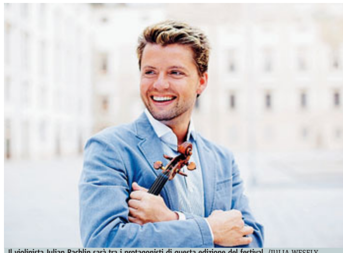
Il violinista Julian Rachlin sarà tra i protagonisti di questa edizione del festival.

La serata d'apertura del festival a Torino, il 4