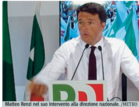
Matteo Renzi nel suo intervento alla direzione nazionale.

cronoprogramma è già deciso: oggi verrà presentato in commissione Affari costituzionali a Montecitorio il maxi emendamento Fiano al testo base; domani le prime votazioni in Commissione; il nuovo testo arriverà in Aula alla Camera il 5 giugno, poi al Senato per il via libera entro la prima settimana di luglio. Punta i piedi Alfano: «Non capisco l'impazienza del Pd di portare l'Italia al voto. Si rischiano danni per miliardi alla nostra economia». METRO