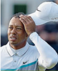
Tiger Woods.