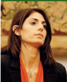
Virginia Raggi.

«Non mi dimetterò per rinvio a giudizio»