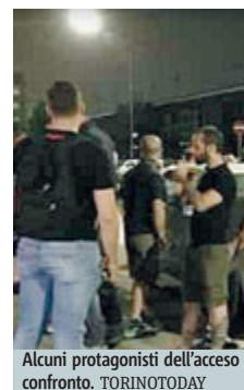
Alcuni protagonisti dell'accesso confronto.

V. OLIMPICO Momenti di tensione lunedì sera all'ex Moi, l'ex Villaggio olimpico di Torino. A scatenare il parapiglia, la presenza di una troupe del programma "Quinta Colonna" di Rete 4. La troupe ha riferito agli agenti di essere stata aggredita dagli occupanti delle palazzine che avrebbero sottratto loro la telecamera. La telecamera è stata poi trovata a terra dalle forze dell'ordine. Sul posto erano presenti anche alcuni esponenti di CasaPound, probabilmente all'ex Moi per partecipare al programma. La polizia sta fa-