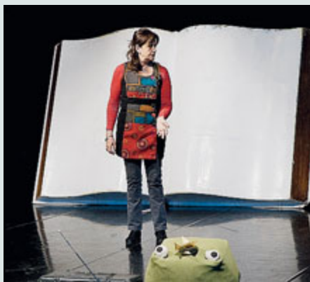
Da "La Costituzione in undici colori" di Siccò e Arrivas.