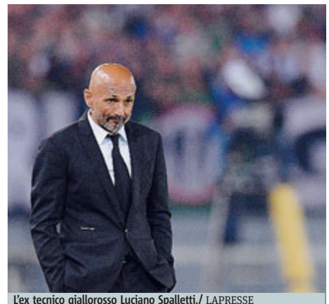
L'ex tecnico giallorosso Luciano Spalletti.

Il tecnico non è più alla guida della Roma: vicino alla società fino alla fine, ha avuto molte cose da puntualizzare con l'ambiente ed i tifosi. Di Francesco ieri era già in città. Montella, intanto, rinnova fino al 2019