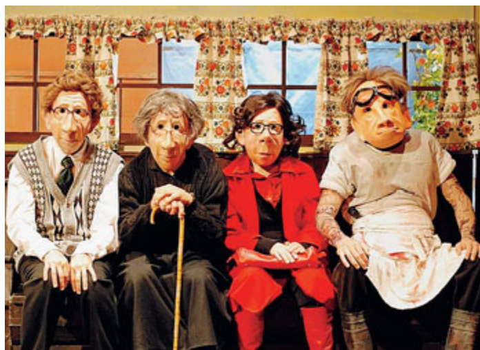
Il 23 marzo di scena i Familie Flöz con il loro "Hotel Paradiso"