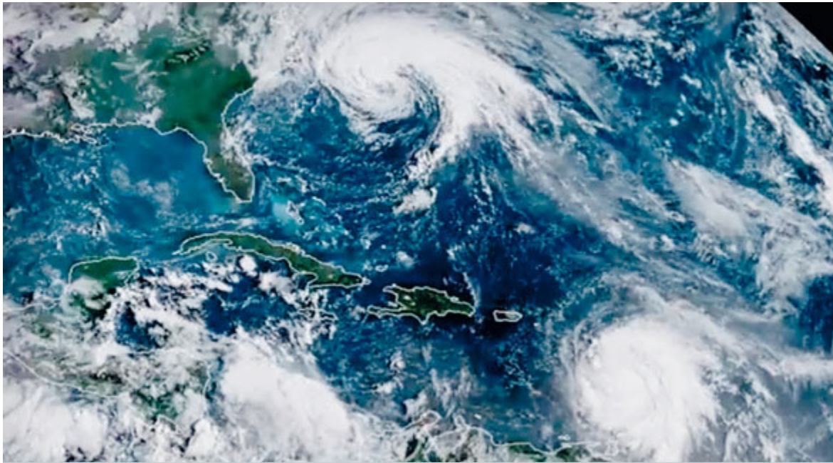
L'immagine satellitare dei due uragani Maria e Jose nell'Atlantico.