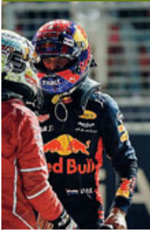
Max Verstappen.