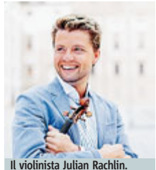
Il violinista Julian Rachlin.

Ad aprire la scaletta sarà "Lontano" dell'ungarese György Ligeti, composizione del 1967, usata anche da Stanley Kubrick in "The Shining" e da Martin Scorsese per