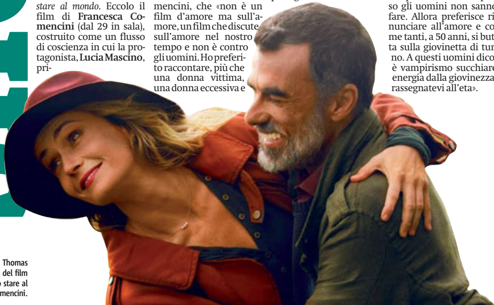
Lucia Mascino e Thomas Trabacchi protagonisti del film "Amori che non sanno stare al mondo" by Francesca Comencini.