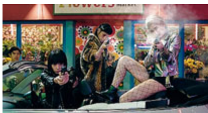
Un frame dal film "Tokyo Vampire Hotel di Sion Sono.