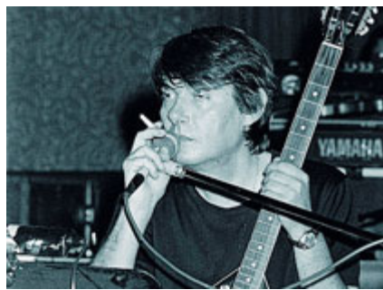
Fabrizio De André.