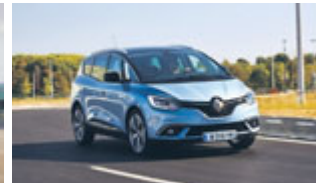
Renault SCENIC Zen Energy dci 110cv