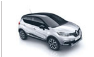
Renault CAPTUR Intens Energy dci 110cv