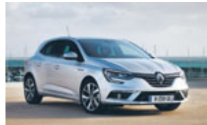
Renault MEGANE Zen Energy dci 90cv