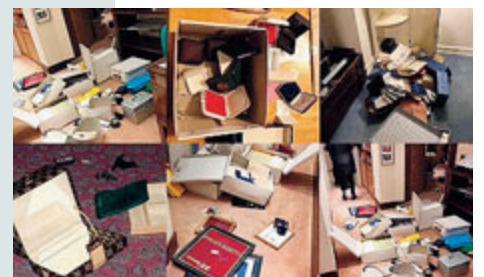
La casa sottosopra. /METRO

ricolo» e poi «gli americani sono più avanti di noi, possono difendersi. Qui invece come ci tutela lo Stato? Permetti che se uno ti sta svaligiando la casa tu possa difenderti e sparare? Invece rischi di finire sotto processo». Di recente i ladri avevano colpito Adriano Celentano e Roby Facchinetti.