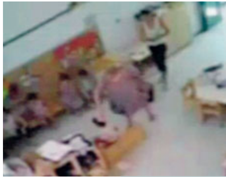
Il video.

VERCELLI Schiaffi, spintoni, trascinamenti per terra oltre a urla terrificanti, punizioni spropositate e maltrattamenti psicologici. Tre maestre della scuola dell'infanzia di Vercelli «Korczak» sono finite agli arresti domiciliari per il reato di maltrattamenti nei confronti di bimbi dai 3 ai 5 anni di età. L'attività investigativa condotta dalla polizia di Vercelli ha portato a riscontrare, anche grazie all'utilizzo di telecamere posizionate nei locali (aule, corridoi, mensa e palestra) ben 52 episodi di maltrattamenti, di cui 20 di maggiore gravità. A dare il via alle indagini la denuncia di