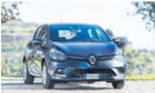
Renault CLIO Zen Energy dci 75cv

Approfitta delle nostre occasioni imperdibili sulle auto aziendali. Ti aspettiamo il 24 Novembre con un'offerta straordinaria. Eccezionali sconti su un numero limitato di vetture.