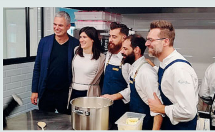
La presentazione all'ex Incet. /CONTALDO