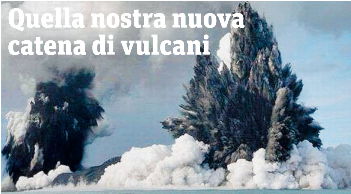
Eruzioni in mare.

Grazie anche a un robot scoperta una "rete" mediterranea di 15 crateri. Tutta sottomarina