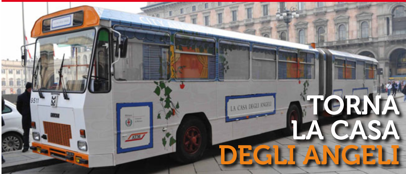
In foto: il bus "la Casa degli Angeli" di Atm e City Angels

A nche quest'anno a Natale torna l'appuntamento con la solidarietà. Infatti, come ogni anno, è di nuovo per le strade di Milano la "Casa degli Angeli", il bus dell'Azienda Trasporti Milanese che, in collaborazione con i City Angels, si trasforma in un rifugio in giro per la città, portando pasti caldi, bevande, coperte, indumenti, assistenza qualificata e un posto dove dormire a coloro che sono senza casa e hanno bisogno di aiuto. Si tratta di un punto di riferimento che negli ultimi anni, dal 2011, grazie al progetto condiviso tra Atm e l'Associazione City Angels si è sempre più affermato tra i senzatetto di Milano e che dal 18 dicembre è tornato per le strade della città. I numeri fatti registrare dall'i-