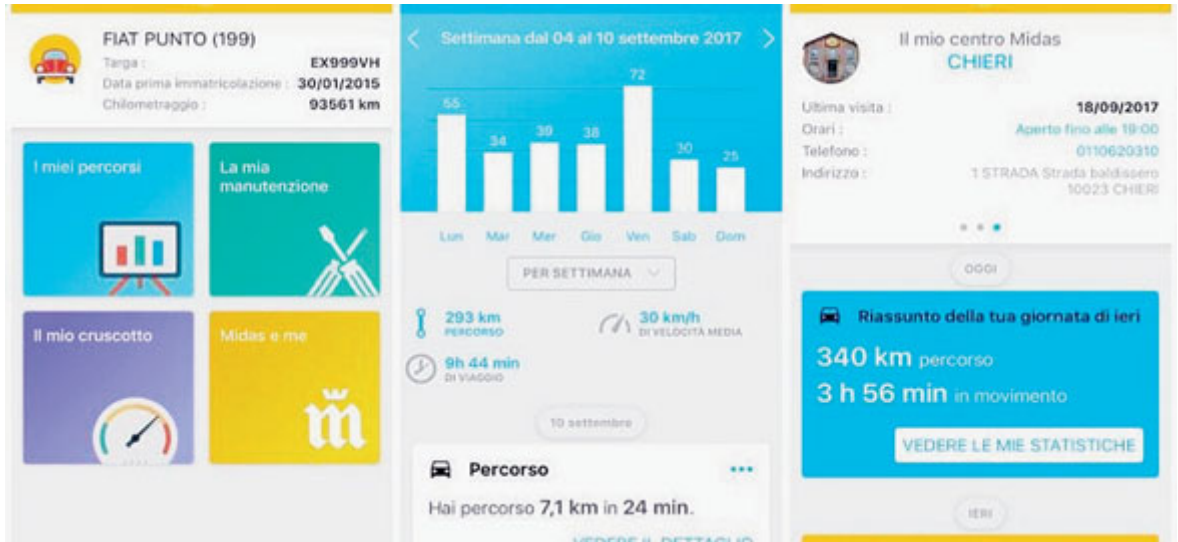
Come funziona l'applicazione Midas Connect /METRO