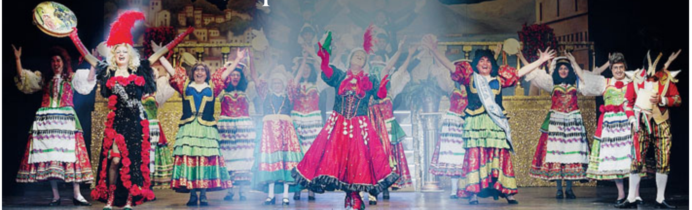
I Legnanesi in scena al Teatro della Luna.