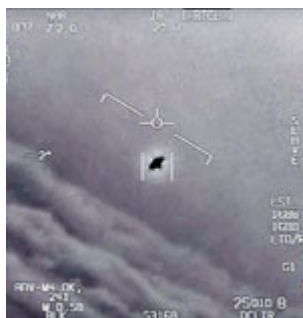
Le immagini dell'oggetto misterioso che ruota sul Pacifico tratte dal filmato del Pentagono.