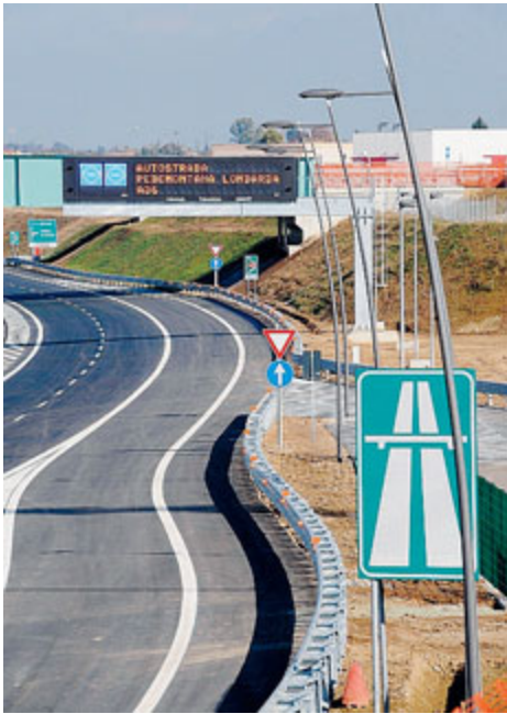
La Pedemontana