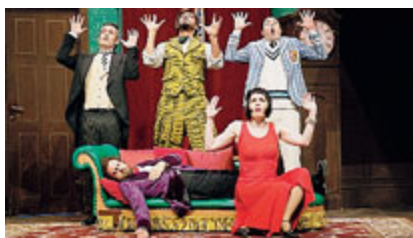
Da stasera all'11 marzo in scena

Il secondo spettacolo, "Jesus", tratta invece del consumismo religioso. È un'ironica riflessione sull'esposizione mediatica di Gesù: affrescato, dipinto, tatuato, moltiplicato anche nella posta tra i dépliant, nella marca dei jeans e sulle copertine delle riviste (Info: teatrotorinostabiletorino.it).