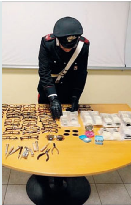
Parte della merce rubata e poi recuperata.