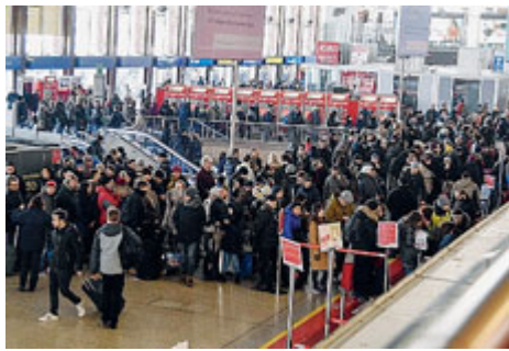
Folla a stazione Termini.