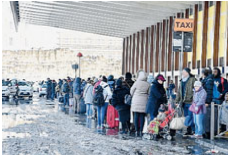
File interminabili per i taxi.