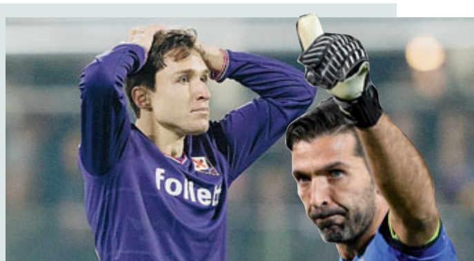
Federico Chiesa e, a lato, Buffon.

BASKET Vittoria e pass qualificazione ottenuto per l'Italia che vince in Romania 101-50. Un successo che vale un tesoretto per la seconda fase che servirà a decidere chi prenderà parte ai Mondiali. L'Italia parte col piglio giusto trovando il +17 dopo 6' con una schiacciata di Abass. Gli azzurri fanno bene a rimbalzo con Burns, dall'altro lato invece la nazionale rumena fatica a carburare anche per merito dell'attenta difesa italiana. Della Valle e soci giocano sulle ali dell'entusiasmo, trovando ottime cose anche dalla panchina. Il quintetto di Sacchetti raggiunge il 35-12 con cui chiude il 1° quarto. La Romania fa tantissima fatica in attacco, l'Italia abbassa la qualità del suo gioco ma continua a condurre con autorevolezza. Gli azzurri centrano il +40 sul finire del 3° periodo col duo Abass-Biligha, l'ultimo quarto così vale solo per le statistiche.