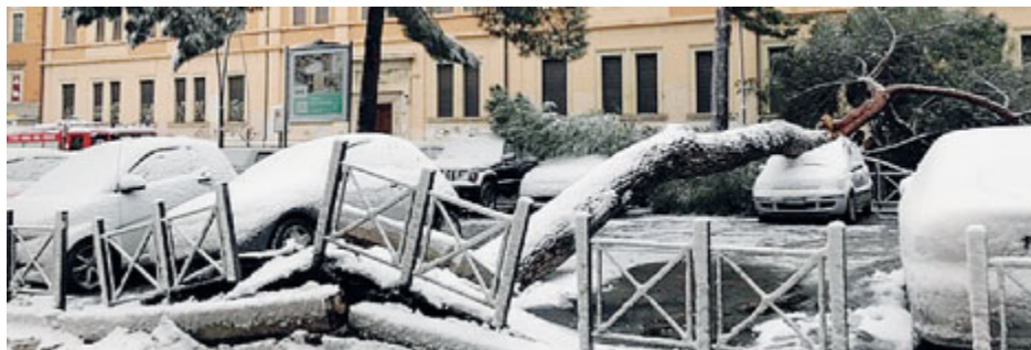
Uno delle decine di alberi caduti a Roma, con auto danneggiate.

Alcune trasmissioni Rai ieri non sono andate in onda a causa della nevicata su Roma. A cominciare da "I fatti vostri" su Rai2: il pubblico non è riuscito a raggiungere lo studio. Niente pubblico per Storie Italiane su Rai1.