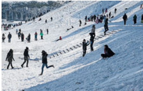
Divertimento al Circo Massimo.