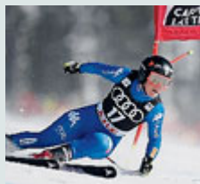
Sofia Goggia.

SCI Praticamente inarrestabile: Sofia Goggia non si ferma più e trionfa anche nel Super g di Are, in Svezia, penultima gara di Coppa del mondo. Ieri, all'indomani della conquista del titolo di specialità nella libera (e a un mese dall'oro olimpico), la 25enne bergamasca ha centrato la sua quinta vittoria in carriera precedendo in 1'07"92 la tedesca Rebensburg e l'americana Lindsey Vonn, terza a 53 centesimi (e sempre più scura in volto quando va a compli-