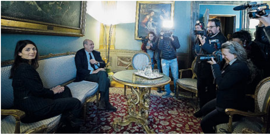
L'incontro di ieri tra Nicola Zingaretti e Virginia Raggi in Campidoglio.