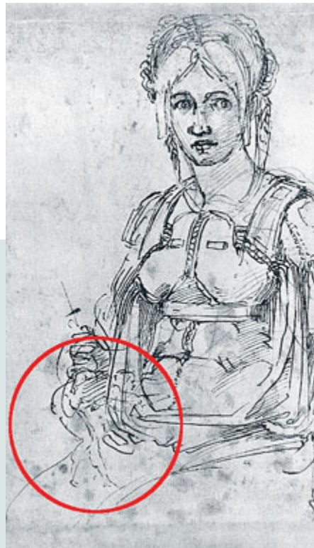
Ritratto di Vittoria Colonna.

Per Mosca è in atto una campagna «russofoba» alimentata con accuse «folli» e dallo «show politico» della May. Da parte sua il segretario generale della Nato, Jens Stoltenberg, ha assicurato che l'approccio dell'Alleanza rispetto alla Russia «rimane fermo, difensivo e proporzionato». «Continueremo a cercare un dialogo significativo con Mosca - ha detto - seppure difficile, è vitale per aumentare la trasparenza e ridurre i rischi».