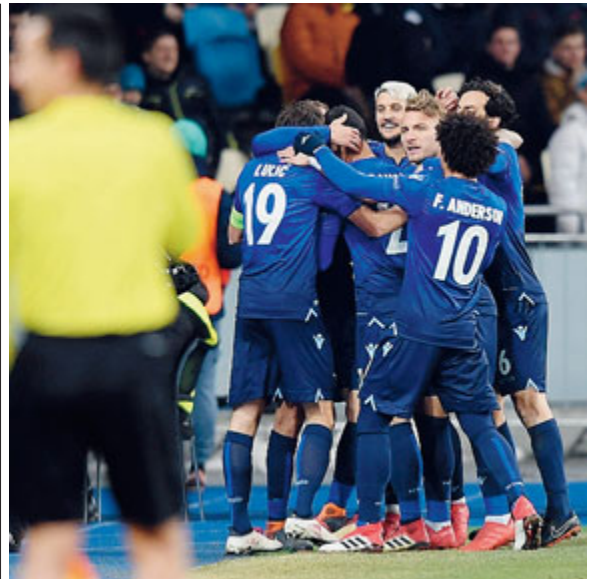
Ucraini schiacciati, risultato giustissimo.

campo con un inedito 4-4-2 molto aggressivo (con una punta in più di ruolo, André Silva) sono stati più forti degli eventi: hanno aggredito gli avversari, coperto loro gli spazi e creato moltissime occasioni. E comunque hanno sempre attaccato, giocando su sogni pallone, tanto che i 2500 tifosi sugli spalti non hanno mai smesso di incitarli. Nemmeno quando Donnarumma, autore anche ieri di pregevoli parate, è incappato in una povera: Khaka calcia di sinistro da 28 metri, il portiere vola sulla sinistra e si devia il pallone a fil di palo, alla sua destra. Due a uno e gara chiusa. Il Milan però non ci sta e continua a lottare. Il 3-1, viziato anche da fuorigioco, è di Welbeck. E forse è una punizione eccessiva.