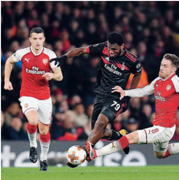
Gara combattuta: decisivo l'errore dell'arbitro.