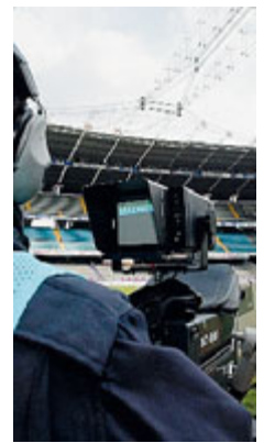
Diritti fino al 2021

CALCIO Momento fondamentale ieri per i diritti tv del calcio: via libera dell'Antitrust alla assegnazione dei diritti audiovisivi per l'Italia relativi alla Serie A per il triennio 2018-2021 a favore di Mediapro. Il Garante ha deliberato la conformità dei criteri adottati nella procedura alle disposizioni del Decreto Melandri, con alcune osservazioni. «Tale soggetto - scrive - è tenuto a svolgere attività di intermediazione di diritti audiovisivi, rivedendo i diritti ad altri soggetti con modalità eque».