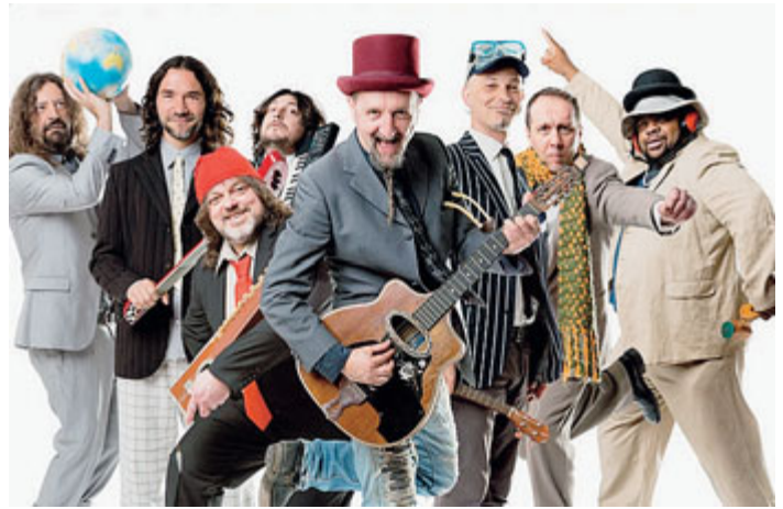
Bandabardò, quasi 25 anni di carriera alle spalle.

Protagonista assoluto di Enotica è il vino, rigorosamente biologico e naturale, di provenienza certificata, che non specula sul prezzo e rispetta l'ecosistema, e naturalmente il cibo, con una ricca offerta di prodotti. Ma accanto a vino e cibo non mancheranno tutta una serie di eventi di vario genere, ad esempio musicali, con una programmazione piuttosto ricca. Stasera dop-