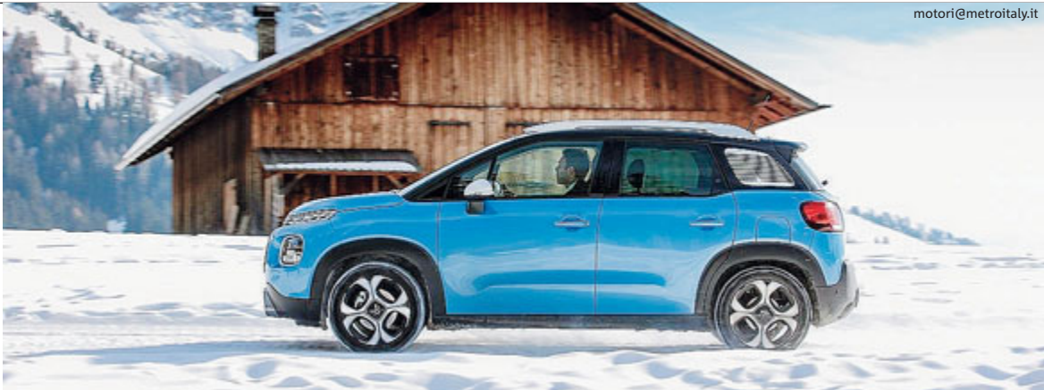
La motricità è modulata dal sistema Grip Control con Hill Assist Descent /METRO