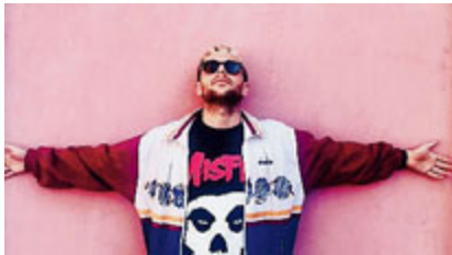
L'artista romano Gazzelle.