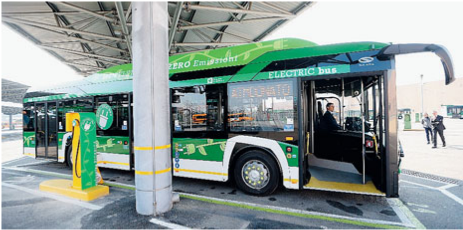
Il nuovo bus elettrico della linea 84 ha una autonomia di 180 chilometri e un tempo di ricarica di 5 ore.