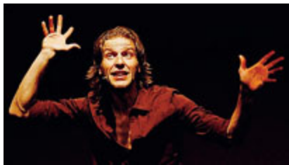
Di scena stasera al Teatro Grassi