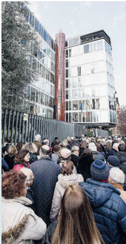
La folla in coda.