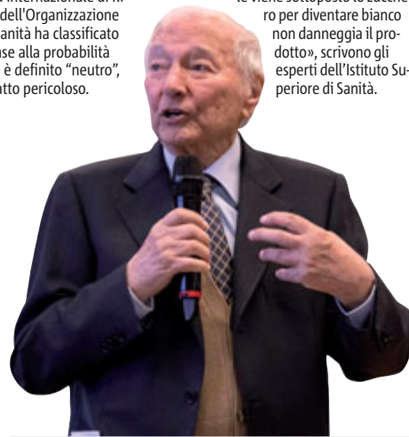
Piero Angela

Aprirà il Congresso scardinando le credenze «magico-superstiziose nella storia del pensiero medico. In particolare sul cibo l'uomo ripone un grande investimento emotivo. Normale che si aprano voragini nelle