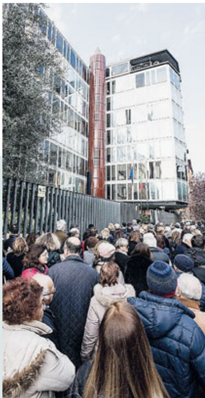
La folla in coda.