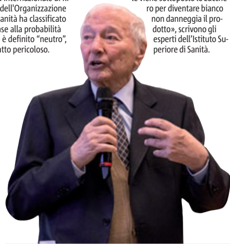
Piero Angela

Aprirà il Congresso scardinando le credenze «magico-superstiziose nella storia del pensiero medico. In particolare sul cibo l'uomo ripone un grande investimento emotivo. Normale che si aprano voragini nelle