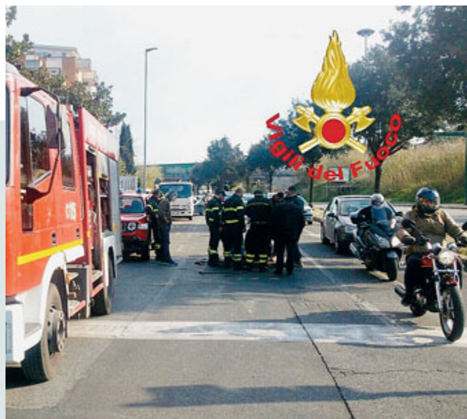
L'intervento di ieri pomeriggio.