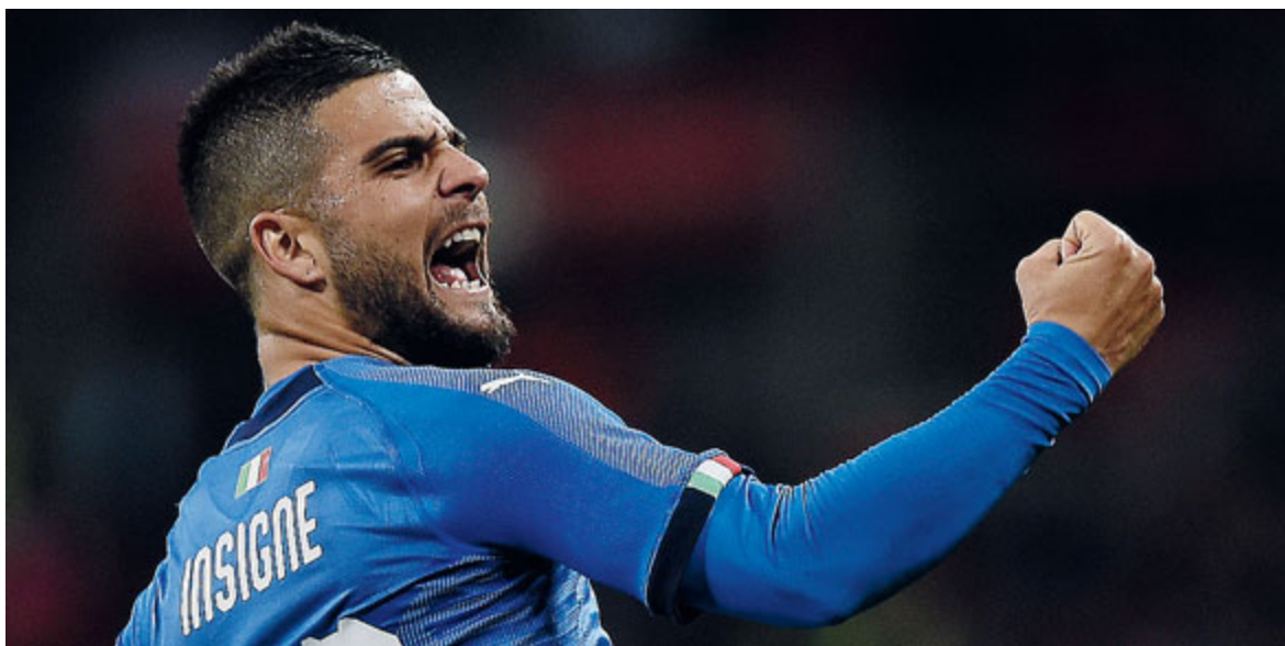
Lorenzo Insigne.