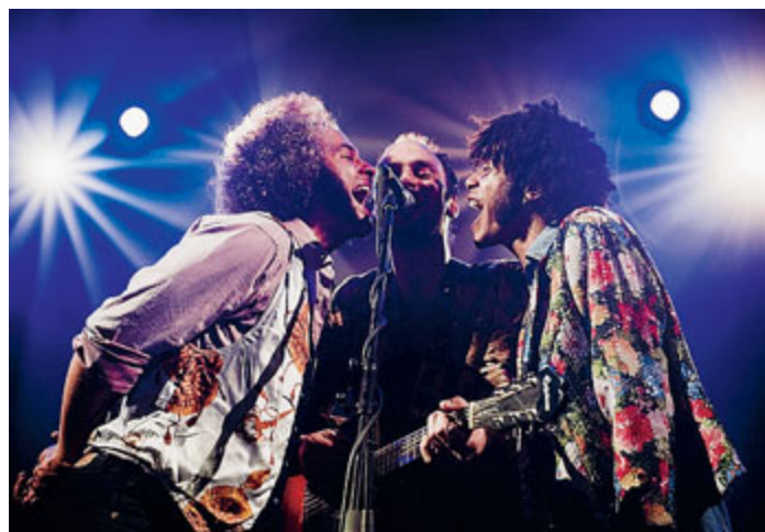
Fra gli ospiti della serata ci saranno anche i Joe Victor

Fra gli artisti della serata - in cui sono previsti anche ospiti a sorpresa - ci saranno Galeffi, giovane cantante che ha