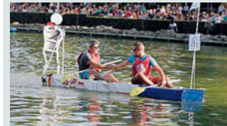
I vincitori della Reboat 2018 al Laghetto.