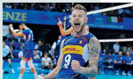
Ivan Zaytsev, anche ieri decisivo.

rendono 3-1 (23-25; 25-19; 25-13; 25-18). Al Mediolanum Forum di Asago l'Italia affronterà ora l'Olanda che ha clamorosamente concluso la Pool B al secondo posto alle spalle del Brasile e davanti a Francia e Canada.