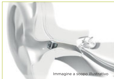
Immagine a scopo illustrativo

AudioNova conosce il valore di poter comunicare bene e di partecipare alla vita sociale. Per questo, da oltre 10 anni offre soluzioni di qualità e di ultimissima generazione che rispondono allo stile di vita e alle esigenze personali di ogni Cliente. Non solo apparecchi acustici, ma un servizio completo di primissimo livello, orientato a comprendere i bisogni e le necessità dei Clienti, attraverso una gamma comple-