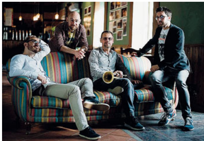
Gli Shirt Tail Stompers saranno di scena al Golden per il mini tour benefico.

EVENTI Partirà stasera alle 21 dal Teatro Golden il mini-tour benefico Music for Love-Musica per noi speranza per l'Africa. Finanziato dall'imprenditore toscano, americano d'adozione Franco Nannucci il progetto, che nei prossimi giorni approderà anche a Forlì e a Prato, servirà a sostenere l'Associazione Peter Pan, che aiuta i bambini che necessitano di cure contro i tumori presso l'ospedale Bambin Gesù. «Nel 2016 in occasione del mio 50° compleanno - spiega il promotore dell'iniziativa - pensai di organizzare una festa benefica per ritrovare gli amici di sempre e raccogliere fondi per sostenere la fondazione Fabrizio Meoni. In quella serata raccogliemmo circa 60mila euro e da lì nacque l'idea di ripetere l'esperienza, ingrandendola e strutturandola. Con oltre 200mil-