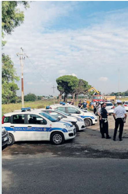
I blocchi disposti dai vigili.