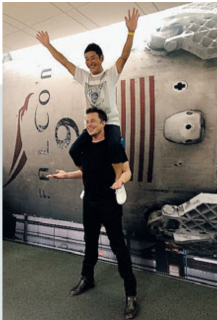
Yusaku Maezawa sulle spalle di Elon Musk

USA Particolari piccanti e salaci sulla relazione sessuale con Donald Trump, il fatto che l'immobiliarista newyorkese tutto volente fuorché diventare presidente, la sua assicurazione che avrebbe barato pur di farla rimanere a lungo al suo reality show, The Apprentice: c'è un po' di tutto nel libro di Stormy Daniels, la pornstar che sostiene di aver avuto una relazione con Trump. La pornstar fa una descrizione molto dettagliata, fin troppo, del suo rapporto sessuale con il futuro presidente. E rivelando dettagli molto intimi, esordisce così: «Lui sa di avere un pene molto insolito... come il fungo Toad di Mario Kart, più piccolo della media, ma non incredibilmente piccolo». «Era stata forse l'esperienza di sesso meno emozionante che abbia mai avuto, ma lui evidentemente non la pensava così».