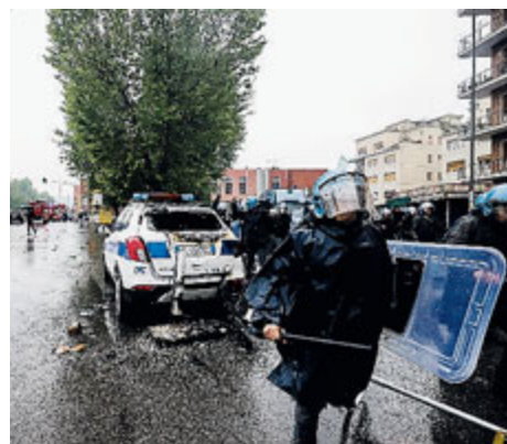
Una delle auto incendiate.

La sindaca Raggi, nell'esprimere solidarietà ai vigili aggrediti, ha dichiarato: «Le città non possono essere messe a ferro e fuo-