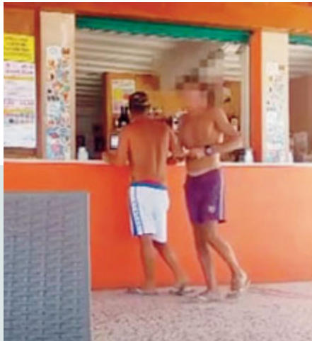
Risultava al lavoro in ospedale, ma andava in spiaggia.