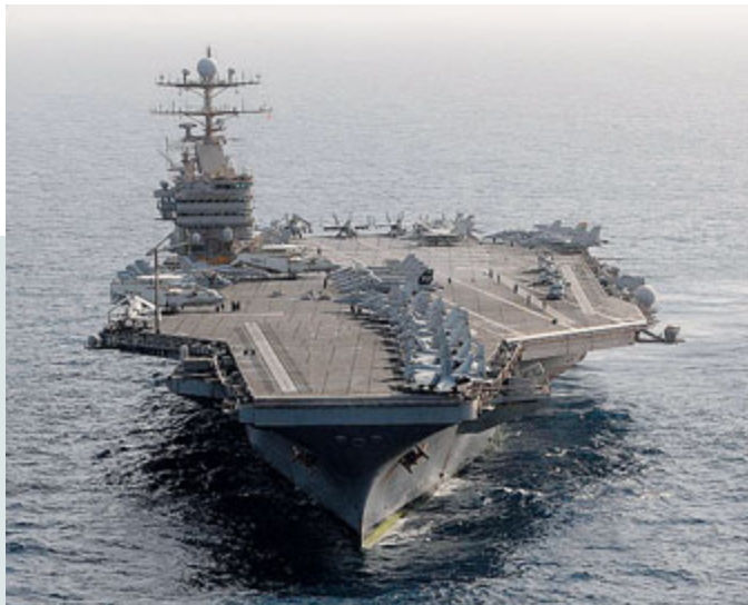
La portaerei USS "Abraham Lincoln" diretta verso lo Stretto di Hormuz.

GERMANIA Un "collezionista" di auto ha usato un giro di prova per rubare una Ferrari d'epoca del valore di oltre 2 milioni. L'episodio, come ha riferito la polizia tedesca, è avvenuto a Duesseldorf: il sospetto si è presentato dal concessionario e ha espresso interesse nell'acquisto di una Ferrari 288 GTO del 1985, chiedendo di provarla. Al momento di scendere dall'auto, però, l'uomo ha accelerato ed è sparito. Fortunatamente, la Ferrari ha attratto l'attenzione di molti mentre passava per le strade ed è stata trovata poco dopo in un garage a Grovenbroich. Il ladro però non è stato preso e la polizia ha diramato una sua foto nella speranza di rintracciarlo. L'auto sottratta ha 43 mila chilometri ed è appartenuta all'ex pilota nordirlandese di Formula 1 Eddie Irvine, ferrarista tra il 1996 e il 1999.