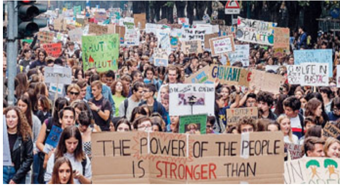
La marcia Friday for future a Milano.

Quello che questi ragazzi vogliono è giustizia per il loro futuro, unità globale e immediata azione politica. Nello specifico i ragazzi del FFF chiedono una riduzione di utilizzo dei combustibili fossili che dovrà raggiungere lo 0 netto di emissioni nel