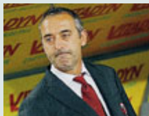
Marco Giampaolo

bagnate Krzysztof Piatek potrebbe perdere il posto in favore di Rebic, che entrerebbe nel tridente con Suso e Leao. A centrocampo è possibile il ritorno dal 1' di Paquetà, in regia Biglia sostituirebbe il deludente Bennacer mentre in difesa Duarte sostituirà lo squalificato Musacchio. Il tecnico valuta anche di schierare