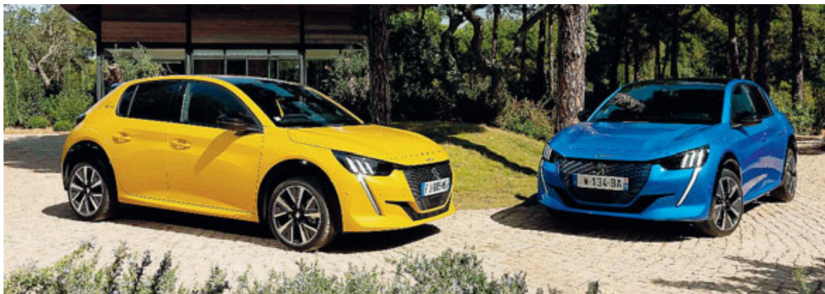
La nuova 308, in vendita da novembre anche in versione elettrica.