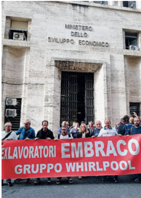
I lavoratori ieri al Mise.