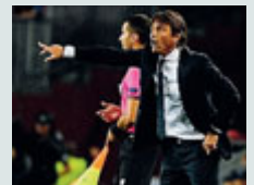
Antonio Conte.

terner di Ronaldo: Higuain favorito su Dybala, comunque. Duello nella sfida, quello tra Conte e Sarri. I quali non si sono mai incontrati, semmai, avvicendati: nel 2006-07 i due di alternarono alla guida dell'Arezzo (serie B): Conte dall'inizio fino alla nona giornata (esonerato), quindi Sarri dalla decima alla 28esima (esonerato)