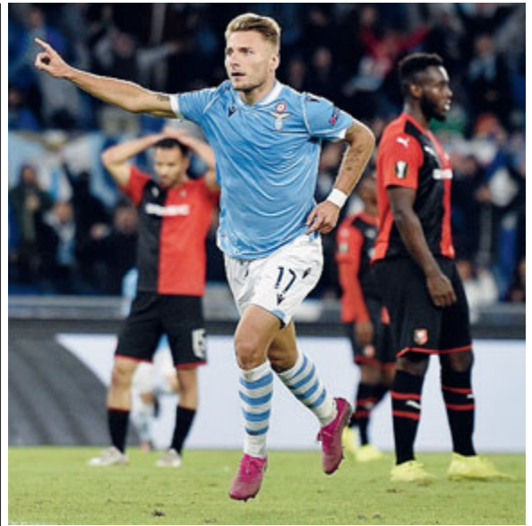
Immibile: del bomber il gol vittoria.

«Ho vissuto un'estate difficile, ero impegnato nella riabilitazione ma vedevo che la mia testa voleva fare qualcosa che il corpo non reggeva più». Ha detto così l'ex centrocampista della Juve Claudio Marchisio, che ieri ha annunciato l'addio al calcio giocato. «Se non è più possibile dare il meglio è giusto prendere una decisione - ha aggiunto Marchisio - sono arrivate offerte importanti da altri Paesi, ma non avrei potuto rispettare gli accordi». «Adesso comincia un nuovo percorso, non so cosa farò, negli ultimi anni ho portato avanti attività fuori dal calcio». Fra i momenti indimenticabili, Marchisio ricorda l'anno in Serie B: «anche se ero in B indossavo la maglia della Juve, era il mio sogno». Fra i gol più belli «quello con l'Inter e il primo allo Juventus Stadium, indimenticabile. Vorrei rigiocare la finale di Champion contro il Barcellona».