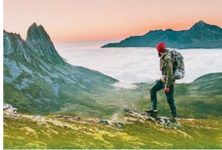
In palio un photosafari in Africa/ METRO

5 dicembre 2019 e come premio riceveranno la pubblicazione sul nostro giornale il 10 di dicembre. Dal 5 dicembre la seconda fase in cui le 6 foto per ciascun paese saranno giudicate da una Giuria internazionale che sceglierà la foto che vincerà il Metro Photo Challenge 2019. Per il vincitore, che sarà reso noto il 12 dicembre, in palio un viaggio per fare un reportage fotografico in Africa.