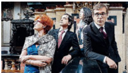
Il New Ensemble Xenia Turin.

In alternativa, domani al FolkClub (ore 21.30, euro 25), ecco Eugenio Beninato coi travolgenti ritmi del Sud, mentre al Circolo della musica di Rivoli ascolteremo il folk-pop dei canadesi The Strumbellas , emersi anni fa col singolo "Spirits", hit da oltre 60 milioni di visualizzazioni su YouTube.